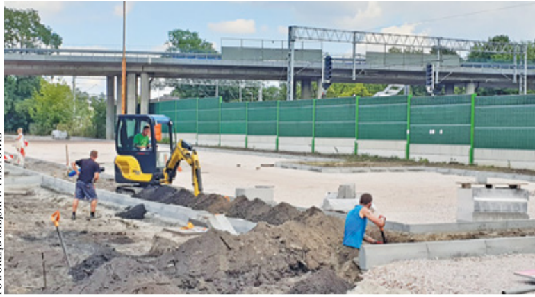
Inwestycja w toku

Władze Piastowa kontynuują działania związane z budową parkingów. Miasto przeprowadziło postępowanie przetargowe, do urzędu wpłynęło jedenaście ofert. Po przeprowadzeniu analizy dokumentów wyłoniono wykonawcę Parkuj i Jedź przy ul. Poniatowskiego.