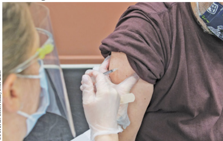
Konkurs dotyczy odsetka mieszkańców, którzy przyjęli pełną dawkę szczepienia przeciw COVID-19

Od kilku miesięcy trwają rządowe konkursy na najwyższy odsetek wyszczepionych mieszkańców. W pierwszym z nich – „Gmina na medal #SzczepimySie” – pierwsze 500 gmin, które osiągną poziom zaszczepienia minimum 67%, otrzyma 100 tys. zł. Konkurs będzie trwał do wyczerpania puli. Jeśli mniej niż 500 gmin osiągnie pułap 67%, rywalizacja zakończy się 31 grudnia 2021 r.