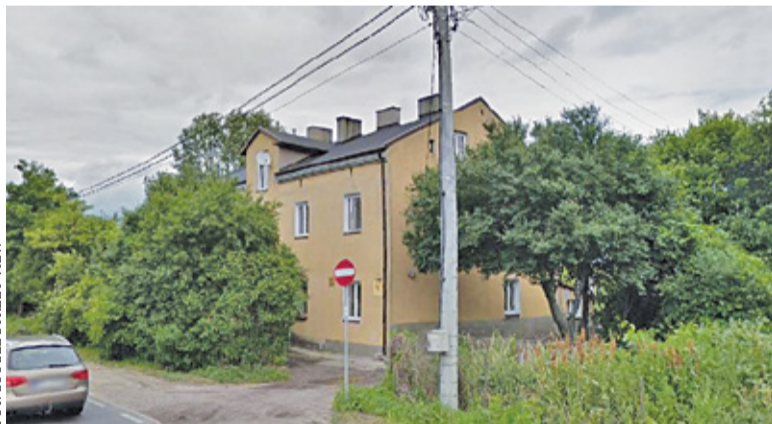
Gmina planuje również modernizację istniejących mieszkań komunalnych

Plany grodziskiego magistratu nie są nowością. Pierwsze informacje na ten temat pojawiły się już wiosną 2019 roku. Inwestycja musiała czekać na swoją kolej; bardziej priorytetowe były dwa inne kosztowne zadania: przebudowa ciągu ulic Kijowskiej, Łagodnej, Drozda i Króliczej oraz budowa szkoły w Szczęsnem. Teraz, gdy obie inwestycje są już gotowe, czas na mieszkania w Natolinie. Właśnie trwa postępowanie przetargowe.