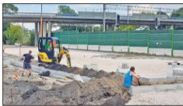
/// Piastów - Budowa Parkuj i Jedź s. 2