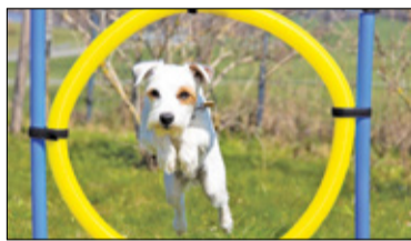
/// Grodzisk Mazowiecki - Psi park zabaw unieważniony s. 4