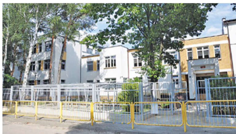
Od września uczniowie będą się uczyć w nowych, lepszych warunkach

lica. Pierwsze i drugie piętro zajmują sale lekcyjne – łącznie jest ich sześć. Z kolei piwnice pod nową częścią będą służyć jako magazyny. Na wszystkich kondygnacjach pojawiły się także toalety przystosowane do potrzeb osób z niepełnosprawnościami. – Wszystkie sale lekcyjne w rozbudowanej części szkoły są wyposażone w nowoczesny sprzęt np. tablice multimedialne z projekтором. Przestronne hole będą pełnić funkcję stref wypoczynku oraz miejsc spotkań podczas przerw – opisuje brwiński magistrat. Oprócz rozbudowy samego gmachu, wykonawca zajął się