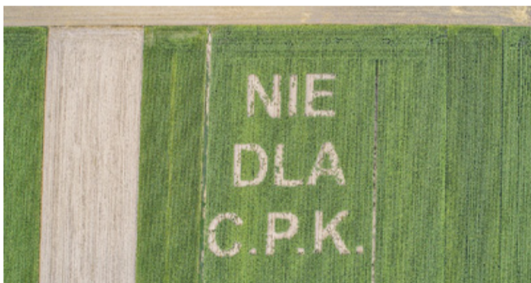
W najbliższych dniach planowany jest strajk przeciwko budowie CPK