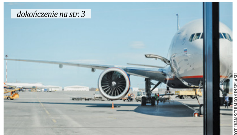
dokończenie na str. 3

Kolejnym istotnym elementem jest wprowadzenie szczególnych zasad gospodarowania nieruchomościami, planowania i zagospodarowania prze-