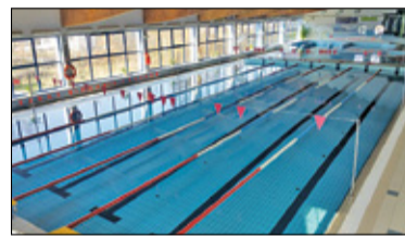
/// Pruszków - Termomodernizacja pływalni Kapry s. 5