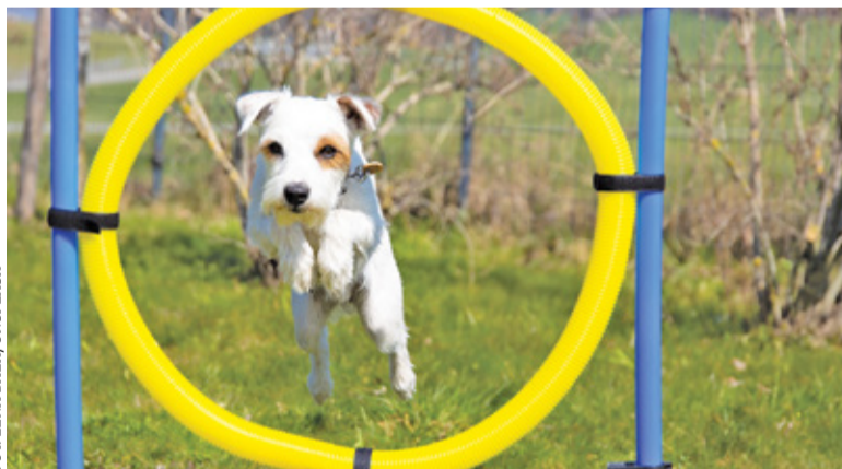
Projekt zakładu m.in. zamontowanie urządzeń do treningów agility

Projekt zakłada stworzenie miejsca, w którym właściciele psów będą mogli nie tylko pobawić się ze swoimi czworonogami, ale również trenować z nimi posłuszeństwo. W psim parku zabaw ma się znaleźć także urządzenia do ćwiczeń agility: tunele, równoważnie, obręcze do skoków czy tor do slalomu. Całość terenu ma być ogrodzona. Na placu pojawiają się także nasadzenia zieleni i mała architektura, w tym ławki, stojak rowerowy oraz dwa rodzaje