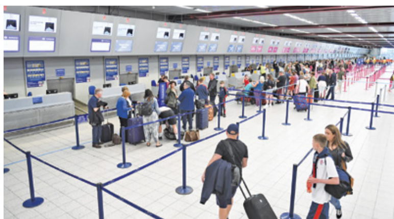
Docelowo nowe lotnisko ma obsługiwać 100 mln pasażerów rocznie

Rozporządzenie nakłada także nowe obowiązki na samorządy. Zgodnie