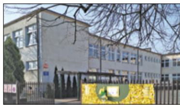
/// Michałowice - Debata o edukacji s. 2