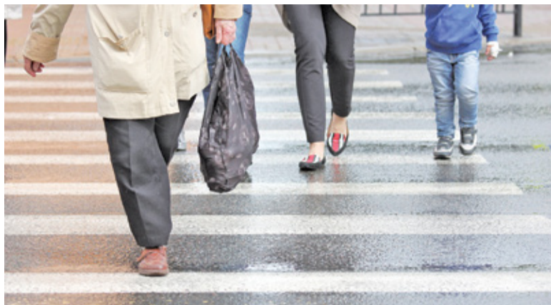
Do powiatu pruszkowskiego trafi ponad 1,2 mln zł

Powiat pruszkowski otrzymał 1,2 miliona złotych w ramach Rządowego Funduszu Rozwoju Dróg na poprawę bezpieczeństwa na przejściach dla pieszych. Środki trafiły również do gmin z naszego regionu. Sprawdź, gdzie będzie bezpieczniej.