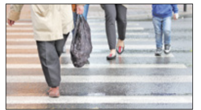
/// Powiat pruszkowski - Bezpieczniej na pasach s. 5