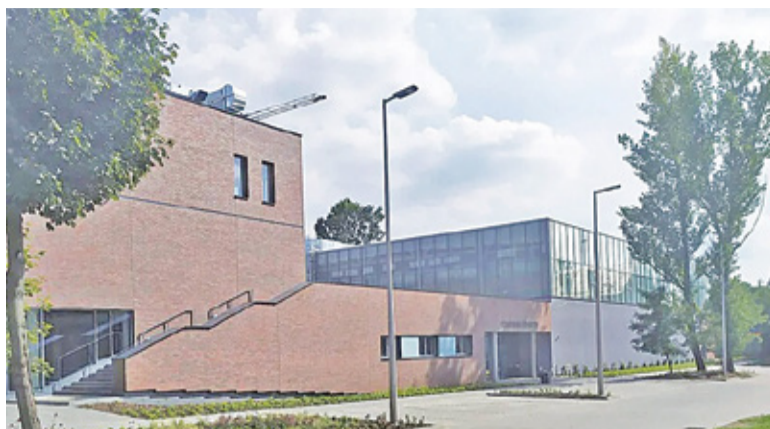
Liceum im. Adama Mickiewicza

Sprawdzamy, co w wakacje dzieje się w piastowskich placówkach oświatowych. W Przedszkolu Miejskim nr 1 zostanie wymieniony piec grzewczy, z kolei w Przedszkolu Miejskim nr 2 założono klimatyzację w gabinecie dyrektora, wykonano konserwację klimatyzacji w kuchni oraz konserwację dźwigu. Naprawa instalacji odgromowej była konieczna w Przedszkolu Miejskim nr 3,