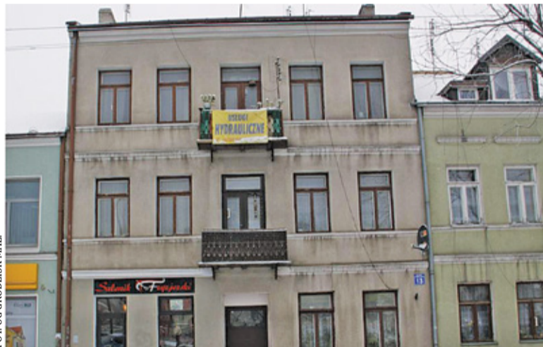
Kamienice zostały objęte ochroną konserwatorską, co może utrudnić ich rewitalizację

Niedawno władze Grodziska ogłosiły plany związane z rewitalizacją miejskiego deptaka. Projekt zakłada m.in. wymianę nawierzchni wokół kościoła św. Anny, utworzenie zielonej strefy wypoczynkowej czy przystosowanie części placu pod stoiska handlowe czy usługowe na wolnym powietrzu (np. ustawienie straganów podczas miejskich imprez). W planach uwzględniono także retencję wód opadowych. Podobnie jak w przypadku Placu Wolności (o czym pisaliśmy w ubiegłym tygodniu),