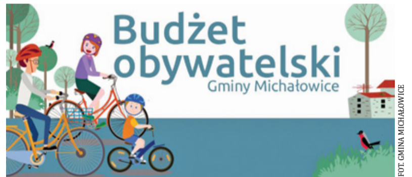
Czas na decydującą fazę

18 projektów oceniono negatywnie. Wśród głównych powodów należy wymienić: brak prawa do dysponowania przez gminę nieruchomością, na której miał być zrealizowany wniosek, przekroczenie puli środków – 175 tysięcy złotych na jedno zadanie czy też