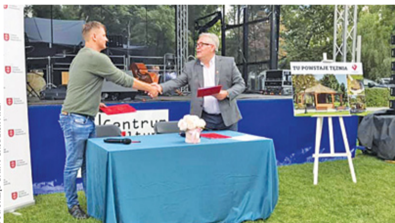
Podpisanie umowy odbyło się w Parku Skarbków, gdzie powstanie tężnia

W zakres prac wchodzi nie tylko budowa samej tężni. Wykonawca będzie miał również za zadanie utwardzić teren wokół konstrukcji i wykonać ścieżki piesze. Ponadto przy tężni pojawią się elementy małej architektury: ławki, kosze na śmieci czy stojaki na rowery. Teren zostanie także oświetlony, a po zakończeniu prac ziemnych firma będzie musiała odtworzyć trawniki.