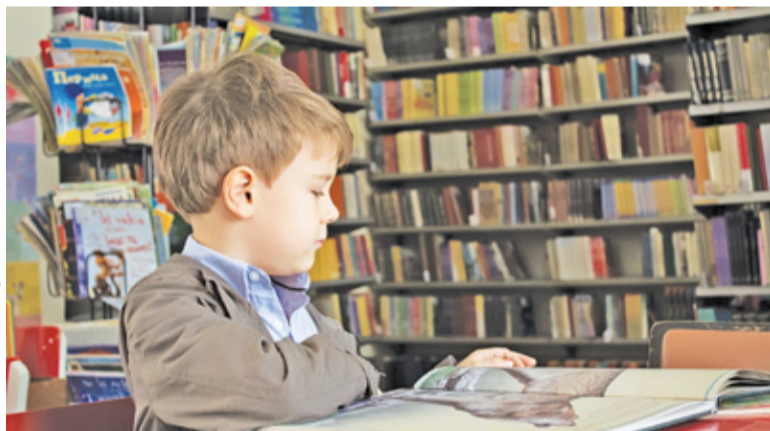
Jednorazowo możemy otrzymać 300 zł na wyprawkę dla każdego dziecka

Nabór wniosków ruszył 1 lipca. Rodziców, którzy chcą ubiegać się o świadczenie, czeka w tym roku szereg zmian. Najważniejszą z nich jest instytucja wypłacająca świadczenie. Dotychczas bowiem wnioski należało składać w tych samych instytucjach, które zajmują się realizacją programu