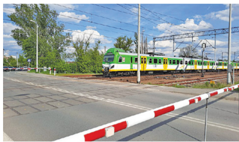
Sędzia wziął pod uwagę, że widoczność dróżnika na przejeździe mogła być ograniczona