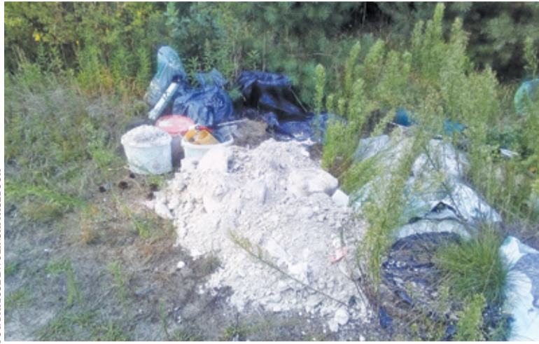
Fotopułapek będzie więcej

Efekty są widoczne. Śmieci pojawiły się na ul. Myśliwskiej w Ruścu, ale strażnikom gminnym udało się po