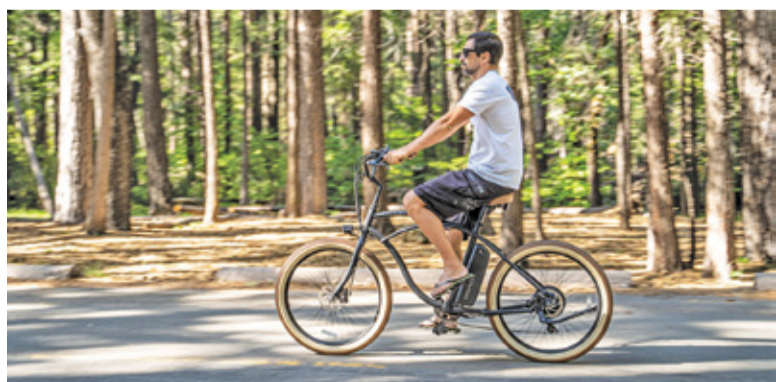
Warunkiem klasyfikacji dziecka jest start i ukończenie zmagania przez tatę

O 10.40 na trasę ruszą dzieci urodzone w latach 2010-2015. Dla nich przygotowano blisko 2400-metrową trasę po parku. W zależności od wie-