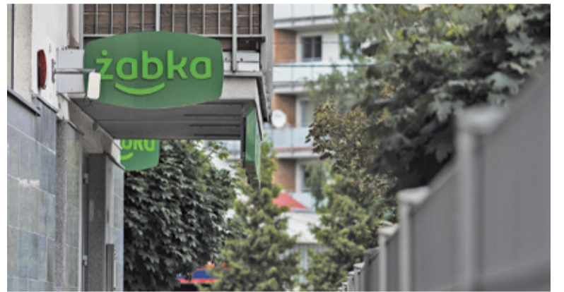
Potrzebna konsultacja medyczna? Zapraszamy do sklepu spożywczego

Aby skorzystać z samej usługi wystarczy dokonać w Żabce zakupu jednego z dwóch rodzajów voucherów.