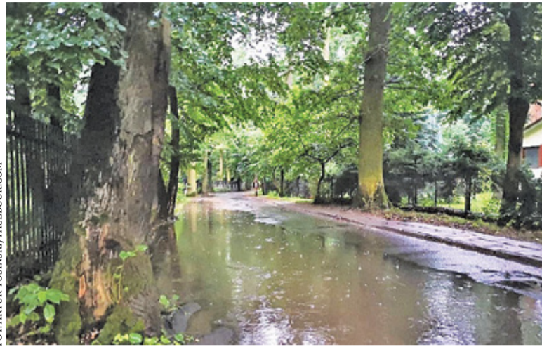
Po remoncie powinien zniknąć problem z zalewaniem ul. Kwiatowej

– Po wielu przeszkodach (występowała też kolizja z energetyką) i walce o