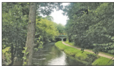
||| Pruszków - Brak wiedzy przyczyną kontrowersji s. 3