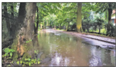
||| Podkowa Leśna - Drogi do remontu s. 2