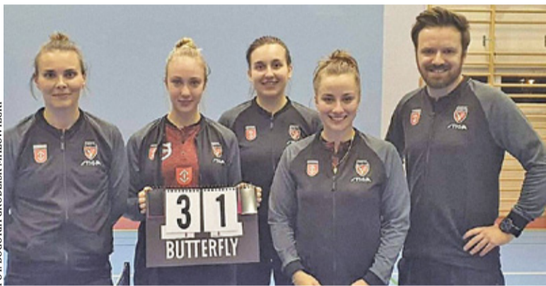
Bogoria pokonała MUKS 3:1