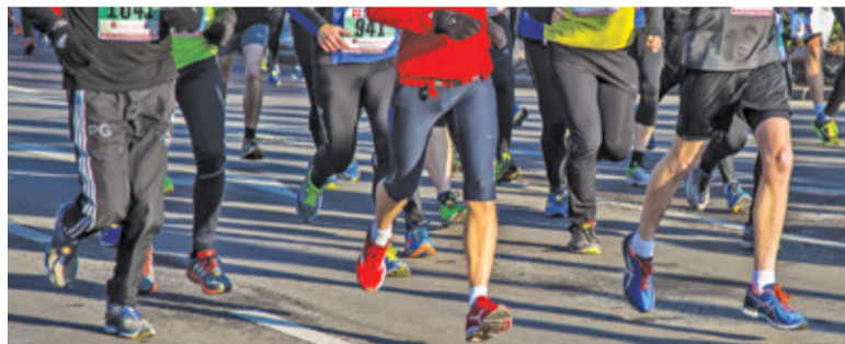
Biegacze będą przemieszczać się parkowymi ścieżkami, ale nie zabraknie elementów asfaltowych

Odpowiedni strój, rozgrzewka i ruszamy. Wiele osób w codziennym planie uwzględnia bieganie jako element troski o zdrowie i formę. Niektórzy chcą coraz więcej. Stawiają sobie cele w postaci przełamywania kolejnych barier i zapisują się do uczestnictwa w zawodach. Znakomita okazja, aby się sprawdzić nadarza się 18 września w Pruszkowie.