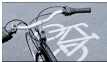
||| Nadarzyn, Brwinów - Porozumienie podpisane s. 4