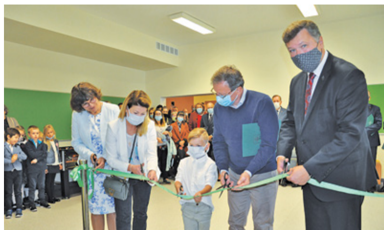
Otwarcie nowego skrzydła szkoły zostało połączone z rozpoczęciem roku szkolnego dla dzieci z klas pierwszych

Otwarcie nowego skrzydła szkoły zostało połączone z rozpoczęciem roku