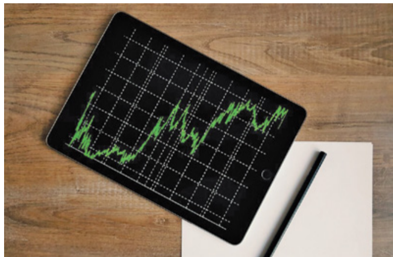
Rekordowa inflacja w Polsce może wymusić podwyżkę stóp procentowych

Wyższe stopy to również wyższy łączny koszt odsetek płaconych w całym okresie trwania umowy. Gdyby przy powyższym założeniu przez 25 lat stopy