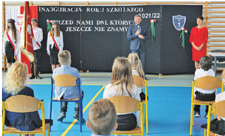
Prezydent na rozpoczęciu roku szkolnego w SP1

wspólnych we wszystkich szkołach, przedszkolach i żłobkach. Z kolei straż miejska wykonała kontrolę terenów wokół placówek oświatowych pod ką-