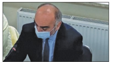
||| Piastów - Lokomotywa na jubileusz s. 10