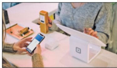
||| Grodzisk Mazowiecki - Zniżki w telefonie s. 2