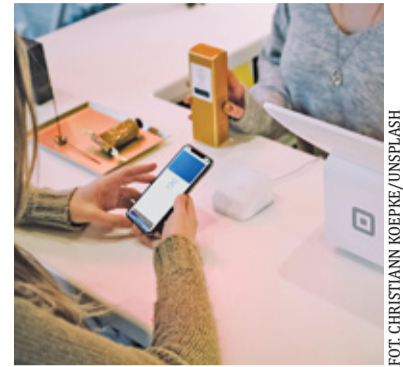
Elektroniczna Karta Mieszkańca daje te same przywileje, a jednocześnie zapobiega zgubieniu dokumentu

Taki system od kilku lat działa również w Grodzisku Mazowieckim. Władze gminy zachęcają mieszkańców, by korzystali z elektronicznej Karty Mieszkańca.