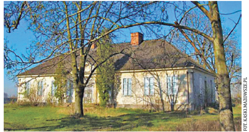
Dworek ma zyskać m.in. nowe pokrycie dachowe oraz stolarkę drzwiową i okienną