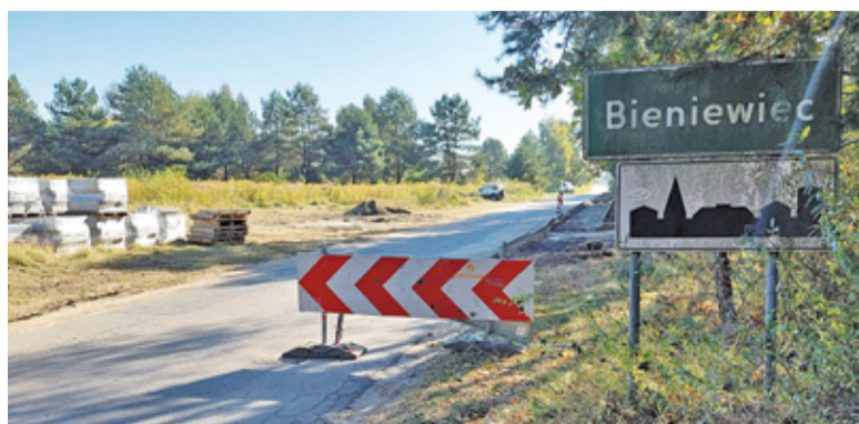
Ta droga prowadzi z Żabiej Woli do Grodziska Mazowieckiego

(droga publiczna nr 150605W). Dla mieszkańców gminy Żabia Wola to jedna z głównych dróg dojazdowych do Grodziska Mazowieckiego. Inwestycja obejmie budowę asfaltowej jezdni szerokości 5,5 m, chodnika z kostki asfaltowej (2 m szerokości) oraz zjazdów indywidualnych oraz publicznych wykonanych z brukowej kostki betonowej.