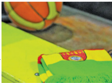
W trzeciej kwarcie gospodarze rozbili gości

Koszykarze z Pruszkowa nadal czekają na zwycięstwo w nowym sezonie. W 3. kolejce Znicz Basket przegrał 64:103 z AZS UMCS Start II Lublin.