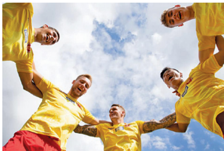
Spotkanie idealnie rozpoczęło się dla gości z Pruszkowa

przedarł się w pole karne gospodarzy i znalazł sposób, aby skierować piłkę do bramki. Wisła była podrażniona i ruszyła do odrabiania strat. Gospodarze próbowali wyrównać, ale brakowało im celności bądź między słupkami dobrze spisywał się Miształ.