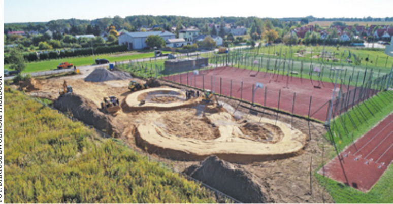
Prace przy budowie pumptracka w Ruścu

Pandemia koronawirusa pokazała nam, jak ważne jest, mówiąc najprościej, wyrwanie się z domu. To jeden z powodów decyzji władz gminy o budowie basenów letnich w Strzeniówce. Samorząd szykuje kolejne atrakcje. Na zagospodarowanym kilka lat temu i funkcjonalnym terenie Pastewnika w