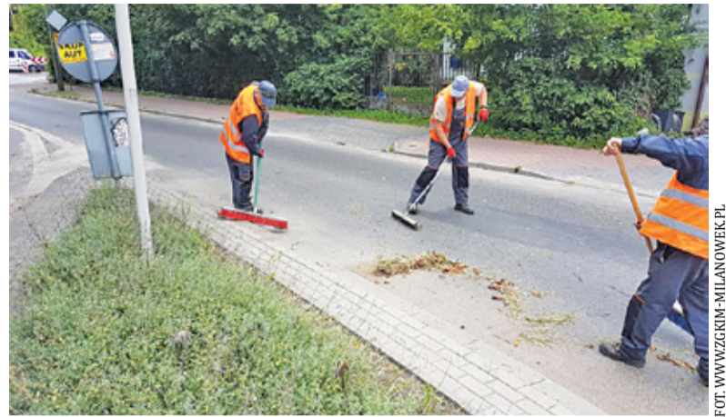
Do zadań ZGKiM należy m.in. utrzymywanie zieleni miejskiej i sprzątanie ulic

W ubiegły czwartek posiedzenie Komisji Budżetu i Inwestycji Rady Miasta Milanówka poświęcono omówieniu sytuacji finansowej ZGKiM oraz sprawom zarządzania targowiskiem miejskim, które także jest w gestii zakła-