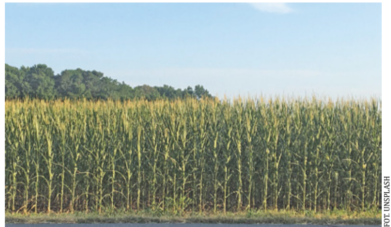
W gminie Baranów mieszka 5 tysięcy ludzi. Wielu z nich to rolnicy

Na początku października przedstawiciele CPK i Krajowego Zasobu Nieruchomości podpisali list intencyjny zobowiązujący KZN do wytypowania i przygotowania nieruchomości zamiennych do zabudowy dla osób, które zdecydują się skorzystać z Programu Dobrowolnych Nabyć. Na przełomie października i listopada ogłoszone będą szczegóły, m.in. lokalizacja nieruchomości do planowanej zabudowy mieszkaniowej, a także zasady finansowania inwestycji, nadzoru nad nimi i ich realizacji. Współ-