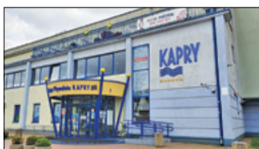
||| Pruszków - Basen zostanie zamknięty s. 2

GRODZISK MAZOWIECKI ||| BARANÓW ||| JAKTORÓW ||| PODKOWA LEŚNA ||| MILANÓWEK ||| ŻABIA WOLA PRUSZKÓW ||| PIASTÓW ||| BRWINÓW ||| MICHAŁOWICE ||| NADARZYN ||| RASZYN