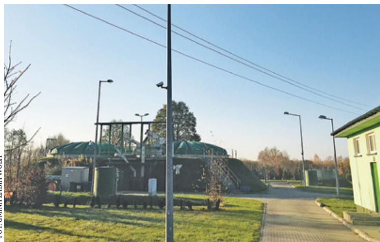
Istniejąca w Gminie Żabia Wola oczyszczalnia wystarcza na potrzeby mieszkańców, ale konieczna jest jej modernizacja jeśli ma im sprostać w najbliższych latach

Realizacja tego planu to duża inwestycja, wymagająca nie tylko rozbudowy i modernizacji oczyszczalni, ale także budowy sieci kanalizacyjnej. Celem jest usprawnienie funkcjonowania oczyszczalni pod względem technologicznym i osiągnięcie przepustowości tysiąca metrów sześciennych na dobę. Ta ilość zaspokoi potrzeby gminy na najbliższe 20 lat. Aby jednak plan podłączenia trzykrotnie większej liczby domów do