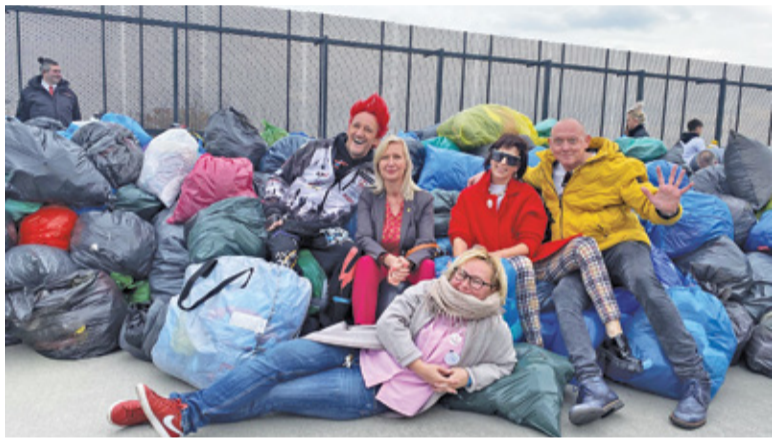
Po raz kolejny mieszkańcy pokazali, że mają ogromne serca