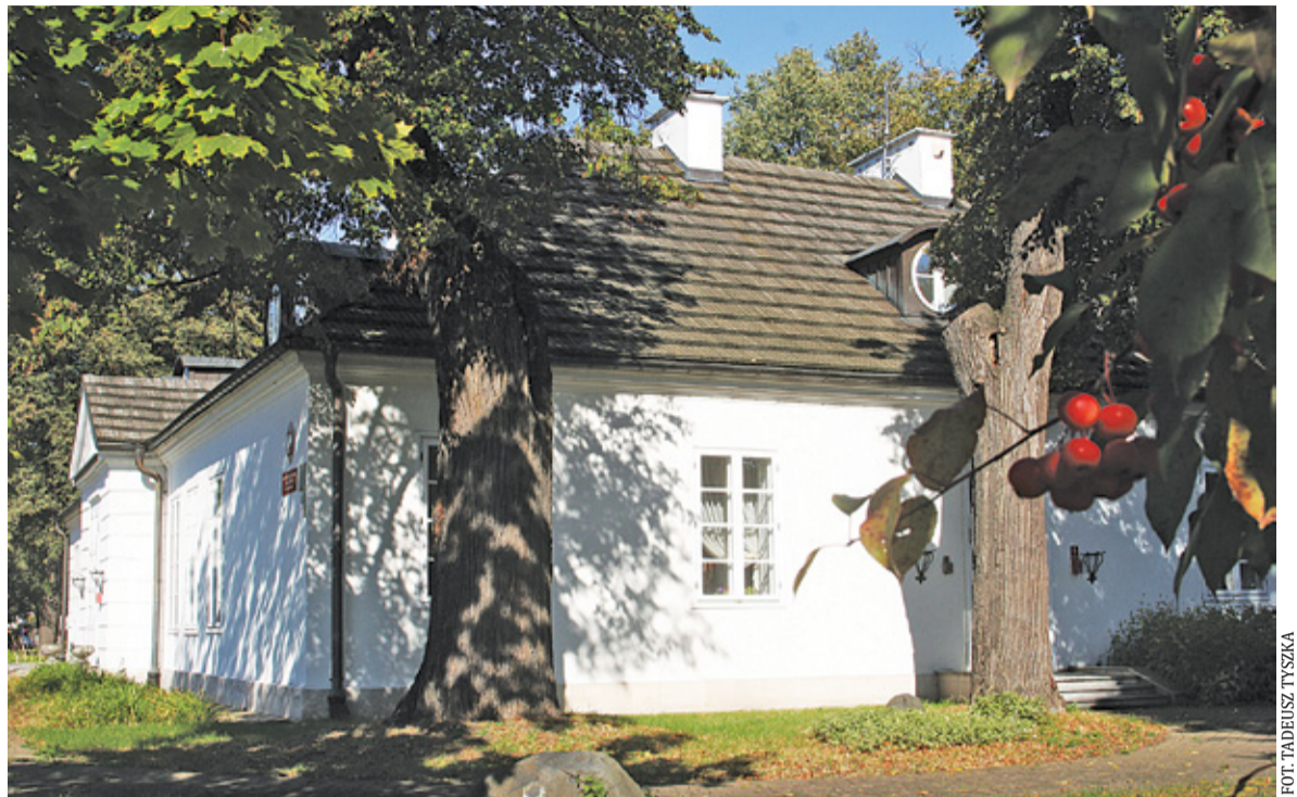
Odrestaurowany dworek Mokronoskich i fragment ogrodu w Jordanowicach

Branicki do swojej białostockiej rezydencji sprowadził trzy małżonki: zmarłą wcześniej Katarzynę Radziwiłłównę, córkę kanclerza litewskiego; Barbarę Szembekównę, rozwiedzioną z Sewerynem Rzewuskim, która nie utrzymała jednak przy sobie magnata i wojownika i zmuszona była do ponownego rozwodu, wreszcie w wieku już podeszłym, bo był pod sześćdziesiątkę, Branicki wstąpił w związek małżeński z 18-letnią Izabellą Poniatowską, rodzoną siostrą przyszłego króla. Małżeństwo to miało cele polityczne i nie mogło być