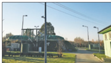
||| Żabia Wola - Taniec i czystość s. 7