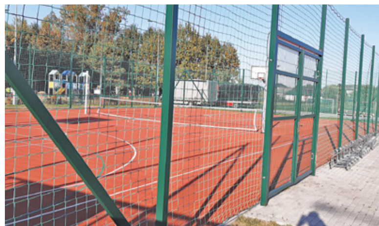
Widok na boiska

Wolica to tylko przykład działań nadarzyńskiego samorządu. W ostatnich latach gmina inwestuje w rekreację w kolejnych miejscowościach. – W podobny sposób rozwijamy tereny rekreacyjne w Strzeniówce, Ruścu, Starej Wsi, czy na nadarzyńskim Pastewniku. Pumptracki,