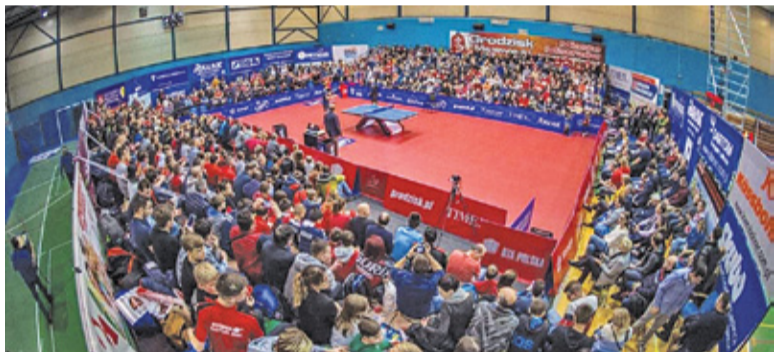
W Grodzisku będzie toczyła się walka o awans do ćwierćfinału europejskich rozrywek

Trzy dni intensywnej rywalizacji. Nie będzie czasu na zmęczenie, błąd, liczy się wytrzymałość i konsekwencja. Bogoria zmagania rozpocznie od meczu z zespołem z Czechem. Z El Nino Pra-