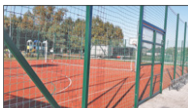
||| Nadarzyn - Rozwój terenów zielonych s. 5