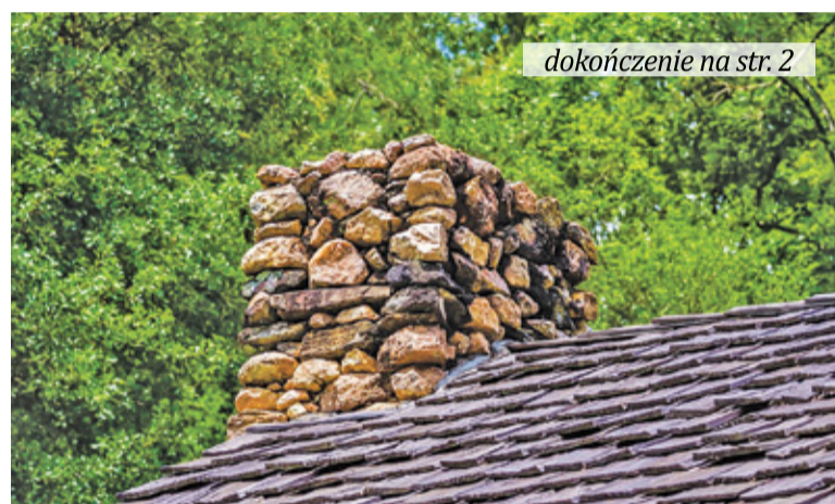
dokończenie na str. 2

W podwarszawskich gminach nadal kopci ponad 70 tys. pieców, które są groźne dla środowiska.