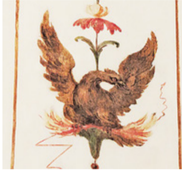
Fragment polichromii z XVIII w. J.B. Plerscha

Jordanowice, dworek Mokronoskich. Niegdyś obszerny park, zamieniony dziś w niewielki dziedziniec szkoły muzycznej, tonący w jesiennym słońcu, nastroja romantycznie. Z dwóch otwartych na poddaszu okien słychać dźwięki muzyki, ktoś usiłuje zagrać poprawnie gamę. Ta niezgrabna muzyka przyszłego wirtuoza, ten słoneczny kolor