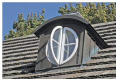
Fragment dachu z lukarną na budynku dworku w Jordanowicach