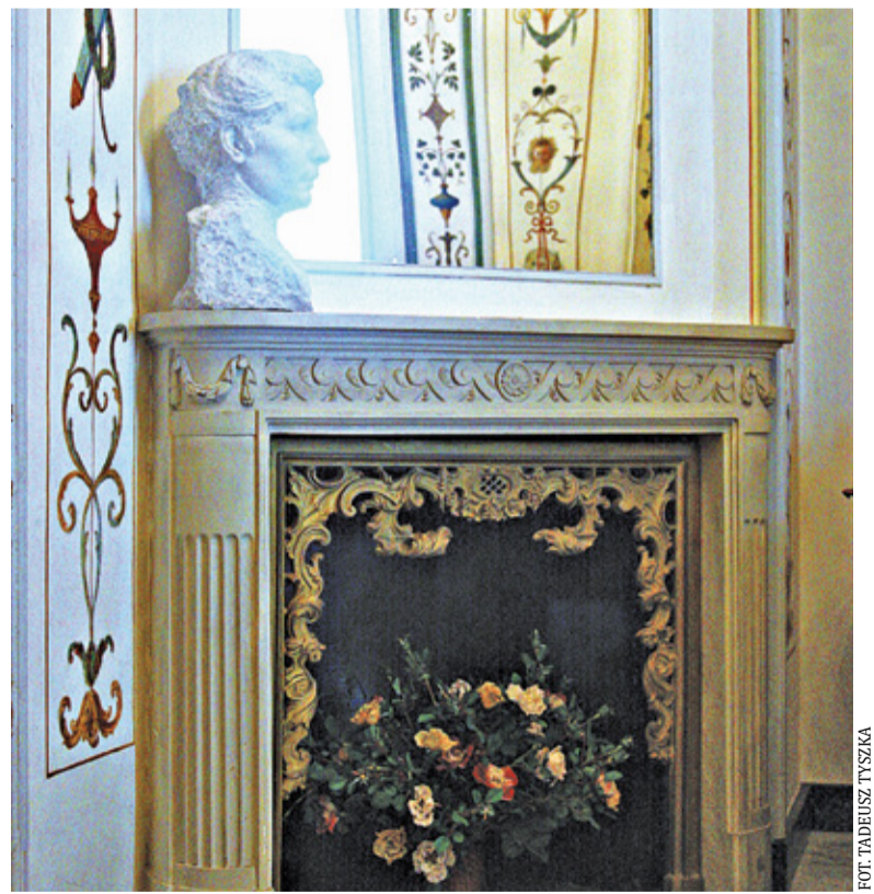
Dworek w Jordanowicach – westybul z kominkiem i lustrem

hetmański, imć pan Andrzej Mokronoski, późniejszy starosta ciechanowski i generał. Mokronoski uwielbiany był przez kobiety, pamiętano mu przygodę z piękną Włoszką, hrabianką Castelli. Castelli została porwana przez Andrzeja, wzięli pospieszny ślub, zniknęli na jakiś czas i potem... równie szybko się rozeszli. Tajemniczość tego wydarzenia i uroda Mokronoskiego oraz jego koneksje z Branickim, który uważał go za największego przyjaciela, dawały mu wstęp do najbogatszych salonów w państwie, szczególnie gdy zapraszały kobiety. Było do przewidzenia, że uroczą gospodynię białostocka i żołnierz, przyjaciel męża, w końcu się w sobie zakochają. Jan Klemens Branicki nie nadawał się na statecznego małżonka, najlepiej czuł się w siodle, z buławą w rękę, w rycerskich posługach dla ojczyzny. Izabelę kochał jak córkę i kupował