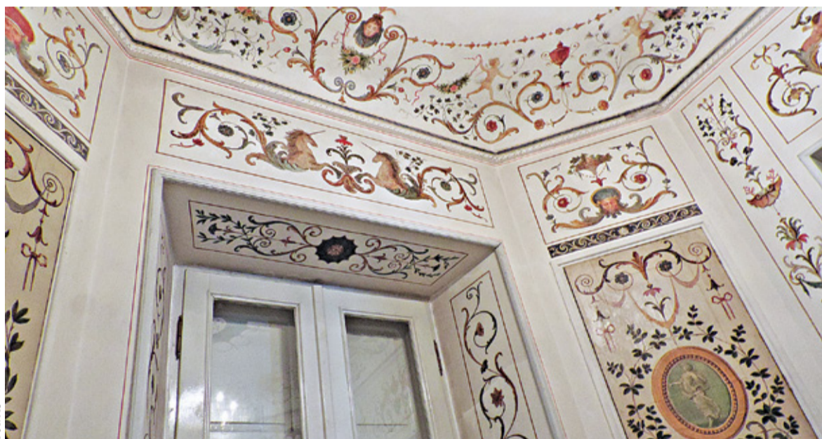
Fragment fresku z XVIII w. J.B. Plerscha

niem oka, a że wszyscy uwielbiali hucznie zabawy, to się bawiono. Hucznie więc obchodzono na św. Jana imieniny hetmana, a na św. Elżbiety – imieniny żony. Na przyjęciach płynęły rzeki tokaju, a na