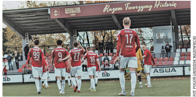
Szósta porażka Pogoni w sezonie stała się faktem