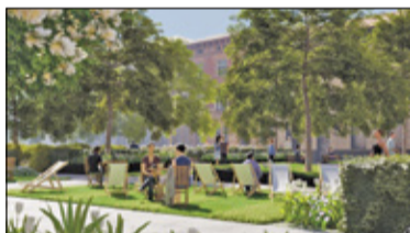
||| Grodzisk Mazowiecki - Odnowiony Plac Wolności s. 6