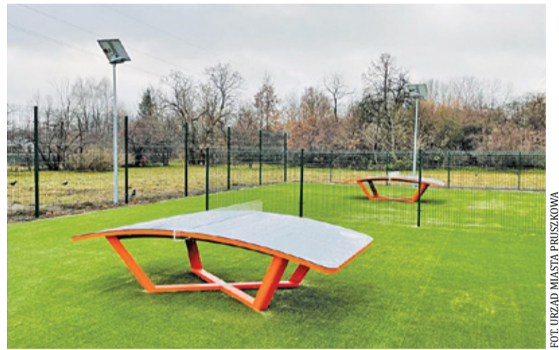
Dwa nowoczesne boiska do teqballa to dobra okazja do aktywności na świeżym powietrzu

Warto dodać, że inwestycja została zrealizowana jako zadanie w ramach budżetu obywatelskiego. 24 listopada została przeprowadzona procedura od-