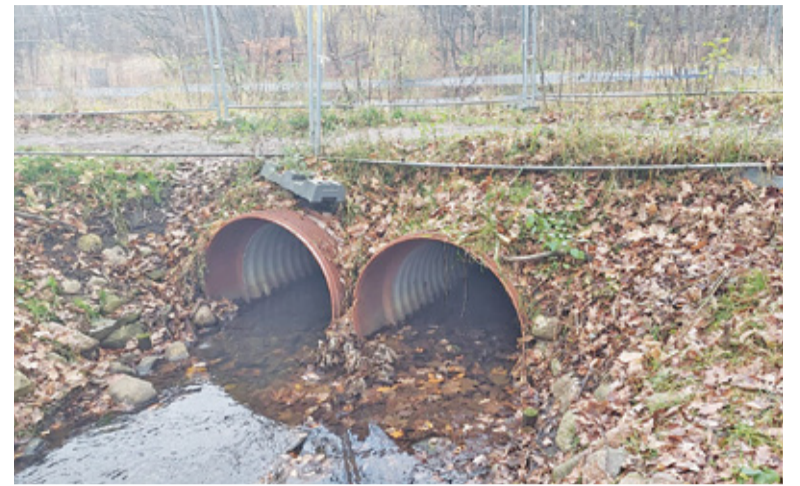
Ujście Niwki do stawu, czyli w wejście do dwóch rur

– W 2016 roku został uchwalony program uregulowania gospodarki wodnej na terenie gmin Podwarszawskiego Trójmiasta Ogrodów, który zakładał wybudowanie dwóch dodatkowych stawów retencyjno – przeciwpowodziowych, w Podkowie i Brwinowie,