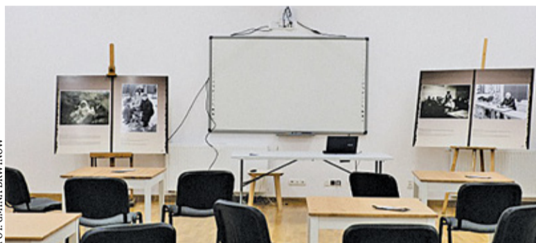
Doposażono 4 świetlice

Koszt zakupu sprzętu wyniósł 56 800 złotych. Gmina Brwinów otrzymała na ten cel dofinansowanie w wysokości ponad 36 tysięcy złotych. Projekt zrealizowano z pośrednictwem LGD „Zielone Sąsiedztwo” ze środków poddziałania