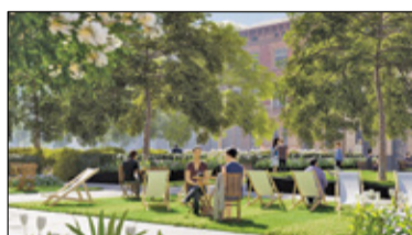
Grodzisk Mazowiecki – Zielono i niebiesko s. 2