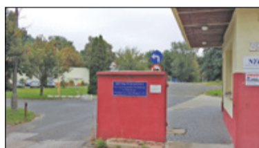
Pruszków – Koniec rozbudowy blisko s. 2