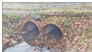
Podkowa Leśna – Rury pod stawem s. 9