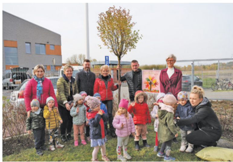
Akcja sadzenia drzew w placówkach oświatowych