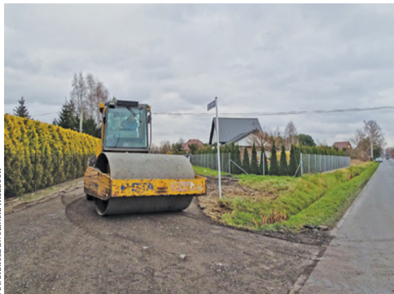
Drogi zyskały nową nawierzchnię

W gminnej kasie zostały oszczędności, a więc samorząd pod koniec roku