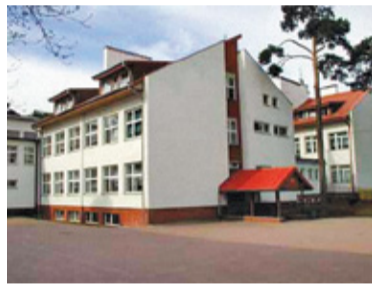
Szkoła w Komorowie

C zas świąt to wyjątkowy okres, w którym myślimy o drugim człowieku. O samotnych, starszych, tych potrzebujących naszej pomocy. Uczniowie szkoły z Komorowa prowadzą zbiórkę w ramach akcji Bożonarodzeniowa Paczka dla Bohatera.