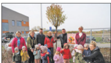
Pruszków – Nowe nasadzenia s. 5