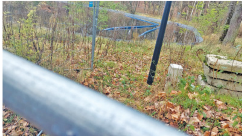
W tym miejscu miały powstać nowe większe przepusty, aby dopływ wody do stawu z rzeki Niwki mógł być regulowany. A są montowane dwie dużej średnicy rury, którymi ma Niwka popłynąć pod dnem stawu

Zgodnie z prawomocnym projektem na Niwce przy wlocie i wylocie ze stawu, miały powstać nowe i większe przepusty, które pozwoliłyby na regu-