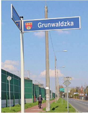
Na Grunwaldzkiej szykują się duże zmiany

5 sierpnia br. odbyło się uroczyste podpisanie umowy na realizację inwestycji. Minęły cztery miesiące, więc postanowiliśmy sprawdzić, jak wygląda sytuacja. – Obecnie trwają prace przygotowawcze, takie jak: tyczenia geodezyjne, oczyszczanie terenu, przekopy kontrolne w miejscach kolizji z infrastrukturą podziemną. Uzgadniane są z gestorami sieci szczegóły usuwania kolizji. Procedowana jest w starostwie powiatowym czasowa organizacja ruchu – otrzymaliśmy odpowiedź.