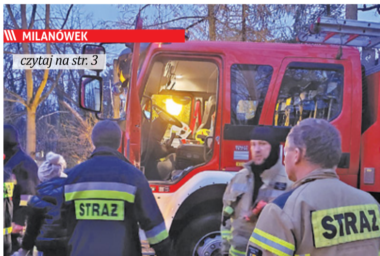
MILANÓWEK czytaj na str. 3 Pod Urzędem Miasta było ok. dziesięć wozów OSP i kilkudziesięciu druhów, m.in. z Brwinowa i Międzyborowa