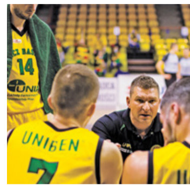
Trener Spychały ma o czym myśleć

Przyszła 10. kolejka i starcie z zespołem Rawlplug Sokół Łańcut. Rywal mocny i skuteczny. Sokół zaczął zgodnie z planem i już w pierwszej kwarcie zdobył prowadzenie – 33 : 24. Znicz Basket walczył, dzięki czemu na półmetku przegrywał tylko czterema punktami – 41 : 45. To, co stało się w ostatniej kwarcie było pokazem determinacji gości. Znicz Basket imponował skutecznością i