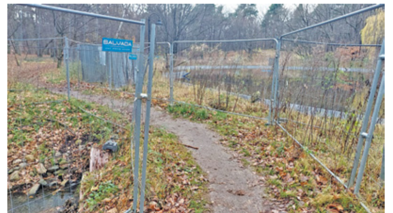
Tak wygląda otoczenie stawu w Parku Miejskim w Podkowie Leśnej Mieście Ogrodzie. Czy Urząd Miasta i Dendropolis dla wspólnego dobra nie mogą zacząć rozmawiać i współpracować?