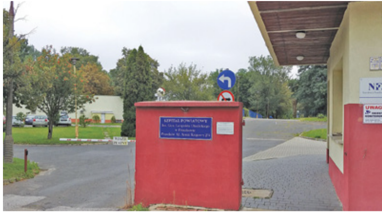
Szpital Powiatowy w Pruszkowie

Nowy pawilon zwiększy możliwości szpitala. – Docelowo w pomieszczeniach zostaną zlokalizowane blok operacyjny z salami dla oddziałów chirurgii ogólnej i ginekologii, a także sala cięć cesarskich. Przygotowane otwarte powierzchnie zostaną wykorzystane na potrzeby oddziału o nowej specjalności lub jednego z obecnie funkcjonujących, sterylizatorni i pracowni diagnostyki obrazowej. Część gabinetów otrzyma pierwsze wyposażenie – przedstawia starosta pruszkowski Krzysztof Rymuza. – Równocześnie z budową pawilonu prowadzone były prace związane z wymianą studni awaryjnego zabezpiecze-