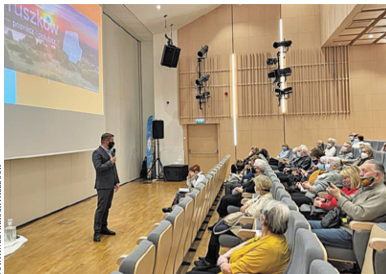
Wykład dla studentów UTW