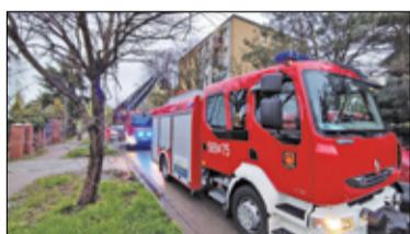
Piastów – Strażacy w trudnej sytuacji s. 4