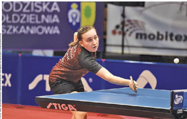
Tenisistka wygrała trzy pojedynki w zmaganiach grupowych i mogła szykować się do dalszej rywalizacji

Jak wypadli pozostali? Miłosa Redzimski wygrał trzy mecze w fazie grupowej. Kolejne starcie również za-