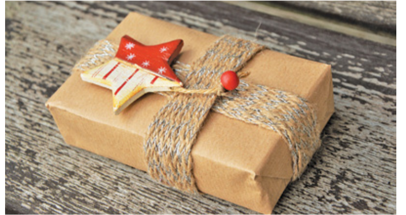
Akcja jest znakomitą okazją, aby pomóc

Do 9 grudnia zbierane są produkty żywnościowe z długim terminem ważności oraz artykuły chemiczne. Dary trafią do kombatantów z całej Polski. Co