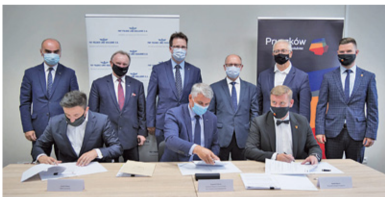
Na Grunwaldzkiej szykują się duże zmiany

Mówimy o przedsięwzięciu, którego wartość przekracza 22 miliony zł. W jego realizację zaangażowanych jest kilka podmiotów – Pruszków, Piastów, powiat pruszkowski i PKP PLK. Ranga przedsięwzięcia jest ogromna, a ostateczny efekt inwestycji ma przyczynić się do poprawy komunikacji. – Wiadukt w ciągu ul. Grunwaldzkiej i