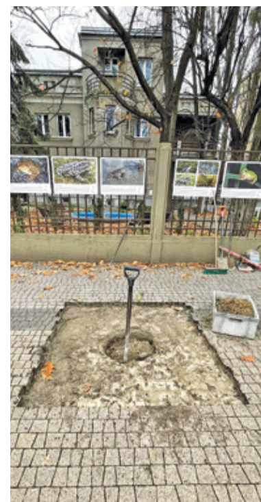
Nasadzenia na ul. Kraszewskiego

Do końca roku pojawią się kolejne nasadzenia. Miasto planuje zagospodarowanie terenów Parku Mazowsze, Anielina Wschodniego, Anielina Zachodniego, Parku Żwirowisko i Parku Potulickich. Łącznie posadzonych zo-