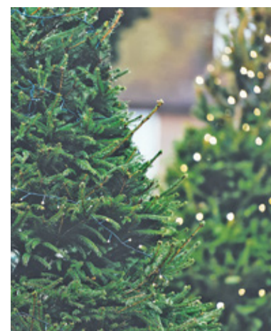
Odbiór do końca lutego

Czas na poświęteczne porządki. W Brwinowie choinki zostaną odebrane po wcześniejszym zgłoszeniu do Zespołu ds. Obsługi Gospodarki Odpadami.