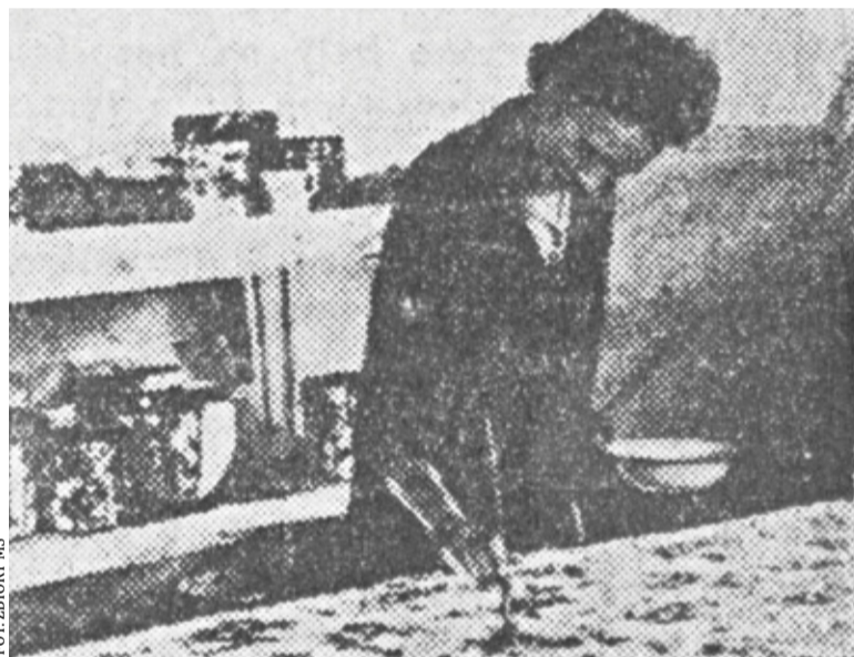
Ręczne malowanie jedwabiu w Milanówku fot: „Robotnik” 1946 r.

ników, a wyniki badań prowadzonych przez Pasteura w Ales we Francji dają możliwość bezpiecznej hodowli bez strat. Gwoli wyjaśnienia: około roku