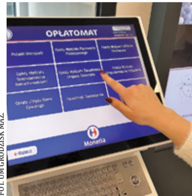
Opłatomat zainstalowany w Urzędzie Miejskim w Grodzisku Mazowieckim pomaga załatwić sprawy związane z opłatami, gdy kasa urzędu jest nieczynna

Jeśli więc interesant ma zapłacić np. za obrys i wyrus swojej działki – na ekranie opłatomatu znajduje kafelek z nazwą Wydział Planowania Przestrzennego, który tego typu sprawę prowadzi. Jeśli wie, ile wynosi opłata albo ta suma jest stała (wtedy opłatomat ma ją zainstalowaną i w odpowiednim momencie pokaże na ekranie), może dokonać opłaty m.in. uzupełniając dane o jakie zostały poproszone, np. swoje nazwisko czy numer działki. To wszystko pokaże się