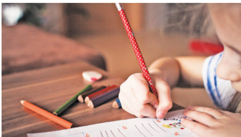
Dzieci na pewno znajdą ciekawe propozycje

Na bezpłatne warsztaty zimowe zaprasza Centrum Kultury Raszyn. Ośrodek proponuje warsztaty z Leroy