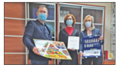
/// Michałowice – Walizka ekobadacza