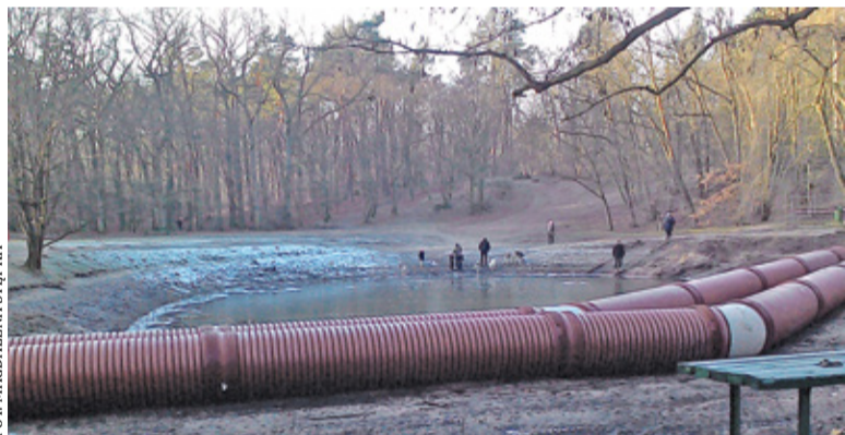
Staw pod koniec 2017 roku, czyli po rozpoczęciu inwestycji według projektu, którego realizację wstrzymała decyzja Ministerstwa Kultury i Dziedzictwa Narodowego z grudnia 2021 roku