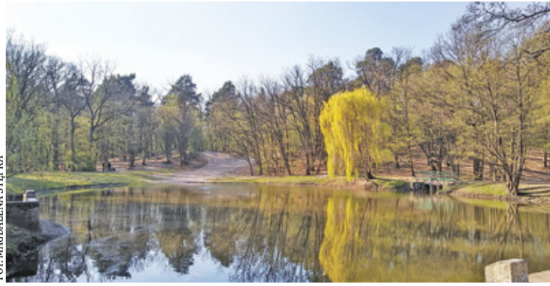
Staw wiosną 2017 roku, czyli w swoim naturalnym charakterze sprzed rozpoczęcia modernizacji