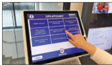
/// Grodzisk Mazowiecki – Opłatomat w urzędzie