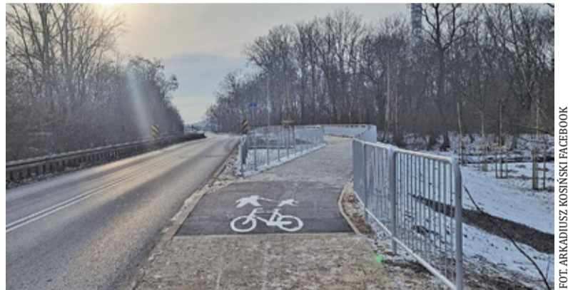
Powiat w grudniu odebrał inwestycję

Włodarz gminy Brwinów zwraca uwagę, że przez długi czas były zapowiedzi działania w kierunku wybudowania kładki. Potem temat zniknął. Po