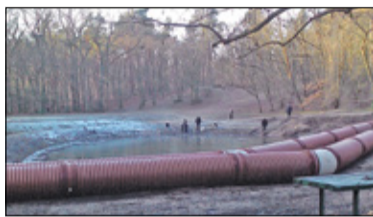
/// Podkowa Leśna – Staw niezgody