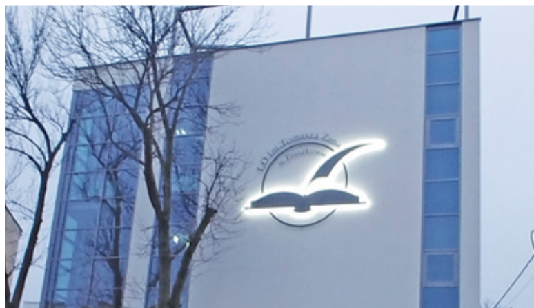
LO im. T. Zana w Pruszkowie

W ocenie techników przyjęto cztery kryteria – sukcesy szkół w olimpiadach, wyniki z matur z przedmiotów obowiązkowych, kolejny punkt z przedmiotów dodatkowych i wyniki egzaminu zawodowego. Najlepsze w kraju jest Technikum Nowoczesnych Technologii