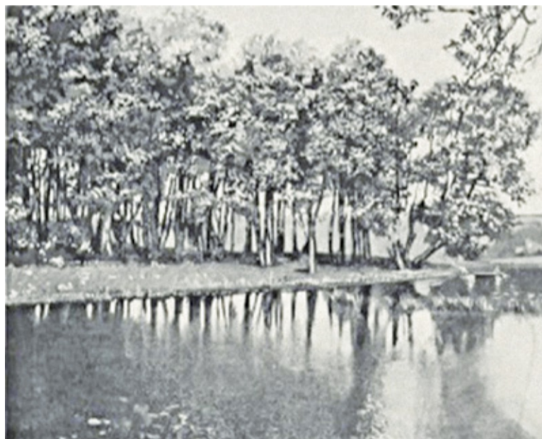
Żelazowa Wola – staw