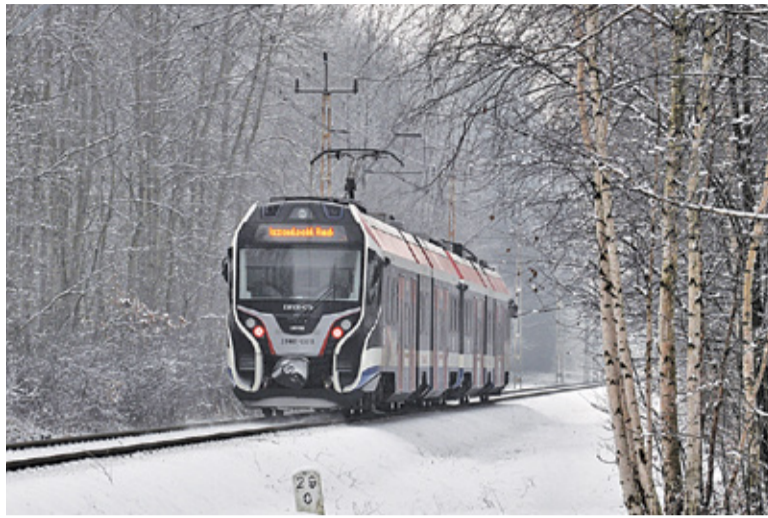
WKD to nie tylko transport, ale także malownicza trasa, która w czasie ferii oddaje klimat zimowego wypoczynku poza miastem

Ze zniżki, jaką dają przejazdy rodzinne, może korzystać każdy dorosły,