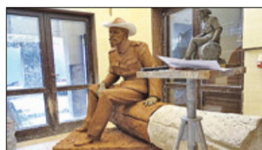
||| Brwinów - Rzeźba w sąsiedztwie ronda s. 4