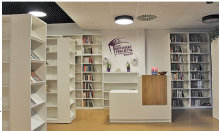
Biblioteka znajduje się w budynku liceum

Wejście do obiektu znajduje się od strony ulicy 11 Listopada naprzeciwko