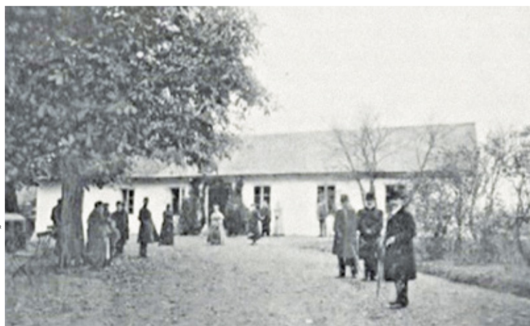
Żelazowa Wola – oficyna, w której zamieszkali Chopinowie po ślubie, tu urodził się Fryderyk