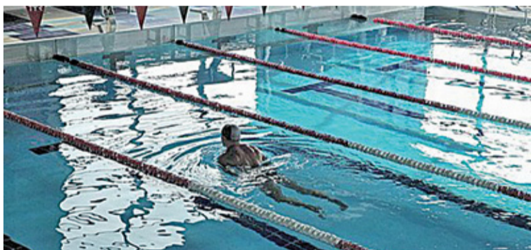
Pływalnia przy ulicy Gomulińskiego miałaby odciążyć tę przy ulicy Andrzeja

Na przeszkodzie stawały jednak kwestie finansowe, bo sama budowa to spory wydatek. Pojawił się jednak promysek nadziei w postaci dofinansowania.