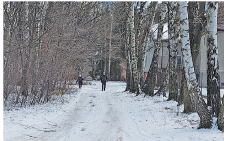
Powstanie tu drogi z prawdziwego zdarzenia to element rozwoju miasta

Zapytany o perspektywę zbudowania z gruntowego traktu drogi, zastępca burmistrza powiedział, że przejęcie przez miasto otwiera drogę do roz-