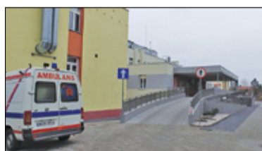
||| Powiat pruszkowski - 66 milionów na inwestycje s. 6