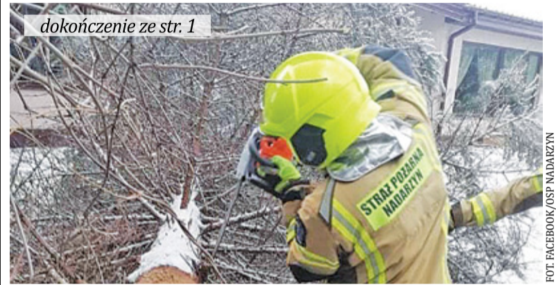
dokończenie ze str. 1

ni skutków wichury na terenie gminy Jaktorów w powiecie grodziskim. W godzinach od 10 do 19, usuwaliśmy zagrażające konary oraz drzewa przy ulicach Chełmońskiego i Matejki w Międzyborowie – opisywali strażacy. – W piątek ponownie zostaliśmy zadysponowani do pomocy lokalnym siłom na terenie gminy Jaktorów. W godzinach od 9 do 20 usuwaliśmy kolejne zagrażające bezpieczeństwu konary i drzewa