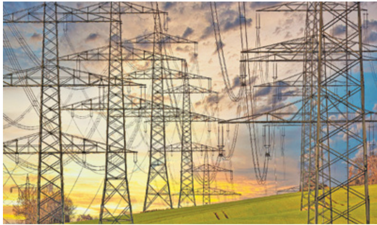
Takie widoki należą do przeszłości. Nie tylko w wielkich miastach, ale także poza nimi stopniowo będą znikać trakcje nadziemne

Napowietrzne linie energetyczne w centrum miasta zostaną zastąpione ukrytymi pod ziemią kablami. Nie będzie elektrycznych drutów na słupach i widocznych na domach przyłączy elektroenergetycznych. Również oświetlenie ulic zostanie wymienione na nowoczesne.