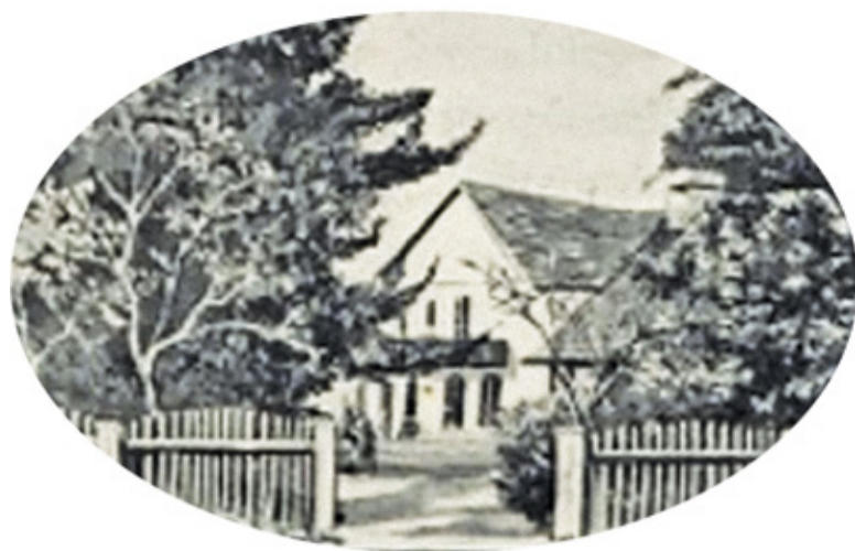
Żelazowa Wola – dworek