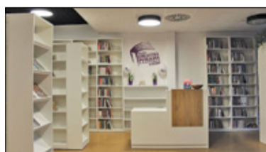
||| Piastów - Nowa biblioteka s. 2

GRODZISK MAZOWIECKI ||| BARANÓW ||| JAKTORÓW ||| PODKOWA LEŚNA ||| MILANÓWEK ||| ŻABIA WOLA P R U S Z K Ó W ||| P I A S T Ó W ||| B R W I N Ó W ||| M I C H A Ł O W I C E ||| N A D A R Z Y N ||| R A S Z Y N