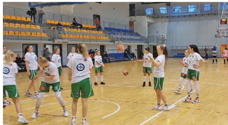
MKS nie pozwolił rozwinąć rywalkom skrzydeł

W drugiej odsłonie obrót spraw uległ całkowitej zmianie. MKS, mówiąc krótko, „zmiotł” rywala z powierzchni ziemi. Bo jak inaczej nazwać wygranę drugiej kwarty różnicą 20 (słownie: