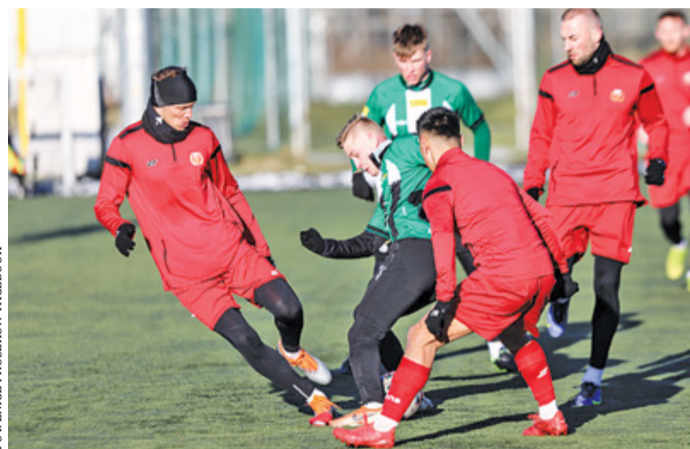
Znicz rozegrał dwa sparingi

Przed żółto-czerwonymi kolejne starcia. 26 stycznia Znicz zagra z Unią Skierniewice, zaś 29 stycznia z Pogonią