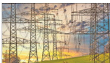
||| Grodzisk Mazowiecki - Jaśniej w centrum s. 5