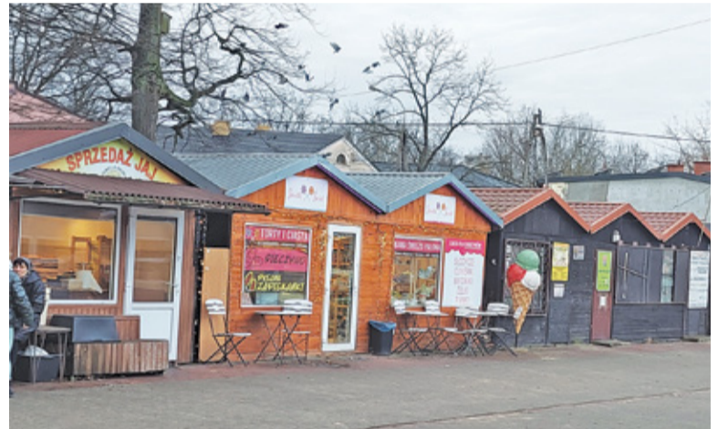
Stowarzyszenie Kupcy Milanowscy reprezentuje interesy tych, którzy użytkują stojące na miejskim targowisku pawilony oraz tych którzy sprzedają swoje towary bezpośrednio z samochodów

miasto jest gotowe. Wyznacza je plan dofinansowania inwestycji w wysokości miliona złotych, które miasto otrzymało. Zgodnie z nim negocjacje nie mo-