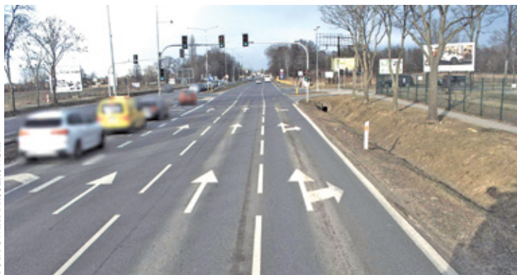
Przez lata Aleja Krakowska w Raszynie słyęła z korków. Sytuacja zmieniła się, gdy wybudowano węzeł drogi ekspresowej S2

S tan dróg jest kluczowy dla kierowców. Zwłaszcza jeśli mówimy o tych, które są najczęściej użytkowane. Nie inaczej jest w omawianym przypadku. Główną arterią Raszyna jest al.