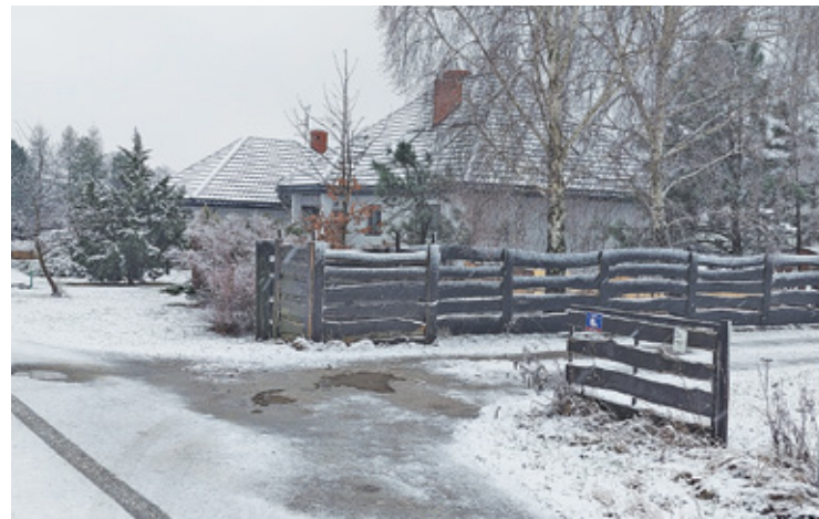
Stare Budy to jedno z wielu malowniczych miejsc w gminie Jaktorów, które mogą zniknąć pod torami kolejowymi CPK