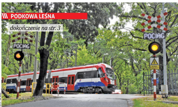
||| PODKOWA LEŚNA dokończenie na str. 3

W 2024 roku będziemy podróżować do Warszawy szybciej bezpieczniej i ekologicznie. Będzie także więcej kursów niż dziś