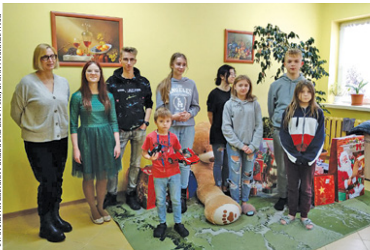
Prezenty sprawiły dzieciom wiele radości

Niezwykle piękna akcja ma miejsce w szkole w Komorowie. Uczniowie z tamtejszego Zespołu Szkół Ogólnokształcących są prawdziwymi bohaterami, ponieważ wspierają podopiecznych domu dziecka w Skarżysku Kamiennej. Swoimi działaniami młodzież wywołała uśmiech na niejednej twarzy. Każda z klas szkoły podstawowej i liceum wylosowała imię jednego z wychowanków domu dziecka. Następnie przygotowano dla niego upominek. Dzieci i młodzież chcieli, aby podopieczni domu dziecka mogli