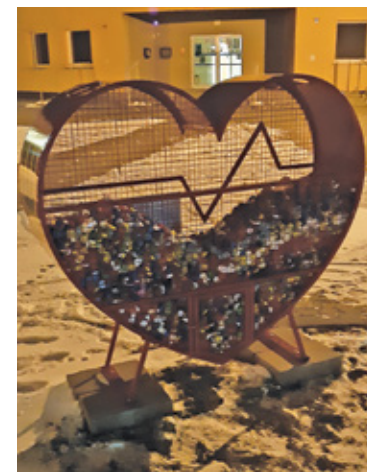
Wrzucamy więc nakrętki do metalowych serc

Chętnie zbieramy nakrętki, a potem wrzucamy je do serc, których przybywa wokół nas. Takie instalacje spotykają się z aprobatą w całej Polsce. W naszym regionie również możemy obserwować w przestrzeni publicznej kolejne serca. W gminie Nadarzyn przybyło kolejne, które zamontowano przy szkole w Ruścu. – Dwa pierwsze serca pojawiły się na Placu Poniatowskiego i