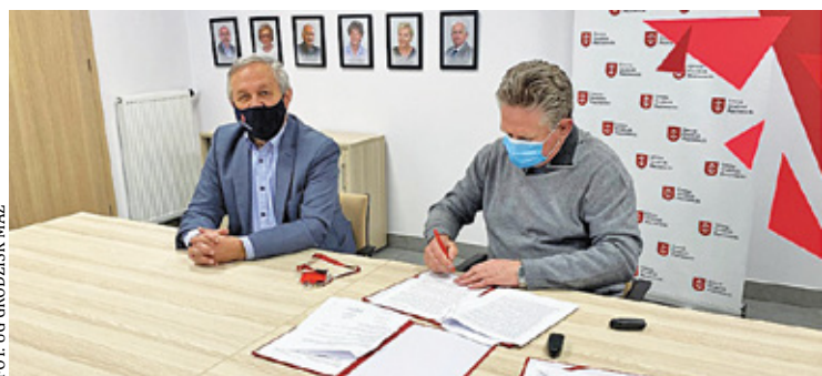
Podpisanie umowy otwiera drogę do wspólnej inwestycji, z której korzyść będą mieli przede wszystkim mieszkańcy

– Była duża społeczna potrzeba powstania tego parkingu – mówi sołtys. – Rodzice którzy przywożą dzieci do szkoły mają co prawda duży parking