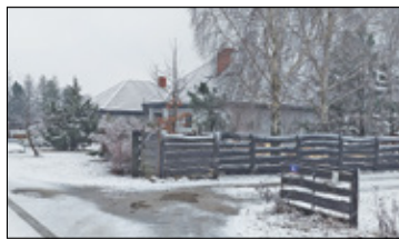
||| Jaktorów - Po proteście przeciw kolei CPK s. 5