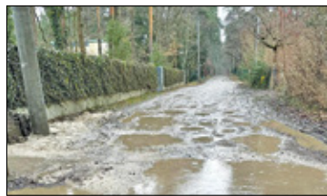
||| Podkowa Leśna - Koniec z kałużami s. 6