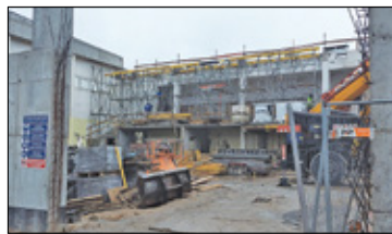
||| Michałowice - Sala z trybunami s. 2

GRODZISK MAZOWIECKI ||| BARANÓW ||| JAKTORÓW ||| PODKOWA LEŚNA ||| MILANÓWEK ||| ŻABIA WOLA P R U S Z K Ó W ||| P I A S T Ó W ||| B R W I N Ó W ||| M I C H A Ł O W I C E ||| N A D A R Z Y N ||| R A S Z Y N