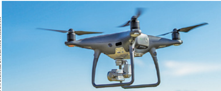
Nadarzyn i Lesznówola będą zgłębiać działanie dronów

Drony stanowią zapewne temat przyszłościowy. Dla Nadarzyn i Lesznówola to szansa na wdrożenie nowych usług. Co samorządom da udział w programie? – Przede wszystkim sprawnej działającej służby lokalne, które dzięki nowym narzędziom będą miały większą zdolność do monitorowania i analizowania np.: zanieczyszczeń powietrza, w konsekwencji do redukcji