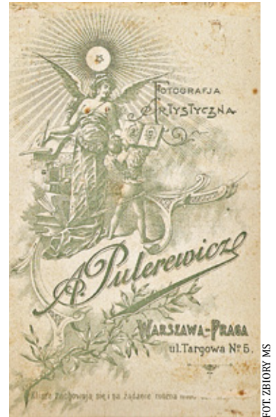
Rewers zdjęcia z pracowni warszawskiej Pulerewicza

gło znaczyć, że tak do końca to nie było jasne, czy w transakcjach z Witowskimi wszyscy wychodzili na plus. Róża miała liczne przykłady na to i tylko żał, że ich nie spisałam.