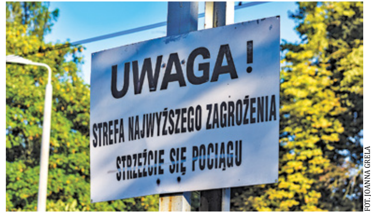
Remont toru z Podkowy Głównej do Podkowy Zachodniej planowany jest na 12 miesięcy

Pod koniec kwietnia rozpocznie się budowa drugiego toru WKD z Podkowy Leśnej do Grodziska. Utrudnienia potrwać dwa lata, ale po zakończeniu prac zwiększy się ilość połączeń do Warszawy, a także zwiększy bezpieczeństwo podróży.