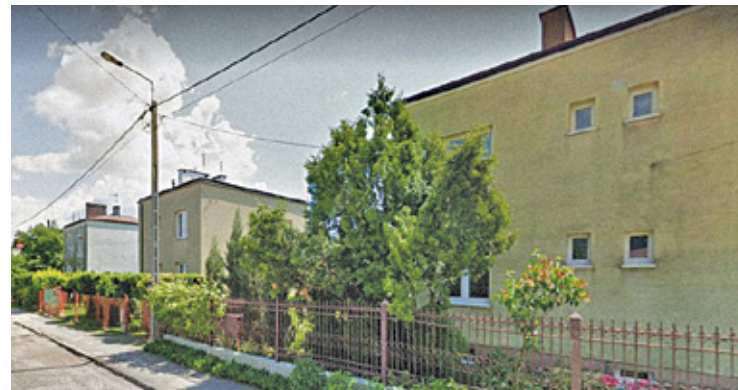
Ulica Brzozowa w Piastowie, osiedle domków kolejarskich