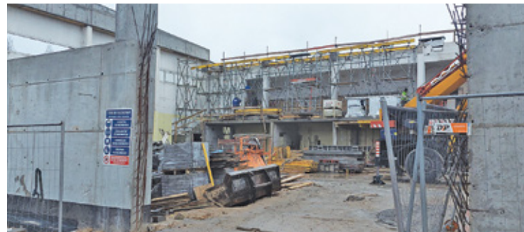
Trybuny są wybetonowane

Przede wszystkim obiekt znacznie się powiększy, a widownie zsiądą na trybunach. Ocieplony budynek, zastosowanie pomp ciepła i innych rozwiązań technologicznych zwiększy komfort użytkownika. Co istotne, sala będzie dostosowana do potrzeb osób z niepełnosprawnościami. Do dyspozycji społeczności szkolnej zostaną oddane