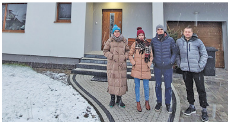
Młode małżeństwo, nauczyciele, którzy wzięli kredyt i zbudowali dom, podobnie jak ich sąsiedzi, nie wiedzą czy za kilka lat ich miejsce na ziemi nadal będzie ich

do Bud Starych, wije się między urokliwymi zagajnikami. Niewiele tu domów, ale większość z nich wygląda na nowo zbudowane. Na kilku wiszą banery z