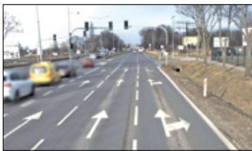
||| Raszyn - Co z Krakowską? s. 2