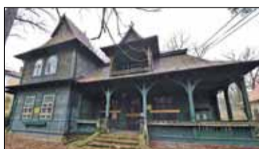
||| Podkowa Leśna - „Jukawa” pod ochroną s. 4