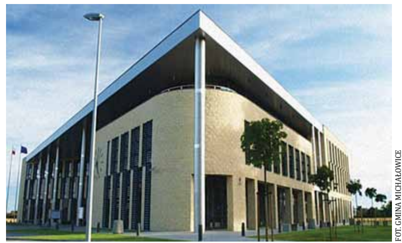
Urząd Gminy Michałowice w Regułach