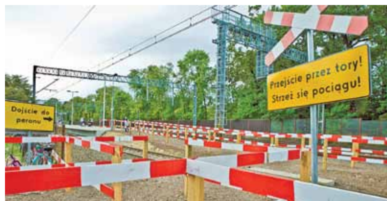
Na razie jest tak, ale będzie lepiej

najbardziej interesujący jest projekt modernizacji wybranych dworców przy linii kolejowej nr 447 na odcinku Brwi-