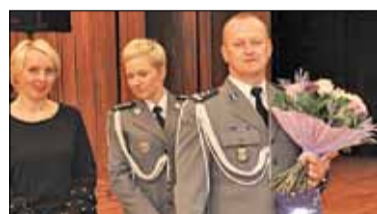
||| Pruszków - Nowy komendant policji s. 2