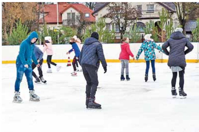
Miłośnicy łyżew mają gdzie pojeździć