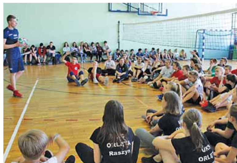
Zawodnicy z uwagą słuchają wskazówek

Obecnie tworzy się grupa naborowa 9-10 lat (treningi wtorek i piątek od 14.30) więc wszystkich chętnych serdecznie zapraszamy!