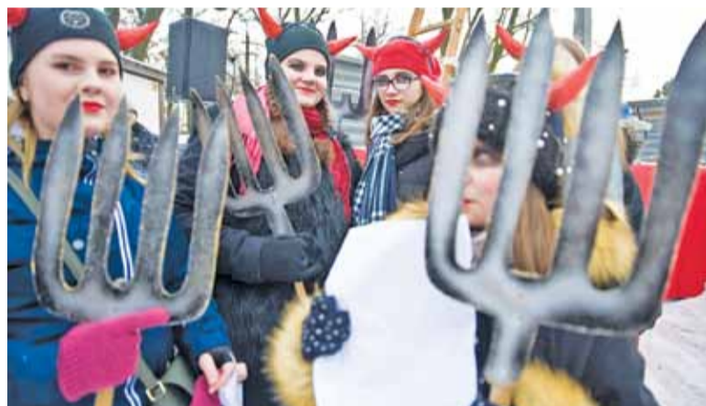
Diabełki z trudem zachowywały powagę

Tutaj Królowie złożyli nowo nar- dzonemu Jezuskowi dary. Anielski