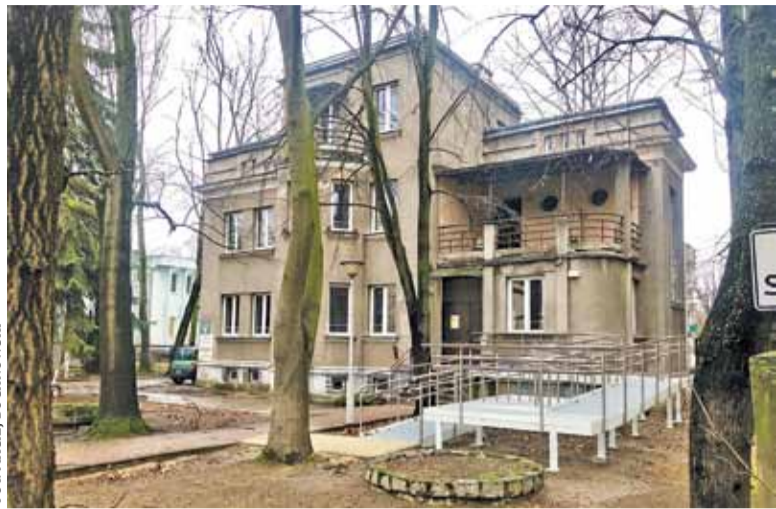
Dom „Senior+” mieści się przy ul. Kraszewskiego 18