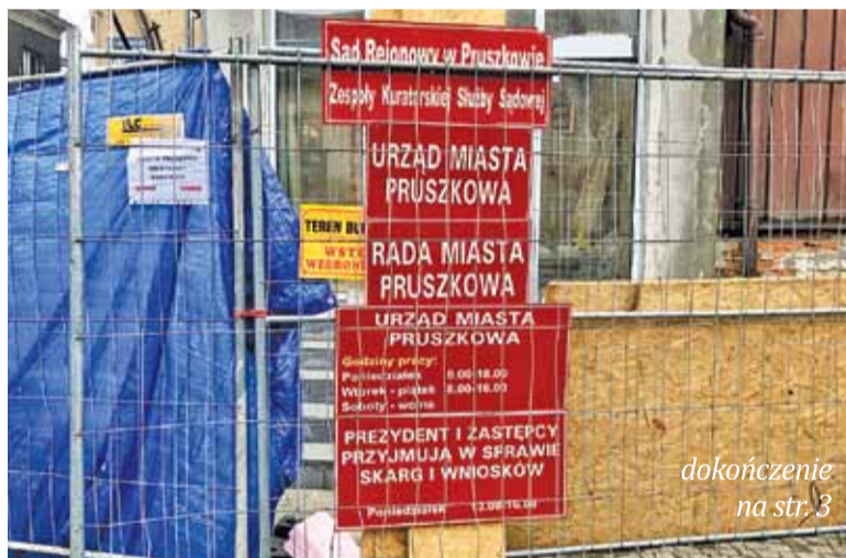
Zmiany czekają budynek Urzędu Miasta