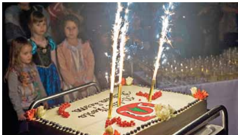
Urodzinowy tort był imponujących rozmiarów