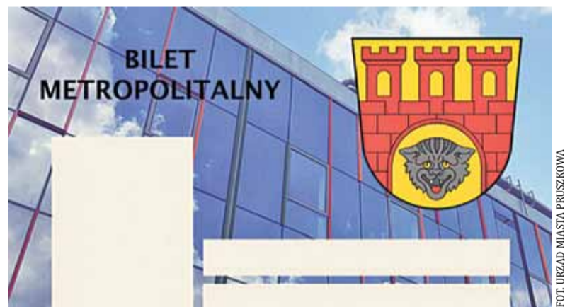
Wzór karty metropolitalnej