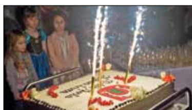
||| Podkowa Leśna - Urodziny miasta-ogrodu s. 3