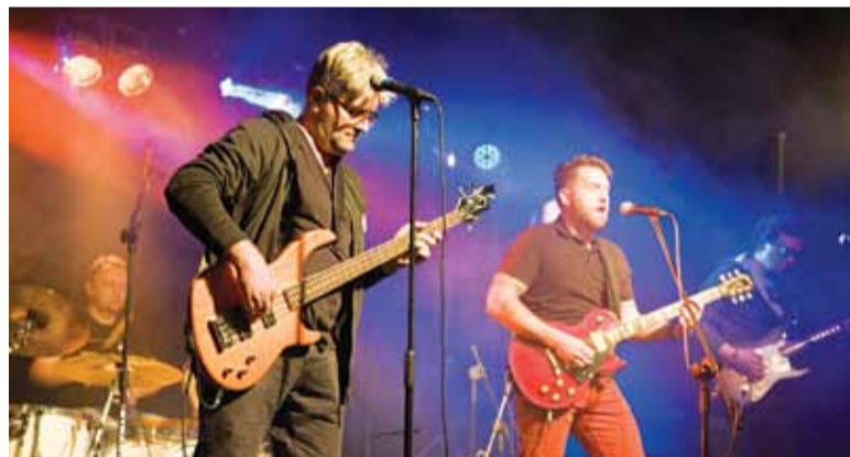
Zespół Stiff Bones wystąpił z coverowym repertuarem

Urodzinowe atrakcje odbywały się w sobotę 5 stycznia w sali widowiskowej Centrum Kultury i Inicjatyw Obywatelskich przy ul. Świerkowej.