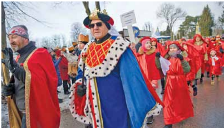
Wreszcie Orszak ruszył