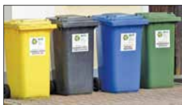
||| Grodzisk Mazowiecki - Nowe zasady segregacji odpadów s. 5