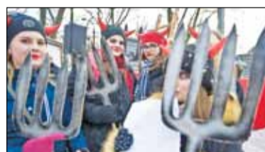
||| Nadarzyn - Trzej Królowie s. 6