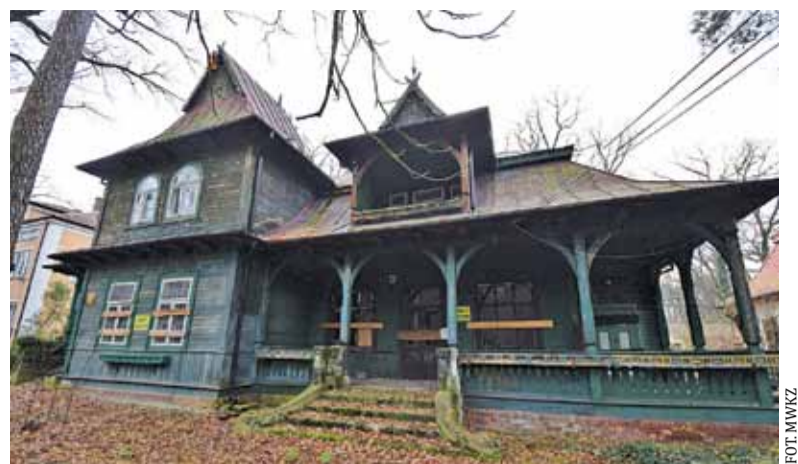
Willa „Jukawa” w końcu znalazła się pod ochroną konserwatora