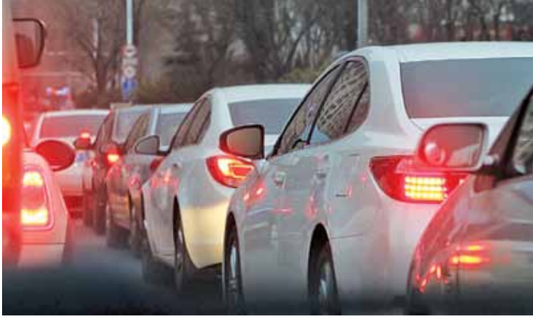
Ruch był duży, ale było bezpiecznie