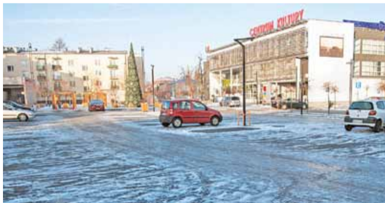
Przy Centrum Kultury są już parkometry i mnóstwo wolnych miejsc

Decyzja ma na celu umożliwienie zaparkowania mieszkańcom, którzy chcieliby pójść na film do kina, zrobić zakupy na deptaku czy też posiedzieć ze znajomymi w kawiarni. Dlatego też