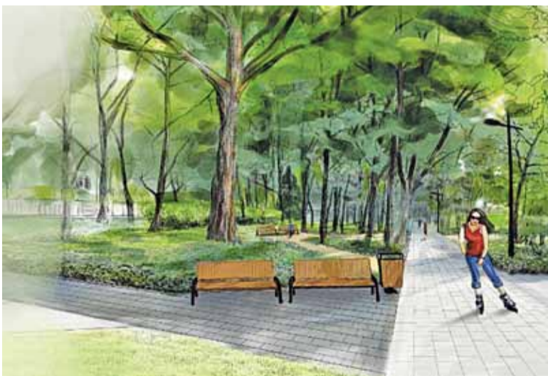
Tak ma prezentować się park