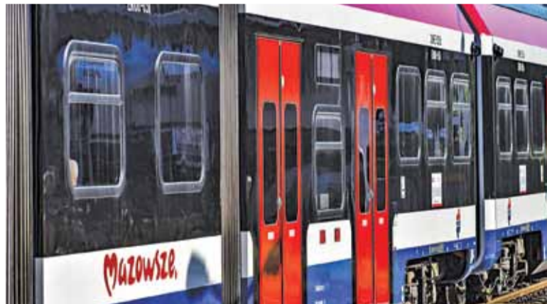
WKD to najpункtualniejszy przewoźnik pasażerski w kraju

Na sukces „wukadki” wyraźnie wpłynął m.in. remont linii kolejowej nr 447 na odcinku Warszawa Włochy – Grodzisk Mazowiecki, która do września była nieczynna. Pasażerowie mieli więc wybór między zastępczą komunikacją autobusową, a pociągami WKD.