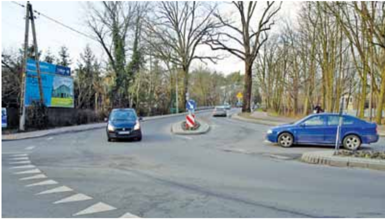
W godzinach szczytowych dzieją się tu sceny dantejskie