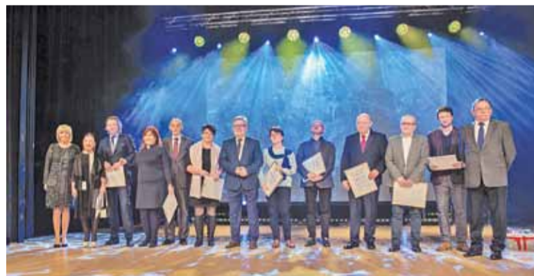
Wszyscy nagrodzeni pozowali do „rodzinnej” fotografii

W programie gali ze swoim programem miał wystąpić Piotr Bałtroczyk, jednak z uwagi na wydarzenia w Gdańsku, program artystyczny został zmie-