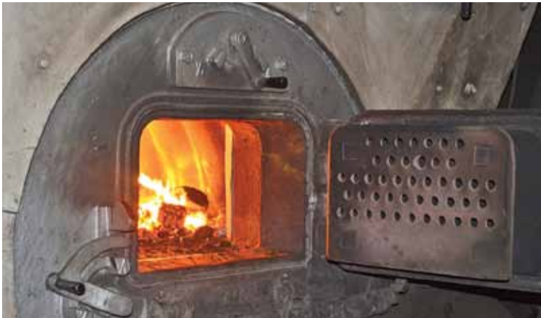
Dotacja przysługuje tylko na zakup nowego kotła