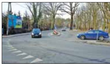
||| Milanówek - Udrażnianie miasta s. 5