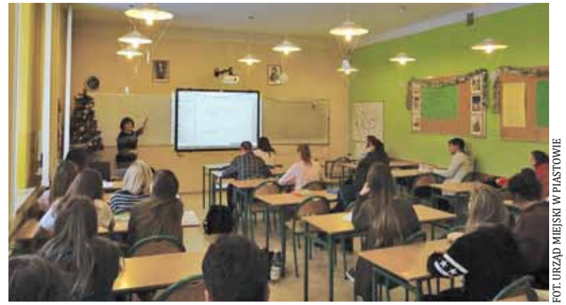
Uczniowie podczas zajęć