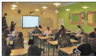
||| Piastów - Szkoły przyszłości s. 5