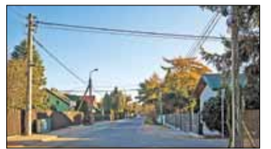
||| Brwinów - Koniec problemów s. 6