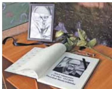
W Podkowie Leśnej wyłożona została księga kondolencyjna

„Żegnamy Pawła Adamowicza, Prezydenta Miasta Gdańska, wspaniałego człowieka, wielkiego samorządowca, naszego Przyjaciela z Unii Metropolii Polskich i Związku Miast Polskich. Apelujemy do władarzy wszystkich samorządów, aby w czasie sobotnich uroczystości pogrzebowych umożliwili swoim mieszkańcom zebranie się na centralnych placach swoich miast i zapalenie zniczy. W obecnej sytuacji jedynie nasze myśli i wsparcie duchowe są w stanie