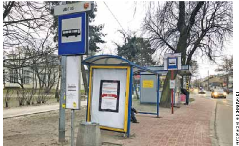
Na autobus czasami trzeba poczekać