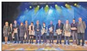
||| Grodzisk Mazowiecki - 15 lat Szpitala Zachodniego s. 4