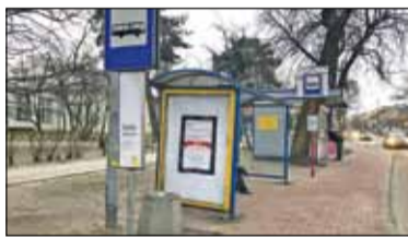
||| Pruszków - Autobusy nie na czas s. 2

P R U S Z K Ó W ||| P I A S T Ó W ||| B R W I N Ó W ||| M I C H A Ł O W I C E ||| N A D A R Z Y N ||| R A S Z Y N