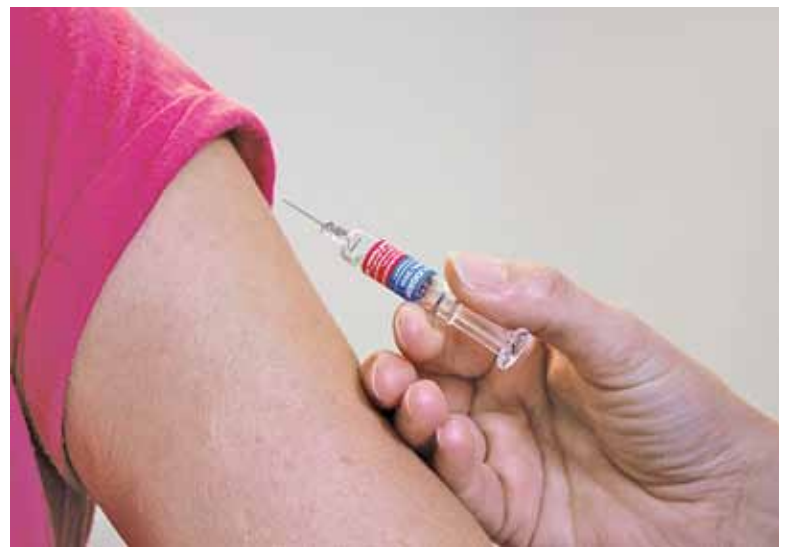
Zaszczepione dzieci zyskują dodatkowe punkty w drugim etapie rekrutacji