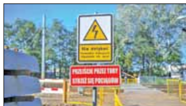
||| Pruszków, Grodzisk Maz. – Kolejne przesunięcie s. 5