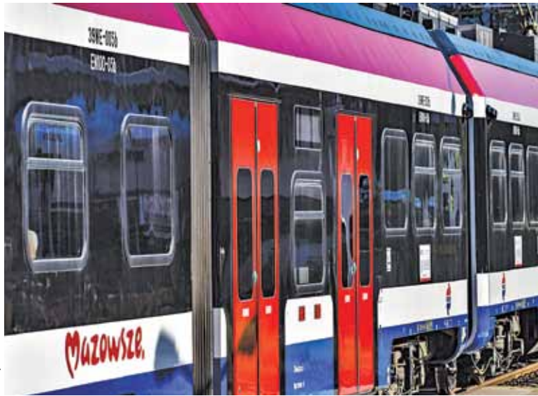
Zniżki obowiązują we wszystkich pociągach WKD

Bilet dla osoby dorosłej i dla dziecka zakupiony w kasie biletowej zostanie zaopatrzonej przez kasjera w adnotację „Przejazd rodzinny” i potwierdzony datownikiem. Jeżeli podróżny zakupił bilet na przejazd w punkcie uprawnionym do sprzedaży biletów WKD lub auto-