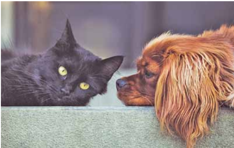
Małe zwierzęta możemy przewozić bezpłatnie