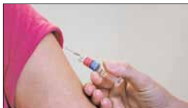
||| Piastów – Punkty za szczepienia s. 4