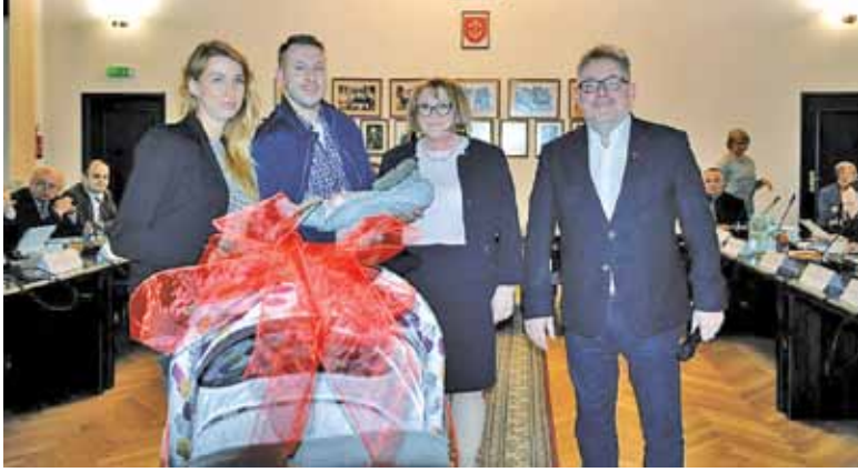
Pola z rodzicami odbierają od władz miasta wózek