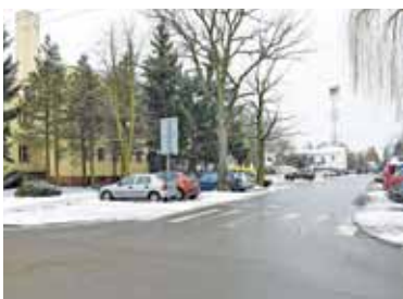
Ulica Kirlańczyków zyska nowe miejsca parkingowe

Na realizację tego zadania gminie udało się pozyskać dofinansowanie ze środków zewnętrznych w wysokości 80% w ramach Regionalnego Programu