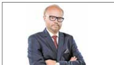
||| Milanówek – Co udało się zrobić? s. 3