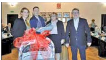
||| Grodzisk Mazowiecki – Czwarta sesja Rady Miejskiej s. 2