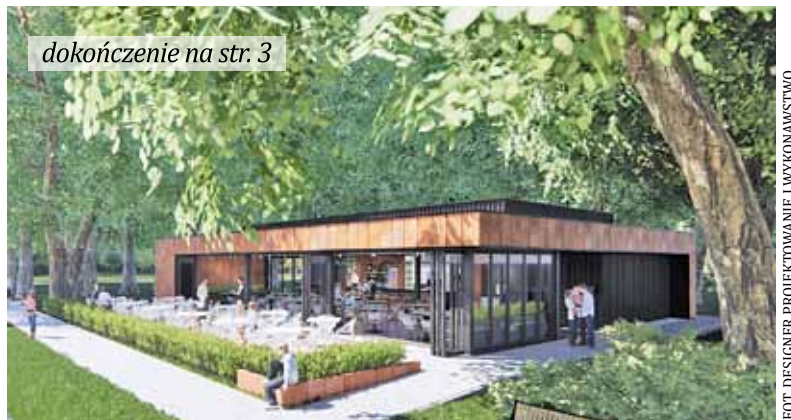
dokończenie na str. 3