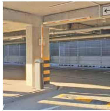
Kierowcy zyskali blisko 400 miejsc postojowych