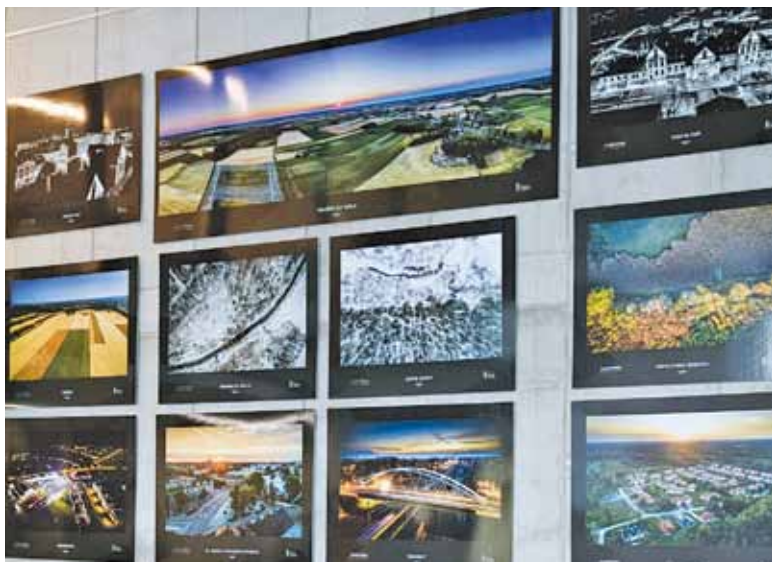
Grodzisk z lotu ptaka wygląda naprawdę przepięknie