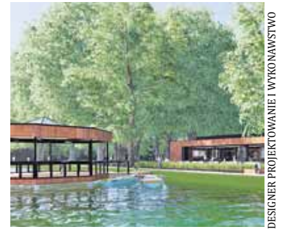
Lokal będzie miał fantastyczne otoczenie

W nowym budynku wykorzystane zostaną ciekawe rozwiązania. – Wprowadziliśmy bruk do środka, w przestrzeni komunikacji, jakby ścieżka z parku przeszła przez budynek. Wspólnie z inwestorem i technologiem ustaliliśmy, że kuchnia będzie półotwarta, by pokazać, jak przygotowuje się potrawy. W centrum będzie bardzo ciekawy piec węglowy i wędzarnia. Oczywiście cor-ten jest tym materiałem, który tworzy ten projekt od strony wizualnej – pomarańczowo-ruda elewacja będzie się zmieniała. Ten materiał przeobraża się pod wpływem warunków atmosferycznych i niejako żyje. Dodatkowym atutem jest to, że kolory pomarańczy i zieleni bardzo dobrze się komponują. Mamy sporo rozwiązań, które mają powodować, że lokal będzie dobrze funkcjonował jako budynek. Restauracja ma duże przeszklenie z możliwością jego złożenia i połączenia się z parkiem latem. Co za tym idzie, to determinowało u nas potrzebę powiązania wnętrza z zewnątrz i zastosowanie cor-tenu