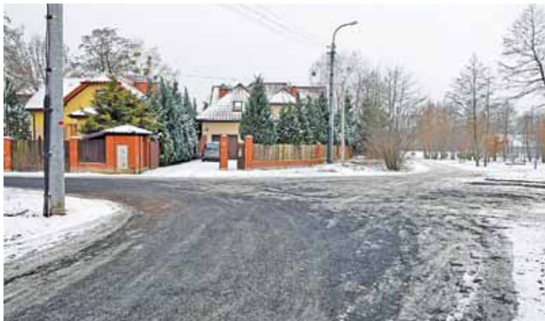
Ulicą Wioślarską dojedziemy wygodnie nad Stawy Walczewskiego