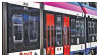
||| Region – Przejazdy rodzinne podczas ferii s. 6