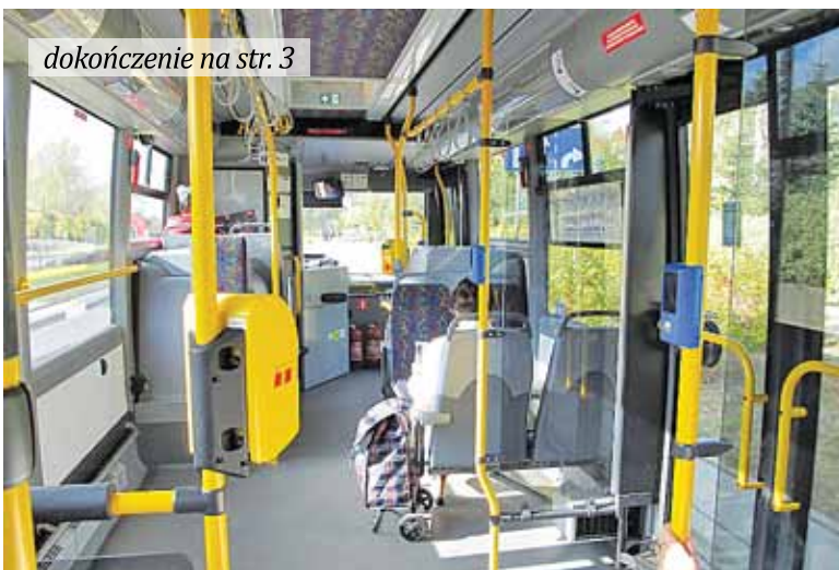
dokończenie na str. 3

W gminie Brwinów funkcjonuje nieźle rozbudowana sieć połączeń autobusowych, zarówno na własnym terenie, jak też łącząca gminę z sąsiadami. Jest to możliwe dzięki dobrej współpracy z samorządami Błonia i Nadarzyn w zakresie partycypacji