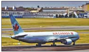
||| Warszawa - Rozbudują lotnisko s. 4