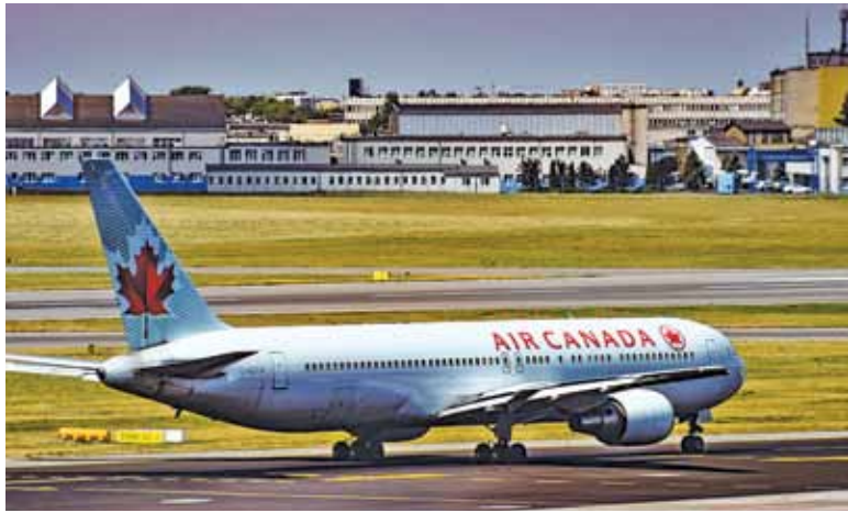
Na głównym lotnisku w Polsce powoli zaczyna brakować miejsca