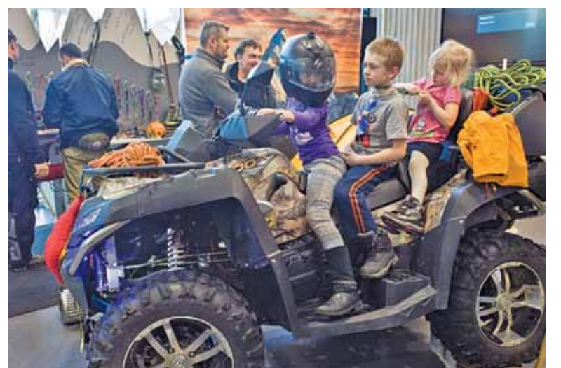
Na takim quadzie można było poczuć się jak Rafał Sonik