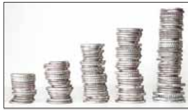
||| Brwinów - Budżet gminy s. 5