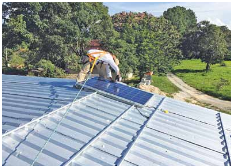
Montaż ogniw fotowoltaicznych

Regularnie słyszymy informacje o złym stanie powietrza i wysokim natężeniu pyłów PM10 i PM2.5. W takich przypadkach zaleca się jak najkrótszy okres przebywania na zewnątrz. Dotyczy to przede wszystkim kobiet w ciąży, osób zmagających się z chorobami układu oddechowego bądź serca i seniorów. Jednakże każdy z nas może wpływać na stan środowiska, korzystając z komunikacji miejskiej zamiast poruszania się samochodem oraz ogrzewając budynki odpowiednimi materiałami. Często jednak niektóre działania wiążą się ze sporymi kosztami. Na szczęście osoby fizyczne mogą uzyskać dofinansowanie z Wojewódz-