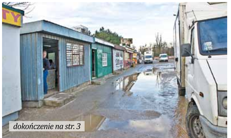
dokończenie na str. 3

Niektóre samorzady, w trosce o zapewnienie możliwości mieszkańcom dotarcia do sąsiednich miejscowości, uruchomiły własną sieć połączeń autobusowych.