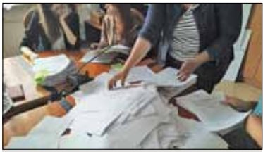
||| Pruszków - Budżet z opóźnieniem s. 2