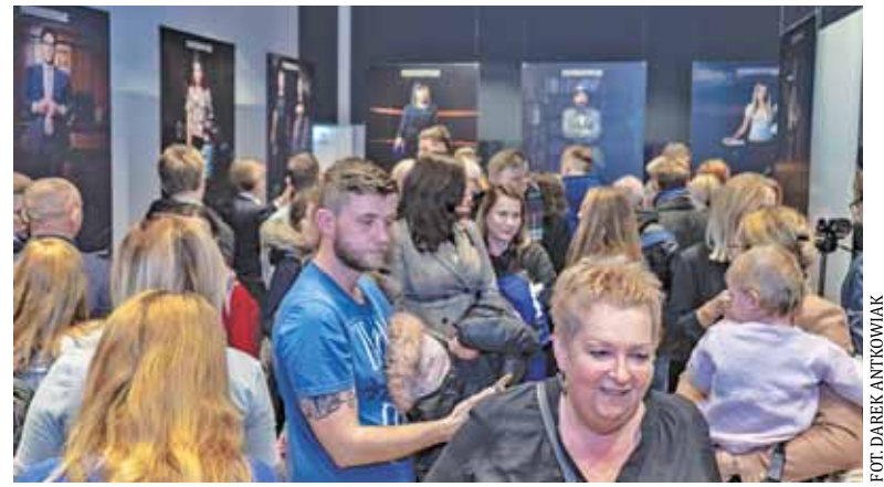
Wystawa wzbudziła zainteresowanie