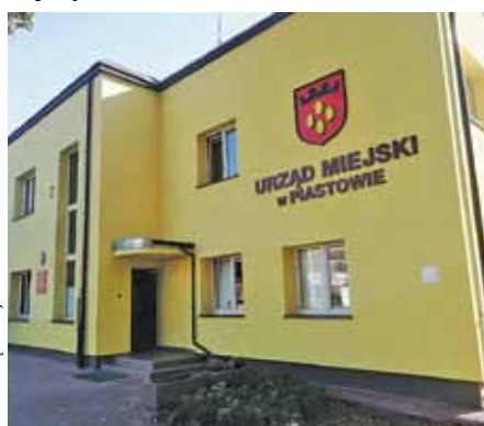
Władze Piastowa podpisały umowę na dofinansowanie PSZOK

Jednym z zadań gminy jest troska o porządek, która wyraża się poprzez zapewnienie czystości na jej terenie. Istotne jest stworzenie odpowiednich warunków, aby je realizować. Punkt Selektywnej Zbiórki Odpadów to nic innego jak miejsce, w którym mieszkańcy mogą zostawić odpady. Warto wspomnieć, że PSZOK musi spełniać dwa warunki. Po pierwsze, punkt powinien być łatwo dostępny dla mieszkańców. Po drugie, należy zapewnić przyjmowanie takich odpadów jak m.in. przeterminowane leki i chemikalia, zużyte baterie, sprzęt elektryczny i elektroniczny, meble czy też odpady budowlane i rozbiórkowe.