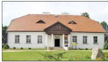
||| Żabia Wola - Wyremontują Dom Kultury s. 3