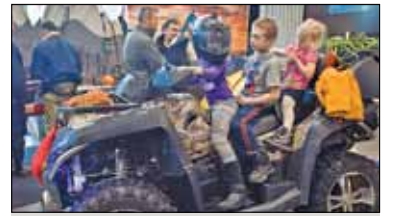
||| Grodzisk Mazowiecki - Sportowa sobota s. 6