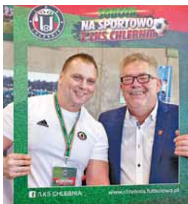
Burmistrz Grodziska pokazał, że ma prawdziwe poczucie humoru

Ogromnym zainteresowaniem cieszyła się również bramka Turbo Kozak,