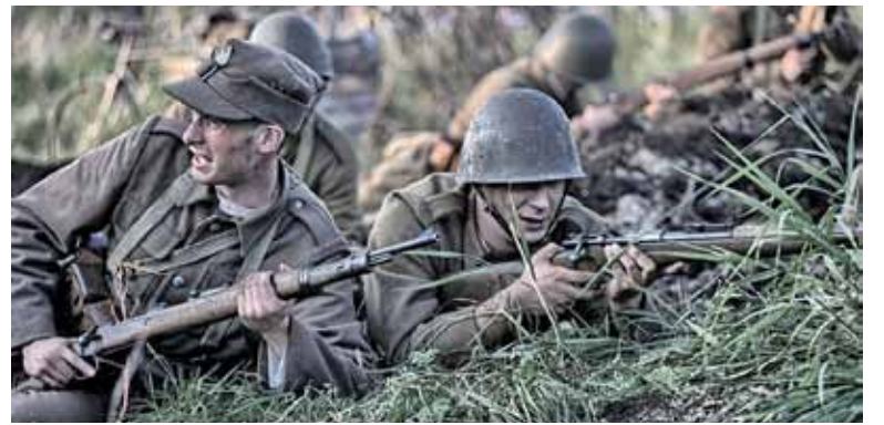
Służba wojskowa nie jest już obowiązkowa