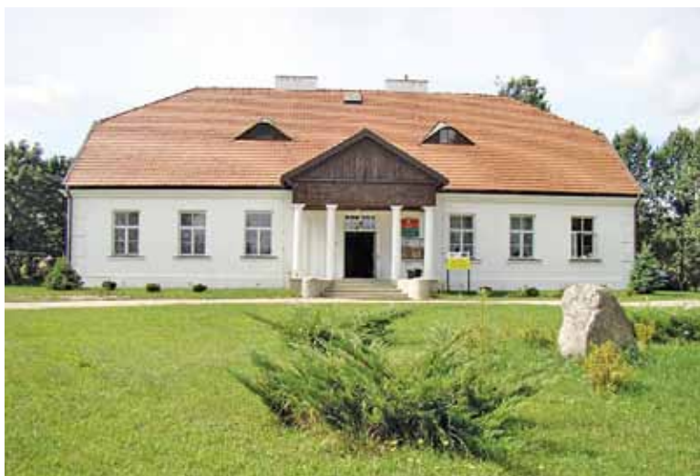
Dworek w Żabiej Woli zostanie wyremontowany