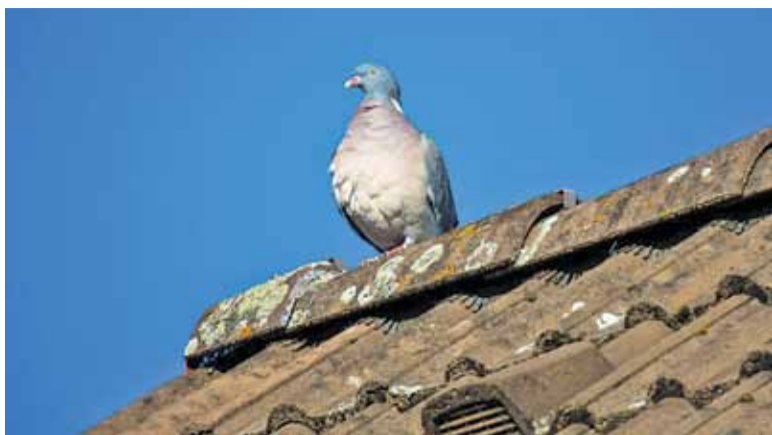
Azbest jest szkodliwy dla zdrowia