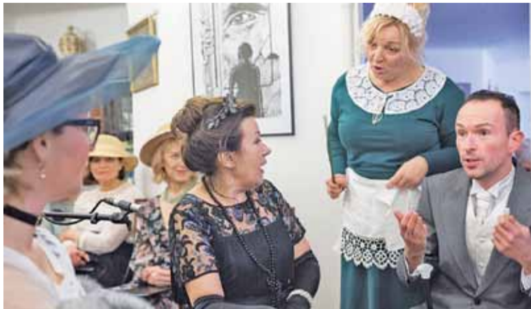
Improwizowany spektakl był kabaretowym majstersztykiem