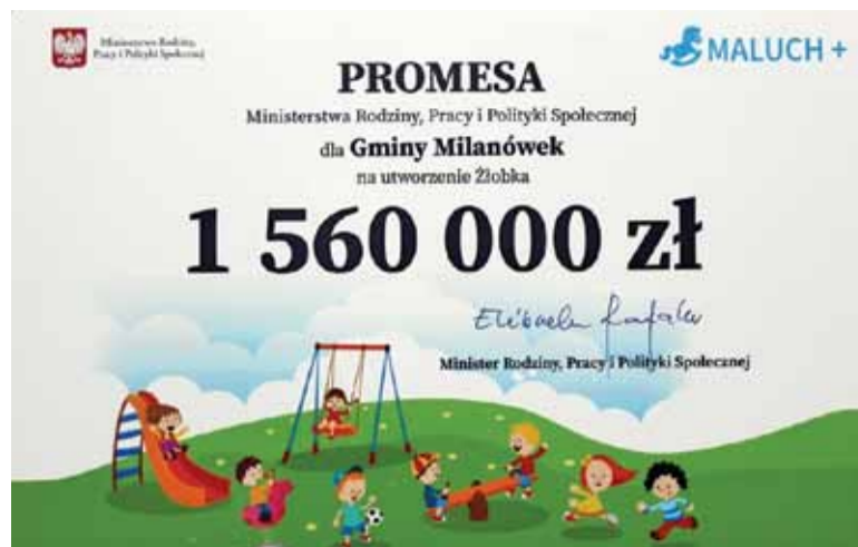
Gmina Milanówek otrzymała promesę na dofinansowanie utworzenia żłobka