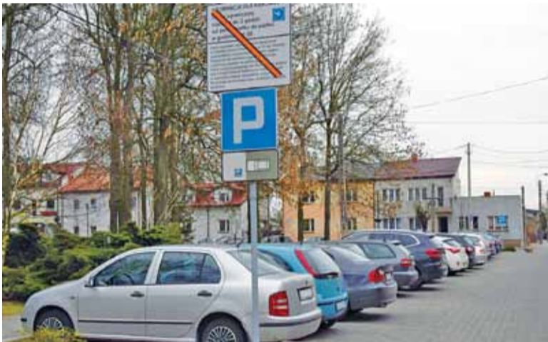
Wokół rynku ustawiono już tablice informujące o nowych zasadach parkowania