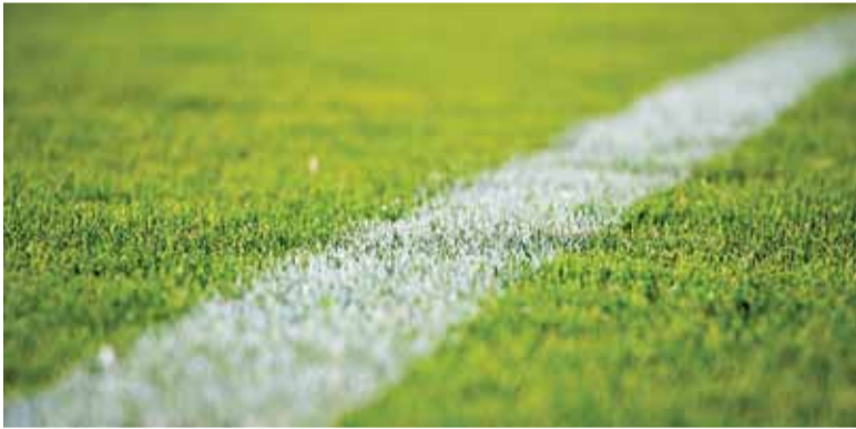
Znicz grał do końca i to dało efekt