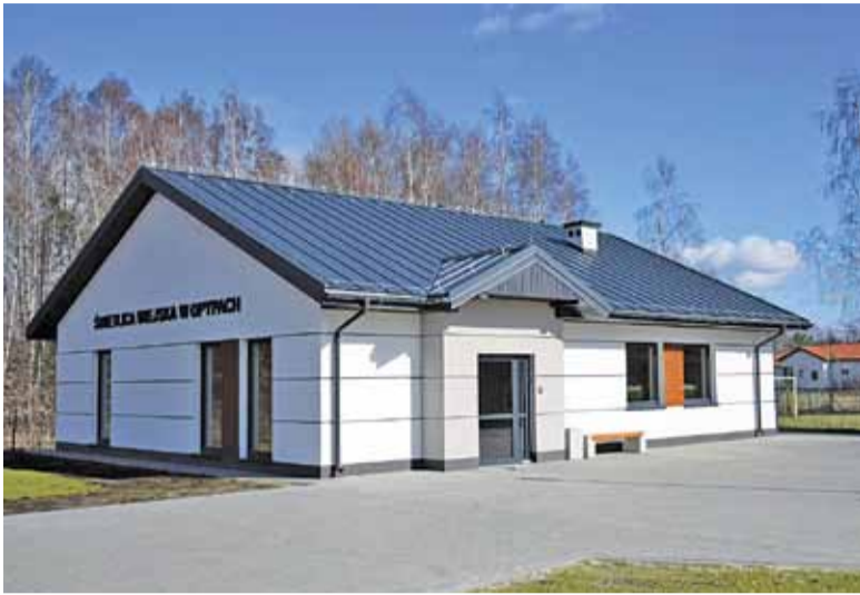
Nowy obiekt utrzymuje styl grodziskich świetlic gminnych