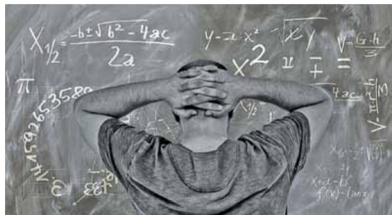
Jak rozwiązać to zadanie?