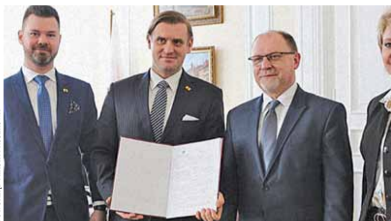
Podpisanie umowy z wojewodą Zdzisławem Siperą