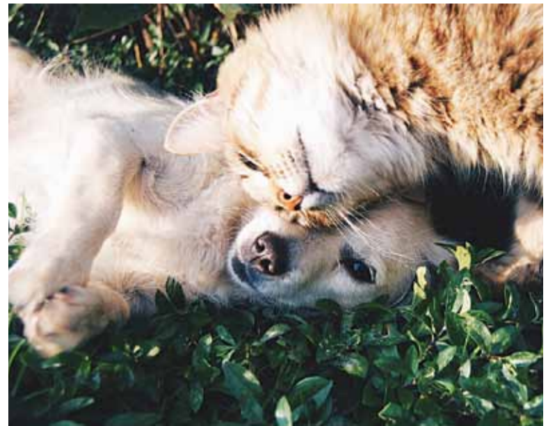
Miasto zapewnia opiekę bezdomnym zwierzętom