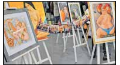
||| Grodzisk Mazowiecki - Miasto Kobiet s. 6