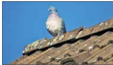
||| Raszyn - Dołożą do usuwania azbestu s. 5