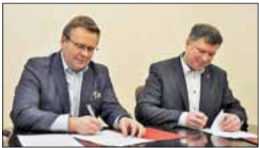
||| Brwinów - Będzie nowa ścieżka s. 2