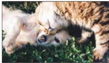
||| Pruszków - Miasto pomaga s. 3