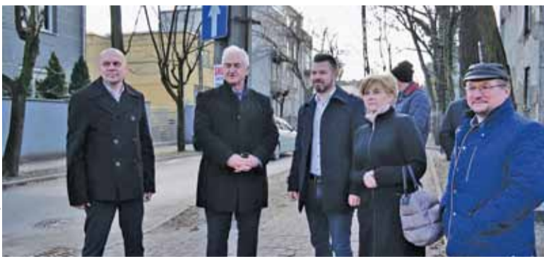
Nie obyło się bez wizji w terenie