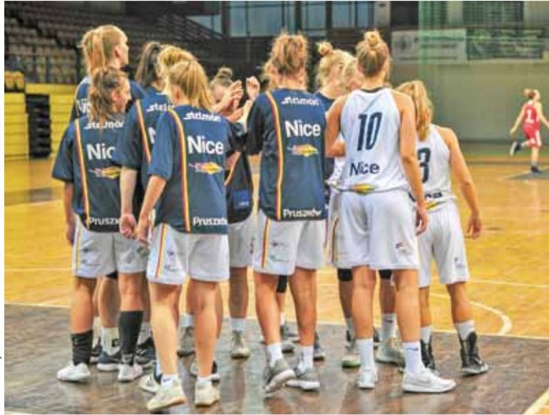
Pierwsza kwarta aż 31:11 dla Lidererek

Druga kwarta była zdecydowanie spokojniejsza. Obie strony popełniały błędy na parkiecie. Na półmetku Liderki prowadziły 42:20. W trzeciej odsłonie Polonia przystąpiła do ataku, czego efektem było zmniejszenie strat do 40:58. Do końca Liderki kontrolowały przebieg gry i utrzymywały bez-