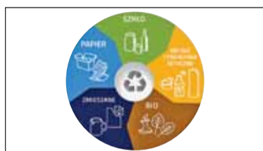
||| Region - Jak segregować śmieci? s. 6