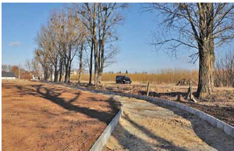
Tę ścieżką pojedą niedługo rowerzyści

Prace te wpisują się w realizację dużego projektu o nazwie „Rozwój systemu dróg rowerowych w gminie Brwinów”. Celem projektu jest budowa sieci ścieżek rowerowych nie tylko na terenie gminy Brwinów, ale będącej również elementem dużego systemu sieci połączonych ze sobą tras rowerowych, który umożliwi podróżowanie nimi również po terenie sąsiednich gmin.