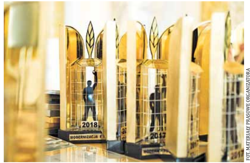
O taką statuetkę powalczą samorządowi inwestorzy