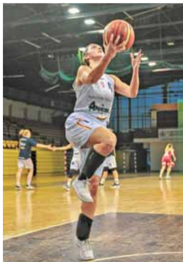
Lider okazał się ponownie lepszy od Polonii