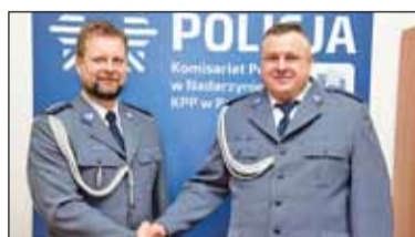
||| Nadarzyn - Nowi szefowie policji s. 2