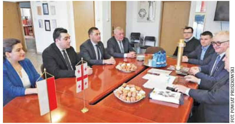
Goście z Gruzji spędzili cztery dni na zwiedzaniu i wymianie wiedzy