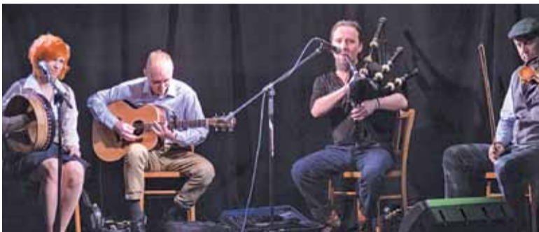
Muzycy i tancerze pozwolili nam poczuć smak Irlandii