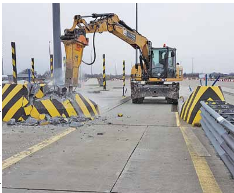
Demontaż wysp segregacyjnych rozpoczęty