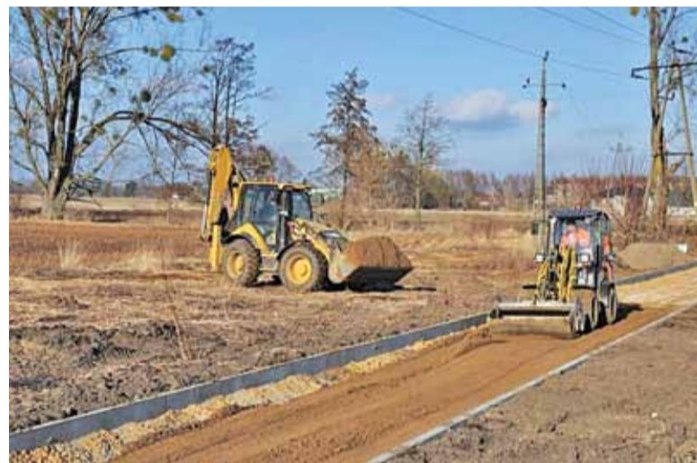
Budowana ścieżka będzie elementem większego systemu

W efekcie realizacji drugiego zadania wybudowany zostanie ciąg pieszo-rowerowy w Owczarni wzdłuż ulicy Kazimierzowskiej, od granicy z Podkową Leśną do ulicy Żółwińskiej. Powstanie tu ścieżka rowerowa i ciąg pieszo-rowerowy w technologii betonu