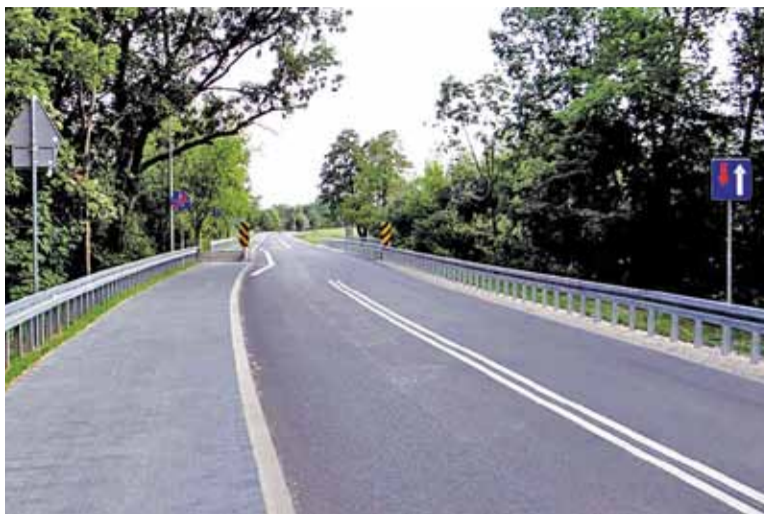
Takie rozwiązanie jak to na moście nad Utratą to i gra z śmiercią

pieszych z azylem na zlikwidowanym pasie.