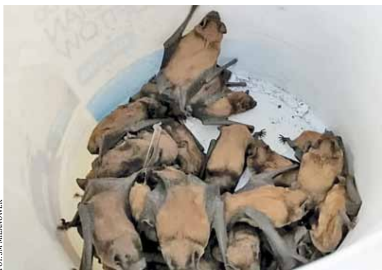
Przez całe lato tępią komary, teraz wylądowały w brudnym wiadrze