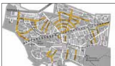
||| Podkowa Leśna - Budowa w formule PPP s. 5