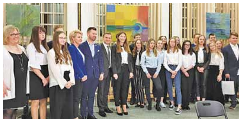
14 marca odbyła się I sesja MRM

Kilka tygodni temu na łamach naszej gazety opisywaliśmy przetarg na projekt budowy drugiego toru WKD na odcinku Grodzisk Maz. – Podkowa Leśna. Etap składania ofert dobiegł już końca; do przetargu przystąpiło osiem firm. Siedem z nich złożyło oferty mieszczące się w założonej przez spółkę kwocie 4,8 mln zł. To daje nadzieję, że procedury szybko zostaną dopełnione i roboty ruszą zgodnie z planem. Umowa z wybranym kontrahentem ma zostać podpisana w czerwcu br. Następnie wykonawca przygotowuje projekt i uzyskuje pozwolenie na budowę – będzie miał na to czas do końca sierpnia 2020 r. Miesiąc później ma ruszyć przetarg na budowę. Władze spółki zakładają, że drugi tor będzie gotowy za 4 lata, w marcu 2023 r.