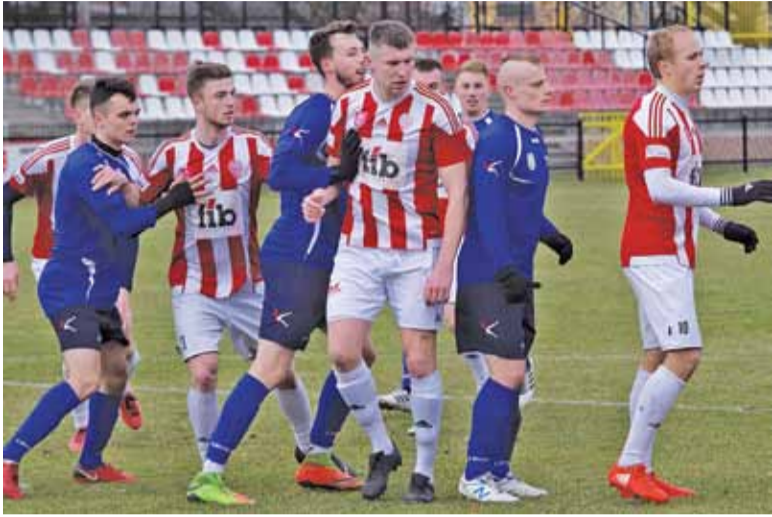
Przygotowania Pogoń zakończyła zwycięstwem 5:0 z KS Łomianki