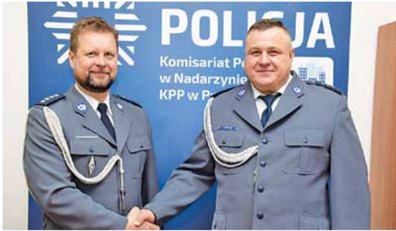
Nowi szefowie nadarzyńskiego Komisariatu Policji