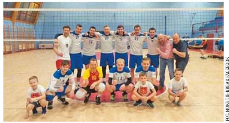
Siatkarze z Piastowa wygrali osiem meczów