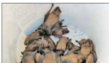
||| Milanówek - Niechciani lokatorzy s. 4