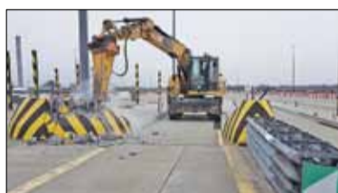
||| Pruszków - Likwidacja bramek s. 3