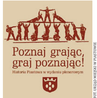
Na najlepszy zespół czeka nagroda

Można połączyć przyjemne z pożytecznym, a więc dobrze bawić się i uczyć. To także znakomita okazja do integracji lokalnego środowiska. Gra rozpocznie się 3 maja o godz. 11.30 przed Szkołą Podstawową nr 2 im. M. Skłodowskiej-Curie w Piastowie przy Al. Krakowskiej 20. Każdy otrzyma kartę drużyny i ma-