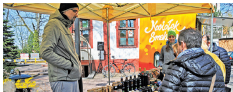
Na kiermaszu w Milanówku można było zrobić świąteczne zakupy