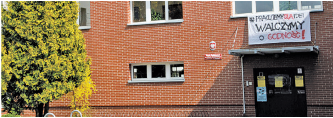
Nauczyciele walczą o godność