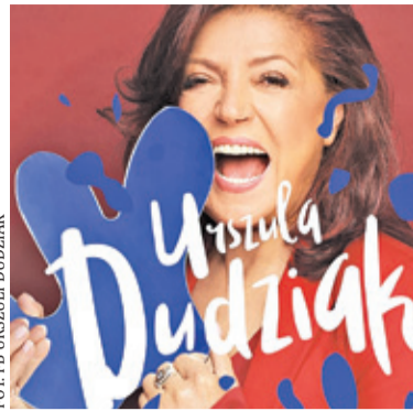
Urszula Dudziak wystąpi z zespołem Walk Away

Zespół wystąpił we wszystkich uznanych klubach i salach koncertowych od gór Ural po Morze Śródziemne. Uczestniczyli w najważniejszych światowych festiwalach. Ważnym mo-