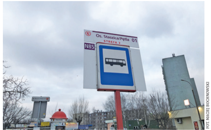
Autobus mógłby pojawić się po wakacjach