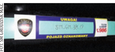
Tak wygląda oznakowanie roweru

Niestety znakowanie ma również i swoje mankamenty. Po pierwsze, jeżeli ktoś jest esteta, to nie będzie zadowolony, gdyż oznakowanie delikatnie mówiąc nie wygląda najlepiej. W przypadku rowerów z ramą stalową grawerka może zapoczątkować proces korozji w tym miejscu. Również niektórzy producenci mają swoje zastrzeżenia twierdząc, że jest to naruszenie struktury