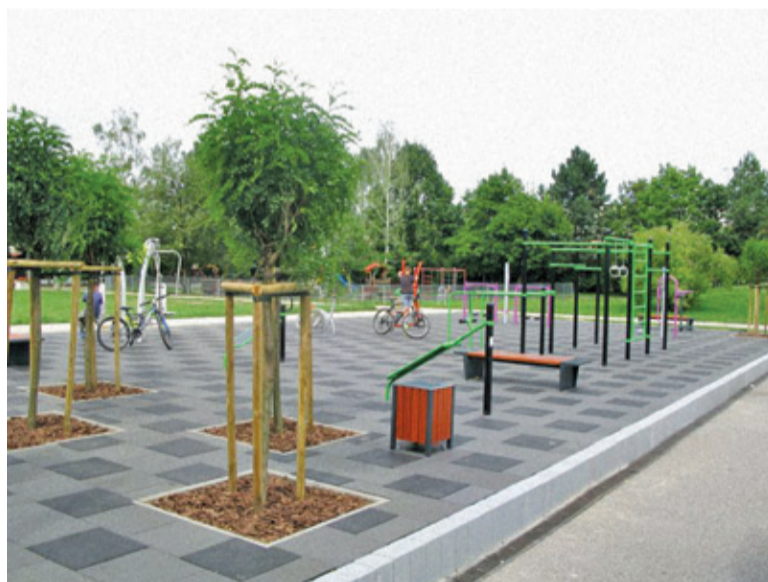
Siłownia przy ul. Tadeusza