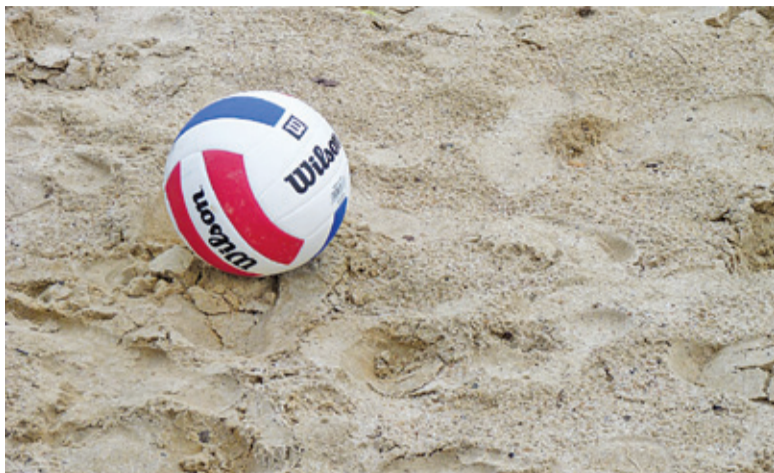
Turniej odbędzie się 2 maja