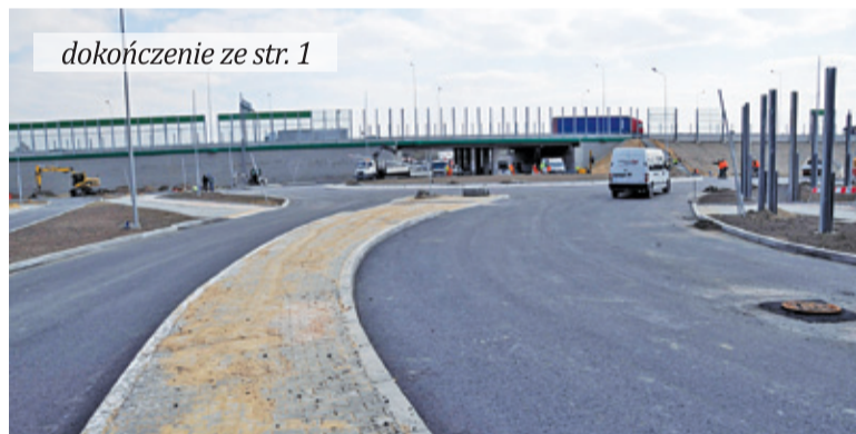
Kolejne odcinki mają położoną już warstwę ścieralną

Prace postępują w szybkim tempie i jeżeli nic go nie zakłóci, to jeszcze przed świętami wielkanocnymi mieszkańcy dostaną znakomity prezent – udostępniony węzeł. Jeśli pojawią się trudności, termin otwarcia przesunie się do majówki. Oczywiście to nie koniec prac na węzle, ale najważniejsza jest jego przejezdność. Oprócz połączenia ulic Kościelnej i Rolnej, udostępnione zostaną również wjazd i zjazd z trasy S8.