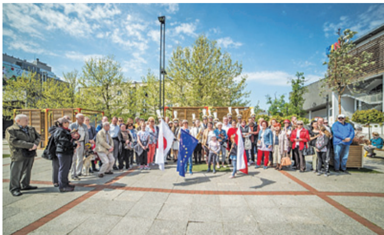
Wielu mieszkańców Grodziska wzięło udział w uroczystości