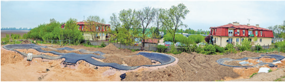
Na terenie budowy widać już wyraźnie oba tory