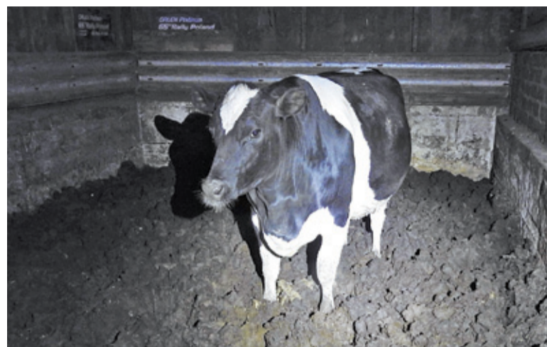
Według pracowników państwowego instytutu krowy stoją w gnoju, bo nie ma sprzętu, aby go wybrać

W czasie interwencji mieszkańcy zaczęli przekazywać nam informacje o zakopywaniu martwych zwierząt na terenie instytutu. Na miejscu pracowała z nami policja wraz z technikiem krymi-