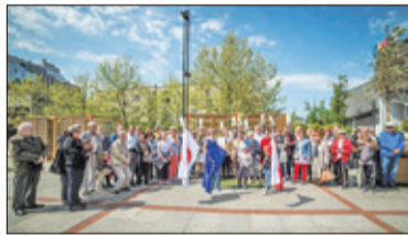
||| Grodzisk Mazowiecki – 15 lat Grodziska w UE