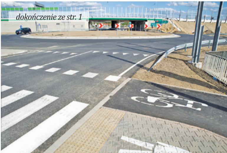
Węzeł prezentuje się naprawdę okazale

Będą jeszcze montowane ekrany akustyczne, co będzie powodowało pewne zakłócenia w ruchu, oraz nieco mniej uciążliwe prace wykończeniowe. Zmieniła się też organizacja ruchu na ulicy Poświętnej, która jest teraz ulicą jednokierunkową, stanowiąc niejako przedłużenie ulicy Henryka Sienkiewicza prowadząc od rynku do ulicy Krótkiej.