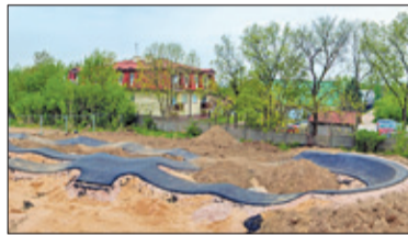
||| Brwinów – Pumptracki nabierają kształtów