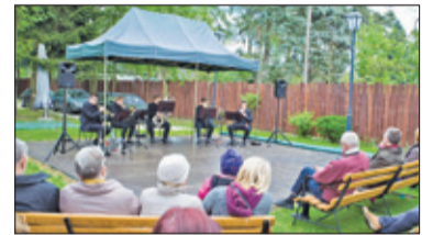
||| Brwinów – Wyjątkowa majówka