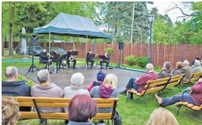
W dworcu Zagroda z koncertem muzyki filmowej wystąpił kwintet instrumentów dętych

Organizatorem rajdu jest Stowarzyszenie Projekt Brwinów, zaś do współpracy włączyły się jednostki OSP