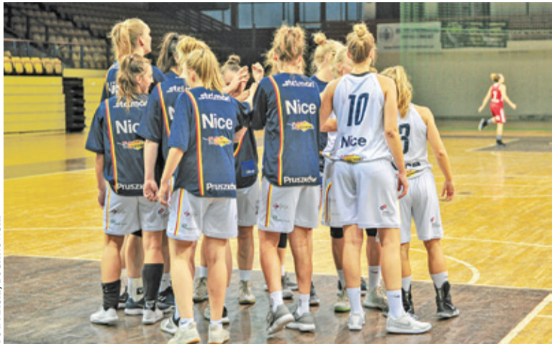
Liderkom nie udało się pokonać tylko jednej przeszkody