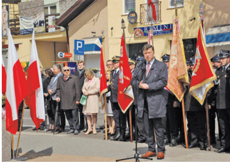
Delegacje złożyły kwiaty pod Pomnikiem Niepodległości