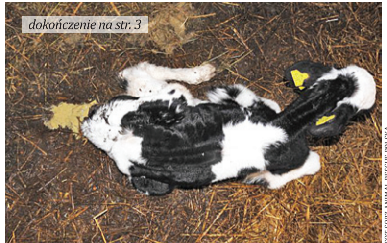
dokończenie na str. 3

Dwa z sześciu żywych cielaków zostało wyniesionych na rękach. Nie miały siły iść. Jeden martwy, drugi po samoamputacji, trzeci bez ogona. Tak państwowy instytut prowadzi hodowlę zwierząt.