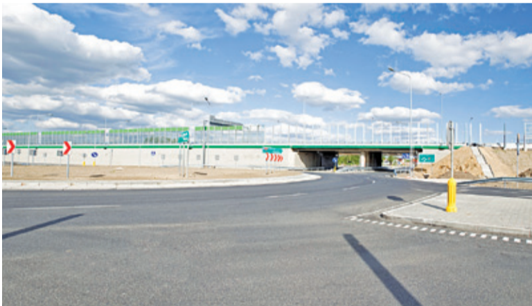
Na otwarciu tego węzła kierowcy czekali od dawna