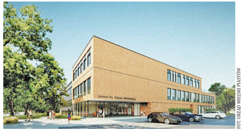
Liceum zmieni się w nowoczesny obiekt