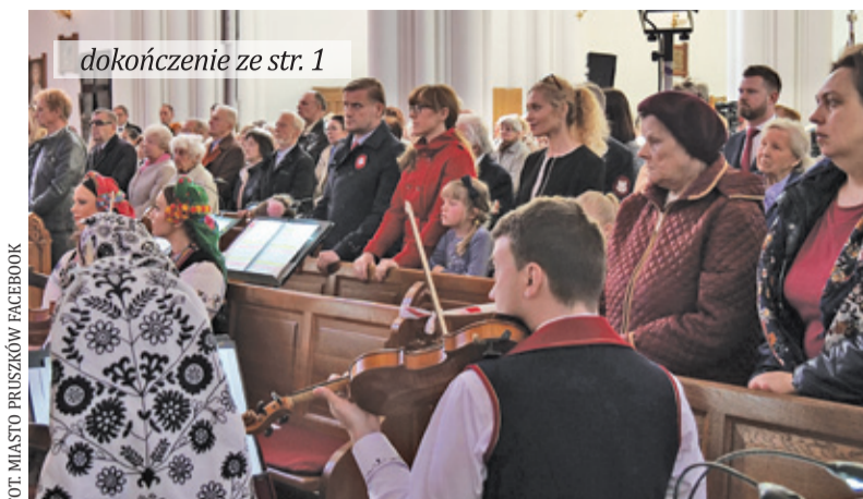
dokończenie ze str. 1