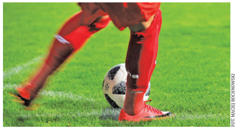
Znicz odniósł 13 zwycięstwo w sezonie