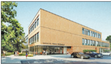
||| Piastów – Umowa podpisana

P R U S Z K Ó W ||| P I A S T Ó W ||| B R W I N Ó W ||| M I C H A Ł O W I C E ||| N A D A R Z Y N ||| R A S Z Y N