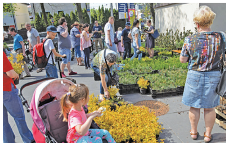
Zainteresowanie akcją było ogromne