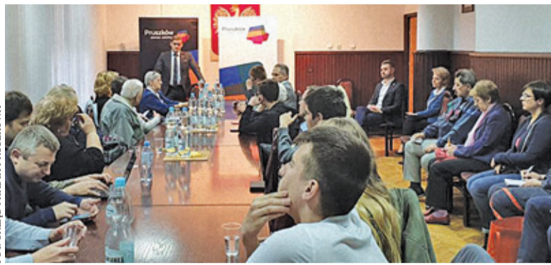
Tematem pierwszego spotkania był transport