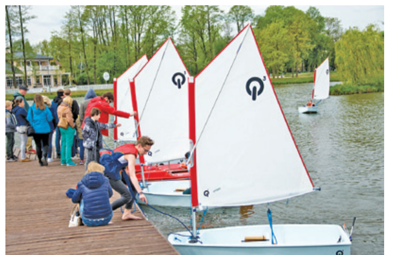
Stawy Walczewskiego zabieliły się żaglami Optymistów i Zefirów

Na miejscu można było porozmawiać o organizowanych przez Szkołę Żeglarstwa Tradycyjnego szkoleniach, rejsach i obozach. Zainteresowanych spędzaniem wolnego czasu pod żaglami odsyłamy do strony SŻT – www.sz.t.