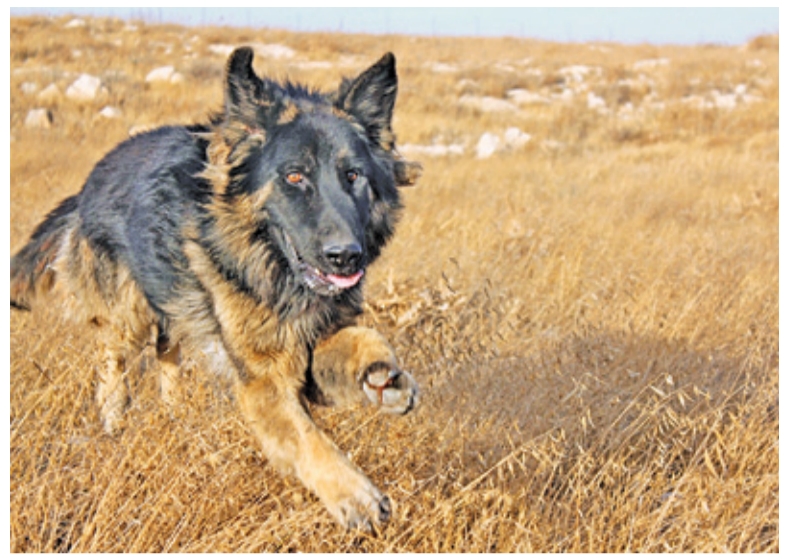
Zagubiony pies szybciej wróci do właściciela, jeżeli ma wszczepiony chip