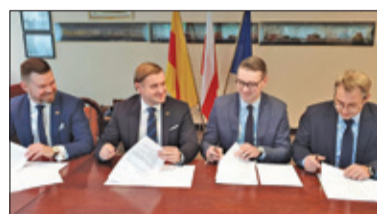
||| Pruszków - Działkowa z umową s. 2

GRODZISK MAZOWIECKI ||| BARANÓW ||| JAKTORÓW ||| PODKOWA LEŚNA ||| MILANÓWEK ||| ŻABIA WOLA P R U S Z K Ó W ||| P I A S T Ó W ||| B R W I N Ó W ||| M I C H A Ł O W I C E ||| N A D A R Z Y N ||| R A S Z Y N