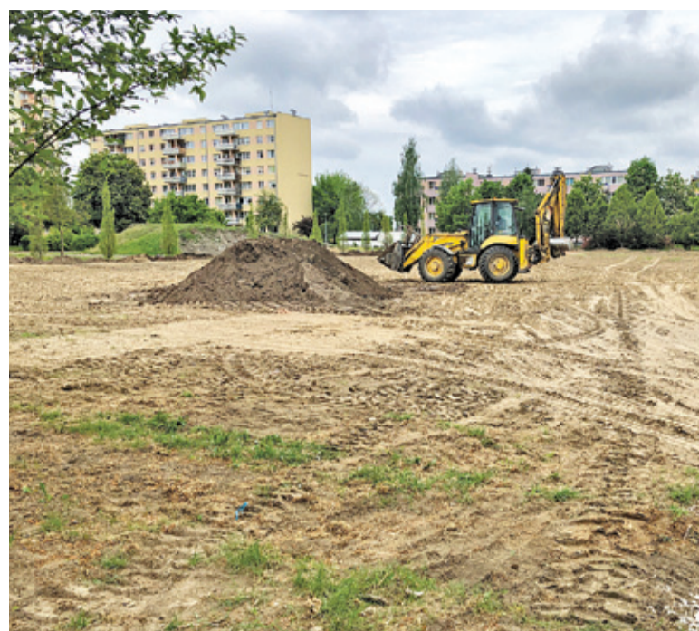
W parku znajdzie się również miejsce na rekreację