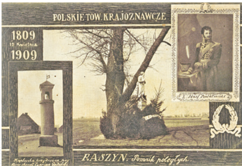
Pocztówka wydana w setną rocznicę bitwy pod Raszynem

tego dnia, w ciągu kilku godzin. Straty po stronie polskiej wynosiły 450 poległych żołnierzy i 900 rannych, po stronie austriackiej 2500 zabitych i ciężko