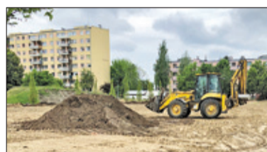
||| Piastów - Boisko w parku s. 4