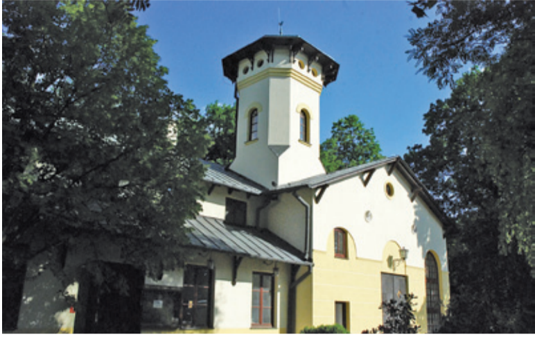
Muzeum Starożytnego Hutnictwa Mazowieckiego