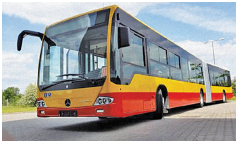
30 kwietnia zmieniono kursowanie autobusów

Jak poinformował Zarząd Transportu Miejskiego, w związku ze zmianą organizacji ruchu, związaną z otwarciem węzła Nadarzyn, od 30 kwietnia wprowadzone zostały zmiany w kursowaniu linii 703, 711 oraz 733.