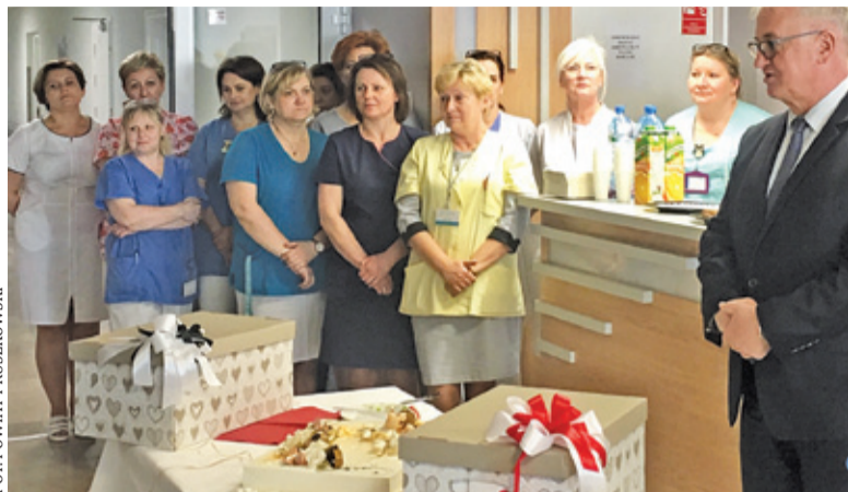
Tort prezentował się przepięknie