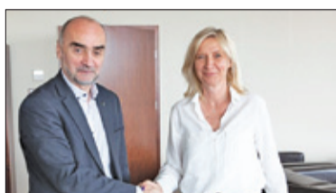
||| Michałowice - Poprawa jakości powietrza s. 5