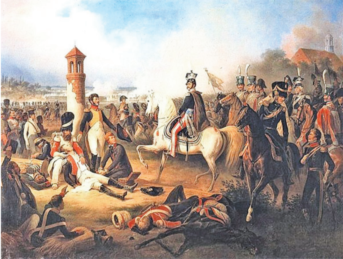
Januariusz Suchodolski (1797-1875) obraz „Śmierć pułkownika Godebskiego”

W tym roku przypada 210. rocznica bitwy pod Raszynem i zapewne czekają nas uroczystości przypominające wydarzenia 1809 r. Bitwy czasów napoleońskich są dość szczegółowo opisane w księgach i dokumentach historycznych. Powstało wiele obrazów, wierszy i pieśni sławiących bohaterów tamtych czasów. Na przykład wiersz „Rok 1809” Marii Konopnickiej, którego pierwsze wersy recytowali dorośli, niedyscyplinowani uczniowie przedwojennych szkół: