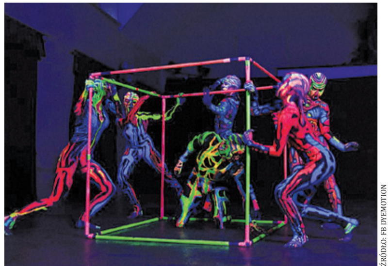
W Centrum Kultury zobaczymy niezwykle widowisko