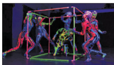
||| Grodzisk Mazowiecki - Noc muzeów - moc wrażeń s. 6