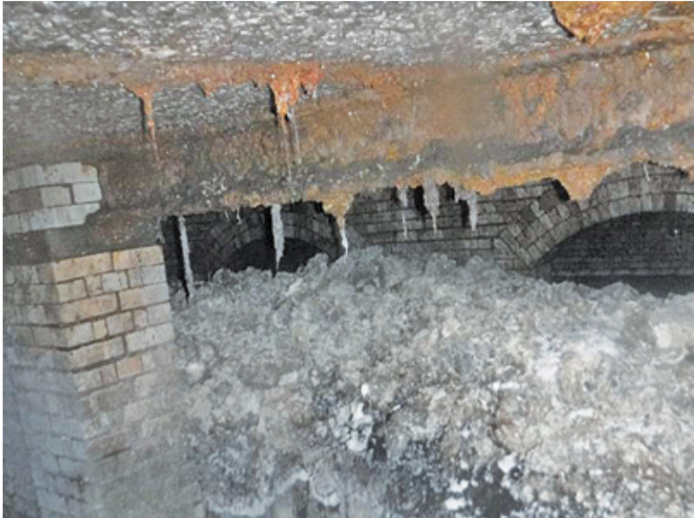
Tłuszczowa góra, ze spuszczonego w toaletach tłuszczu i nawilżanych chusteczek