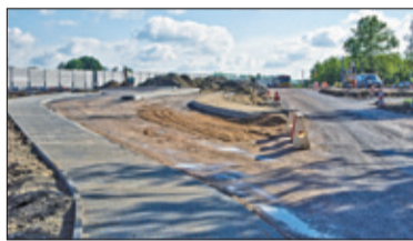
||| Nadarzyn - Utrudnienia w Starej Wsi s. 4