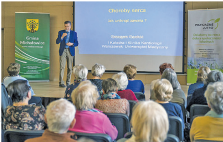
Pierwszy wykład odbył się 7 maja