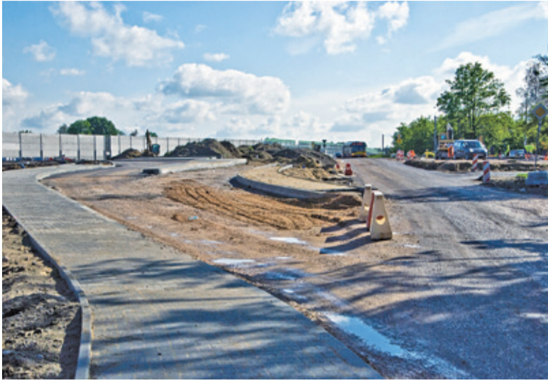
Przez rondo nie ma już przejazdu