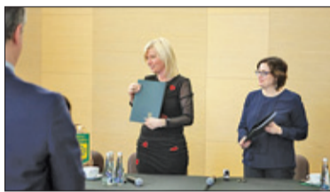
||| Michałowice - 112 chętnych s. 5