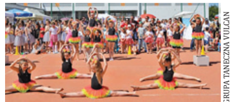
GRUPA TANECZNA VULCAN