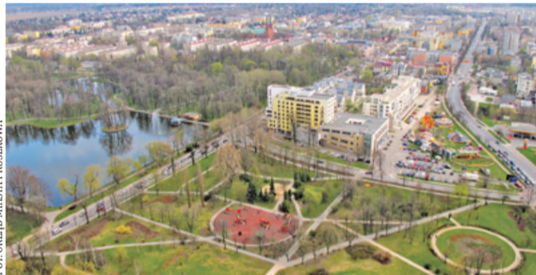
Szykują się dwa dni zabawy

Pierwszym akcentem święta miasta będzie wyścig rowerowy „Ojcowie na start”. Początek o godz. 10.00 w Parku Potulickich. Następnie akcent przeniesie się do Parku Kościuszki. Tam na mieszkańców i gości będą czekały liczne atrakcje. Na małej scenie odbędzie się festiwal baniek, podczas którego nie zabraknie zabaw i doświadczeń. Z pewnością dzieci nie będą narzekać na nudę. Nie zapomniano o rodzicach – na nich będzie czekała strefa relaksu. W Parku Kościuszki swoje punkty będą miały m.in. Nowa Stacja, Centrum Kultury i Sportu, Dance Imperium, Muzeum Starożytnego Hutnictwa Mazowie-