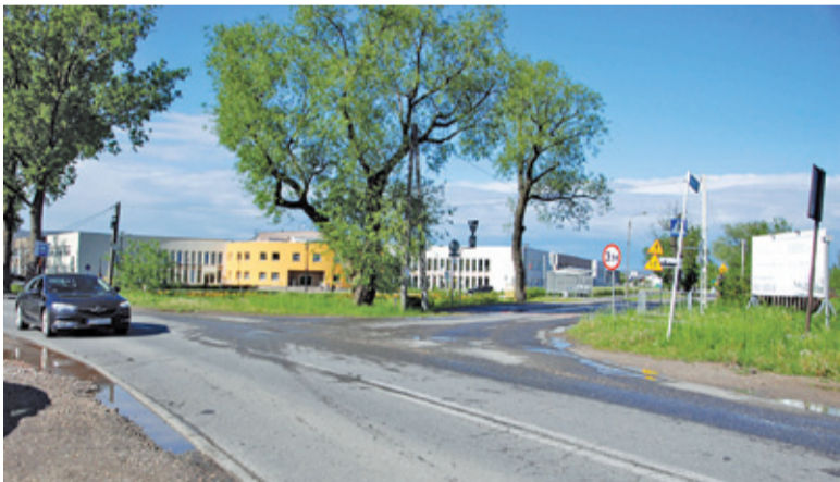
To skrzyżowanie czeka niedługo przebudowa