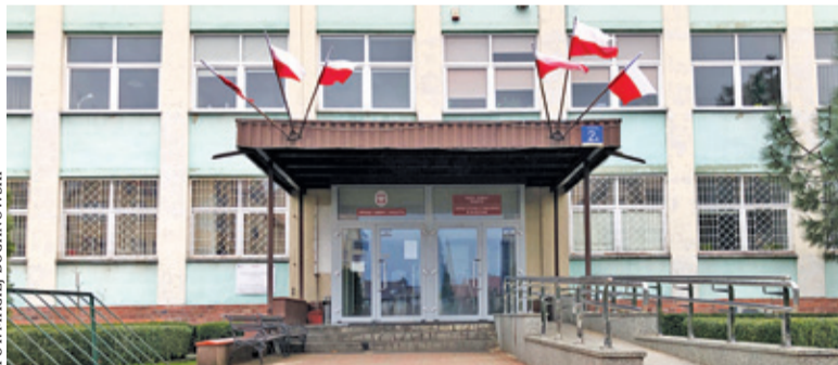
Utrzymanie L1 kosztuje więcej

Transport zbiorowy łączy pobliskie miejscowości ze sobą. Nie tylko te, które znajdują się na terenie danej gminy, ale i sąsiednich.