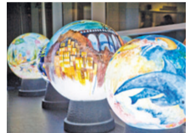
Efektowna instalacja w foyer kina przykuwała uwagę

Również Milanówek nie ma żadnego muzeum, jednak i tutaj zorganizowane zostały spotkania ze sztuką. W willi Waleria odbyło się spotkanie ze sztuką secesji. Wystawiane były dzieła z prywatnych kolekcji – obrazy, rzeźby, sztuka użytkowa. Była to również okazja obejrzenia tego zabytkowego obiektu, być może jedna z ostatnich.