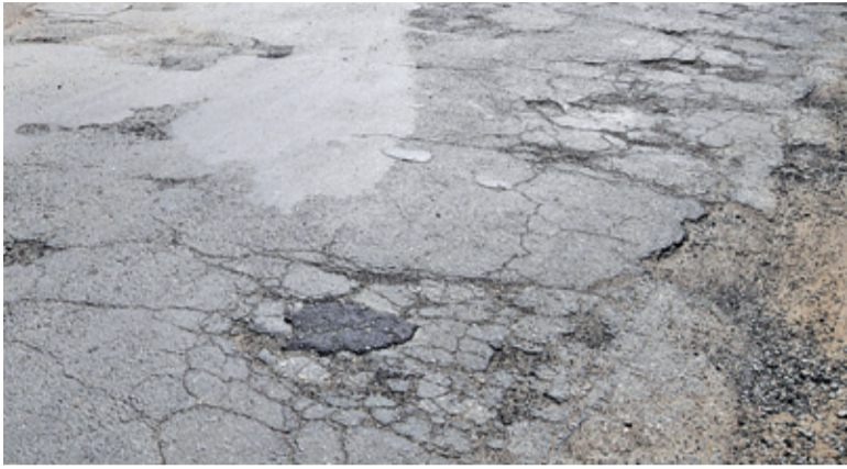
Po zimie wiele dróg wymaga pilnej naprawy