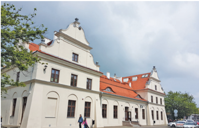
Tak prezentuje się dworzec w nowej odsłonie