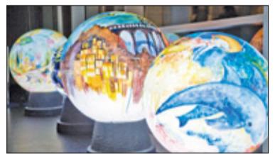
||| Grodzisk Mazowiecki, Milanówek - Twórcza noc s. 6