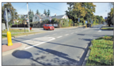
||| Brwinów - Będzie sygnalizacja na powiatówce? s. 2