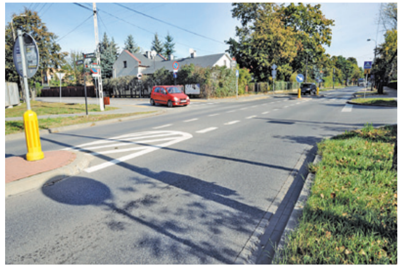
Na tym skrzyżowaniu niedługo będzie już bezpieczniej