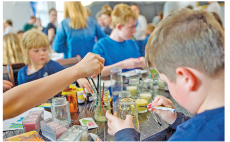
Warsztaty w Niespodziance cieszyły się ogromną popularnością