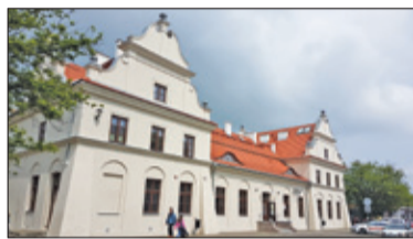
||| Pruszków - Dworzec oddany do użytku s. 3