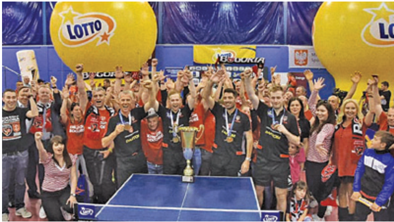
Siódmy tytuł Bogorii