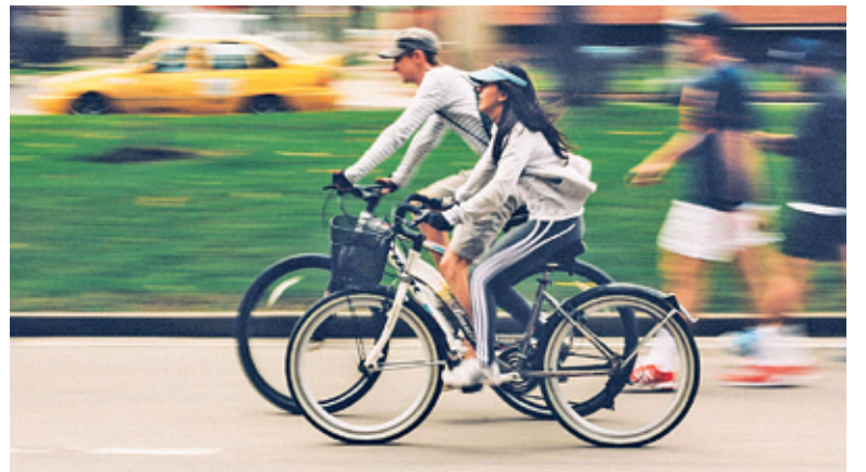
Każda przejażdżka rowerowa to cenne dla miasta kilometry

Kreńczenie kilometrów dla osiągnięcia społecznych celów to akcja, która od siedmiu lat organizowana jest przez Fundację Allegro All For Planet. W ciągu tych siedmiu lat uczestnicy wykręcili