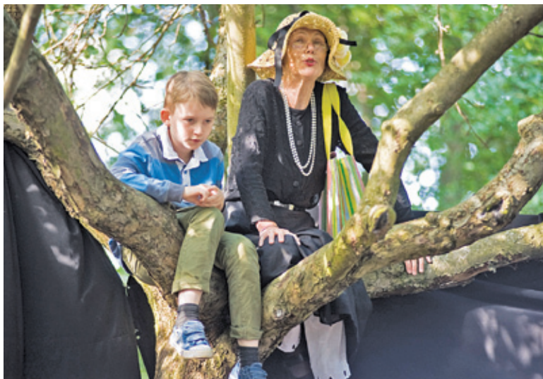
Podczas Festiwalu atrakcje spotkać można w różnych miejscach