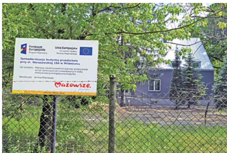
Teraz budynek ma zostać zaadaptowany na potrzeby żłobka