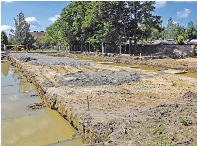
Wykonawca rozpoczął już prace