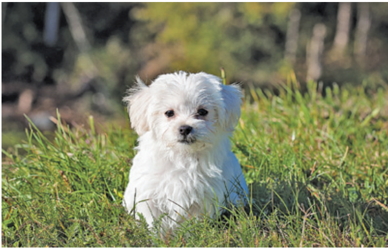
Znakowanie polega na wszczępieniu pod skórę elektronicznego chipa oraz wprowadzeniu danych do ogólnopolskiej bazy