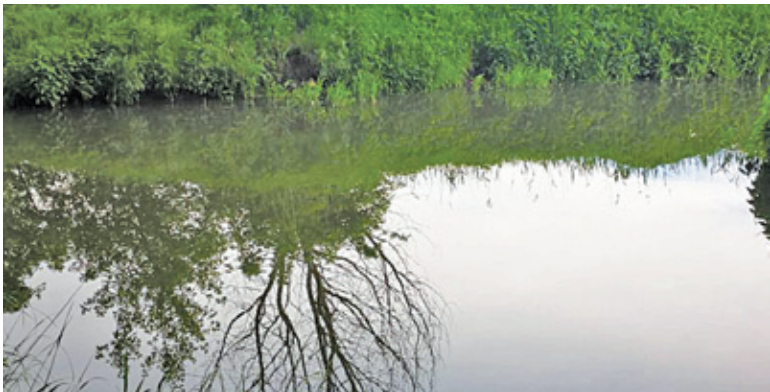
17 maja na Utracie pojawiła się piana