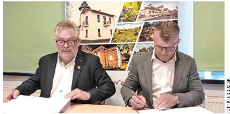
Umowa została podpisana – będzie nowa świetlica