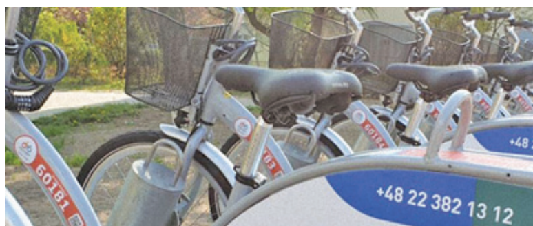
Również mieszkańcy Pruszkowa będą korzystać z infrastruktury rowerowej