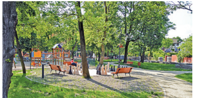
Brwinowski park zmienia się na naszych oczach

W drugim etapie, który będzie realizowany w przyszłym roku, planowane jest wybudowanie małej architektury m.in. tablice edukacyjne, placiki rekreacyjno-edukacyjne, oraz wszystkie