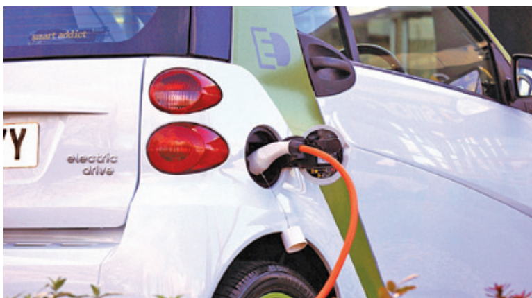
Czy Podkowa stanie się miastem zeroemisyjnym?