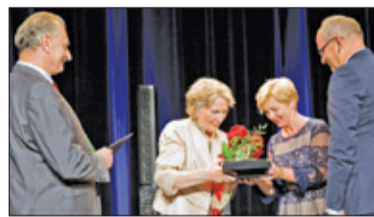
||| Nadarzyn - Druga edycja Pereł s. 4