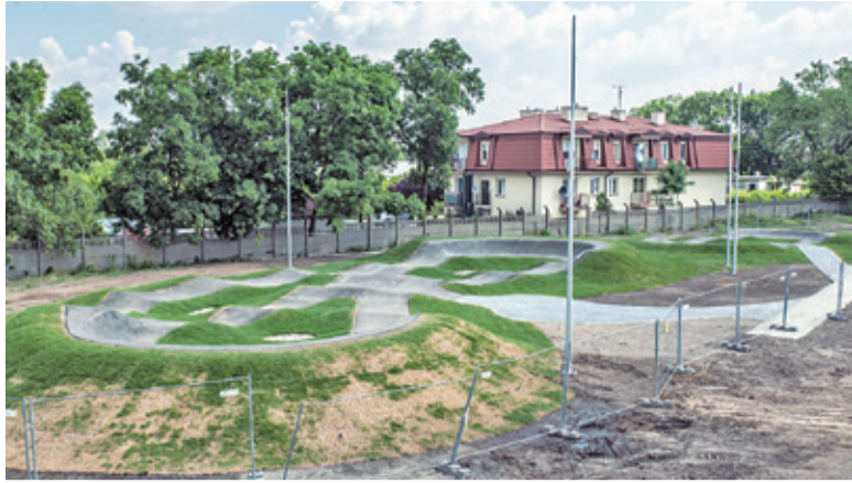
Wszystko wskazuje na to, że na początku lipca tory oddane zostaną do użytkowania