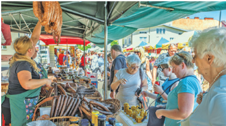
Pęta aromatycznych kielbas przyciągały swoim zapachem

Cały deptak zastawiony był stoiskami uginającymi się pod ciężarem wystawianych tu smakowitych wędlin, serów, przetworów, pieczywa, oraz piwa z lokalnych browarów. Nie mogło rzecz jasna zabraknąć miodów i pszczelich produktów – pyłku, propolisu, wosku i wyrobów wosko-