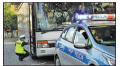
||| Powiat Pruszkowski - Sprawny autokar s. 9