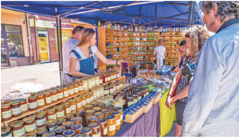
Smakosze dobrych miodów mieli tu chyba wszystkie gatunki