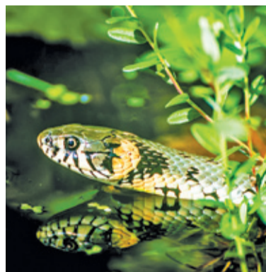
Zaskrońca uwielbia wodę i doskonale pływa. Na drodze radzi sobie jednak gorzej

Na drogach jest coraz więcej samochodów, dlatego też łatwo o spotkanie z dzikim zwierzęciem. Zderzenie z łosiem czy jeleniem może źle się skończyć dla obu stron, dlatego dużych zwierząt kierowcy się boją. Inaczej niestety jest z drobnymi – jeże i zaskrońce giną na drogach masowo.