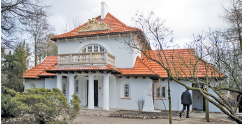
Samorząd Brwinowa dba również o rewitalizację obiektów zabytkowych