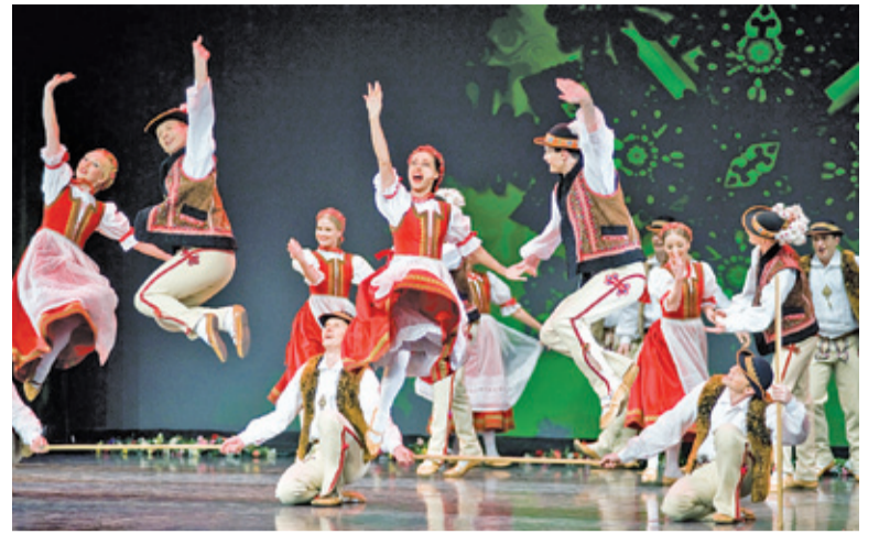
Wśród wielu piknikowych atrakcji będą również występy „Mazowsza”