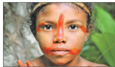
||| Grodzisk Mazowiecki - Brave Kids w Mediatece s. 7