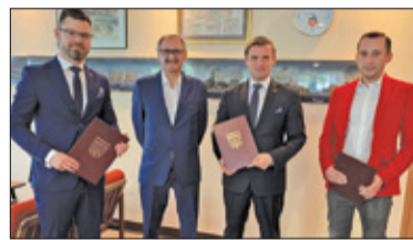
||| Pruszków - Rusza budowa s. 5