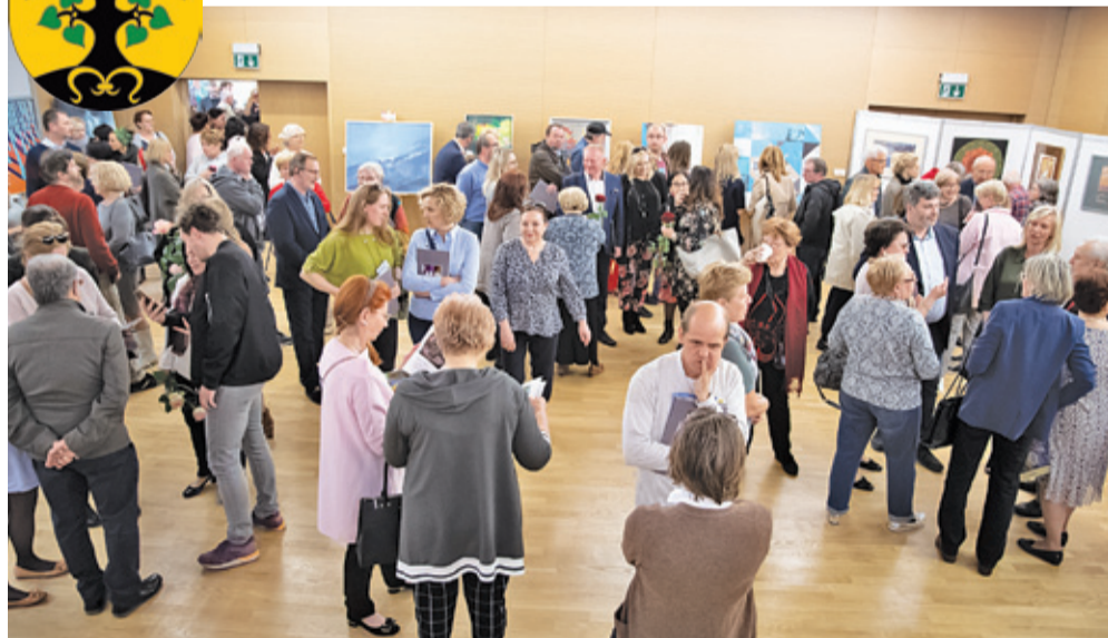
Otwarcie wernisazu w Sali Multimedialnej Urzędu Gminy Michałowice

URZĄD GMINY MICHAŁOWICE Reguły, ul. Aleja Powstańców Warszawy 1, Michałowice, tel. (22) 350 91 91, www.michalowice.pl