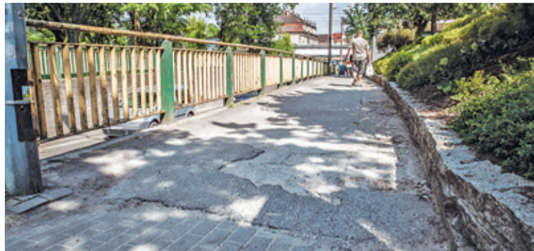
Chodnik pod wiaduktem od dawna wymagał remontu