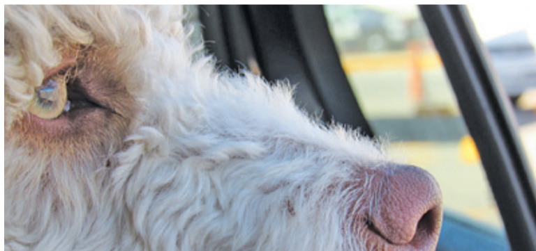
W zamkniętym samochodzie podczas upału jest kilkadziesiąt stopni Celsjusza

Najpierw dziecko się poci, ale siedzi spokojnie. Na parkingu do auta podchodzą ludzie, machają mu, próbują otwo-