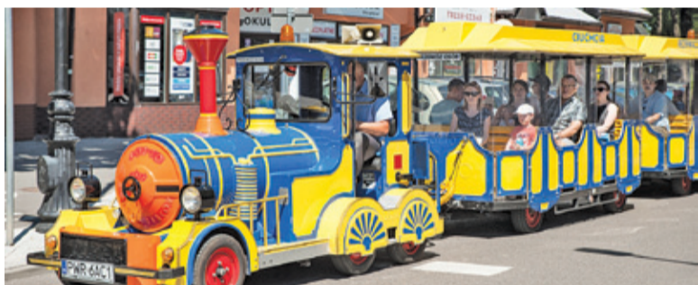
Przejażdżki kolejką po mieście miały wielu chętnych

wych. Wiele stoisk wystawiało wyroby artystyczne i biżuterię. Jarmarcznego charakteru dodawały stoiska z produktami dla dzieci – plastikowe balony, upiorne maski, i inne gadżety. Jarmark określany jest jako międzynarodowy, jednak jedynym produktem spoza Polski, jaki udało nam się dostrzec, było austriackie piwo.