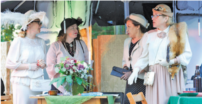
Teatr sztuki improwizowanej wystawił w willi Zagroda swój drugi spektakl