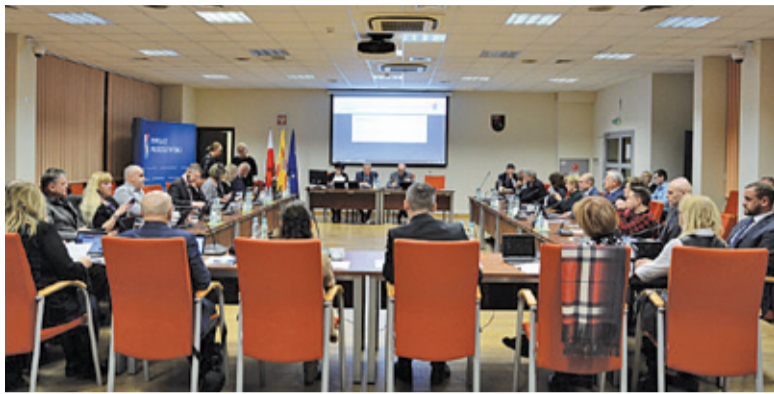
Rada Powiatu Pruszkowskiego