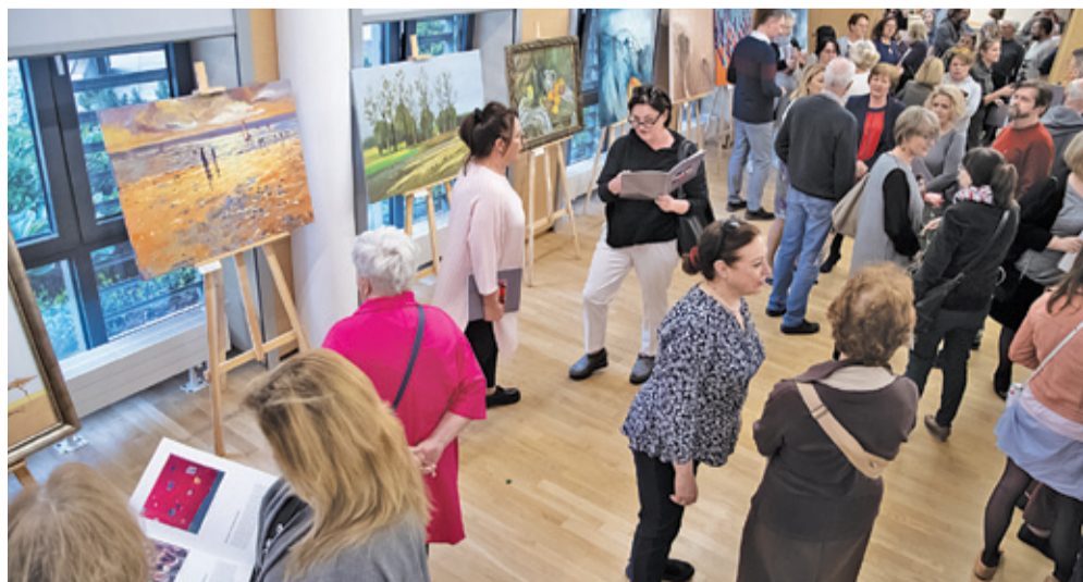
Na wystawie zgromadzono prace przeszło trzydziestu artystów, a pierwszego wieczora odwiedziło ją ponad 150 osób