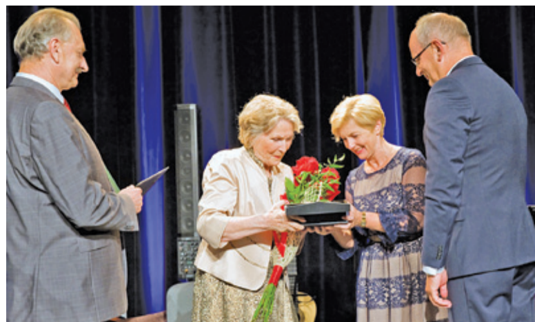
Podczas ubiegłorocznej Gali Super Perłę odebrała m.in. Irena Santor