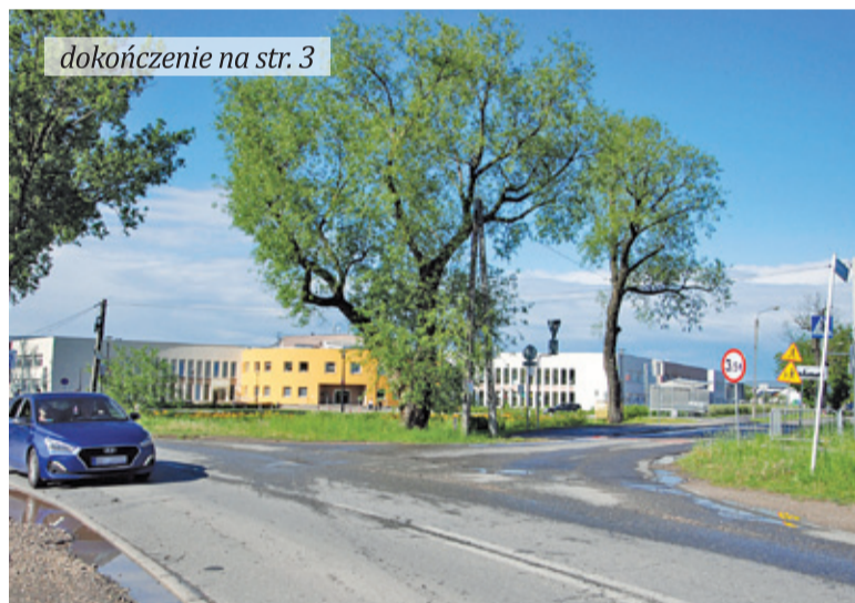
dokończenie na str. 3