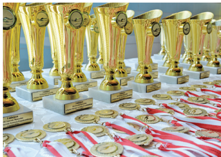
FOT. POWIAT PRUSZKOWSKI