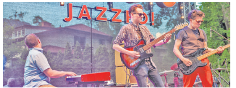
Koncert zespołu Jazzpospolita w willi Borówka rozpoczął tegoroczną edycję festiwalu

W Milanówku Festiwal Otwarte Ogrody rozpoczął się już w piątek inauguracyjnym koncertem jazzowego