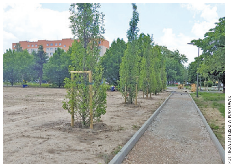
Na terenie pojawiły się nowe nasadzenia