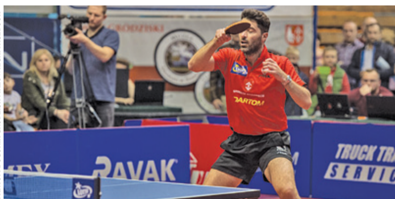
DARTOM BOGORIA GRODZISK MAZOWIECKI FACEBOOK