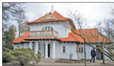
||| Brwinów - Podsumuj rok s. 2

P R U S Z K Ó W ||| P I A S T Ó W ||| B R W I N Ó W ||| M I C H A Ł O W I C E ||| N A D A R Z Y N ||| R A S Z Y N