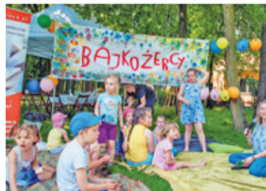
Bajkożercy to przygotowana przez Bibliotekę im. W. Wernera przygoda z literaturą dla najmłodszych

W sobotę, już od godziny 10.00, w ogrodzie Biblioteki Publicznej im. W. Wernera Otrębusach, na najmłodszych „ogrodników” czekało mnóstwo atrakcji odbywających się pod wspólnym tytułem „Bajkożercy w krainie kolorów”. Było wspólne czytanie bajek połączone z konkursem, warsztaty plastyczne, quizy i tańce.