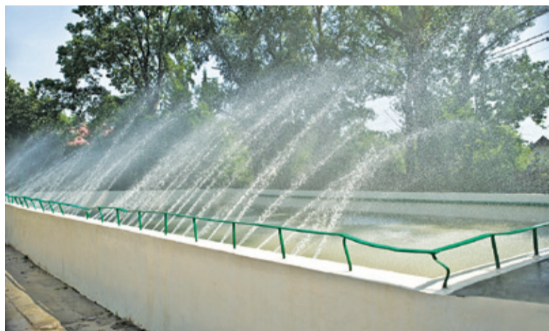
System oczyszczania wody pracuje pełną parą