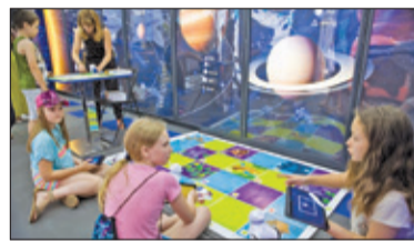
||| Milanówek - Mobilne Centrum Edukacyjne s. 4