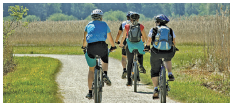
Wspólne wycieczki rowerowe są o wiele przyjemniejsze