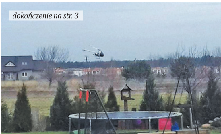
Mieszkańcy twierdzą, że helikoptery latają tuż nad ich dachami