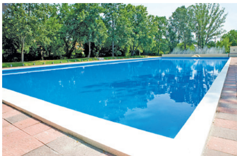
Wyremontowany basen robi duże wrażenie