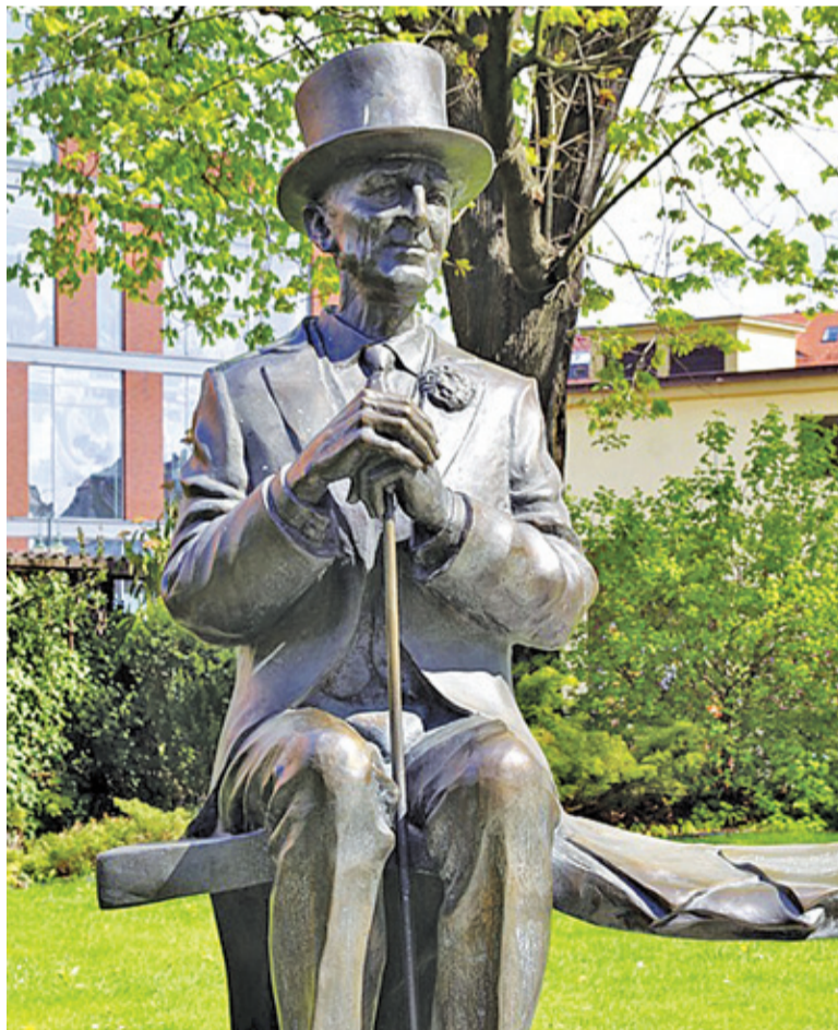
Pomnik Jeremiego Przybory

23 czerwca odbędzie się ostatni przed wakacjami „Salon Poezji K40”.