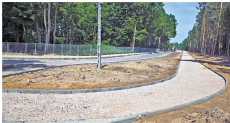
Prace na dojeździe do „Mazowsza” realizowane są w dobrym tempie

Wartę honorową wystawiła 6. Mazowiecka Brygada Obrony Terytorialnej oraz Stowarzyszenie Strzelcy Rzeczpospolitej – Pruszków. Artur Szpuła