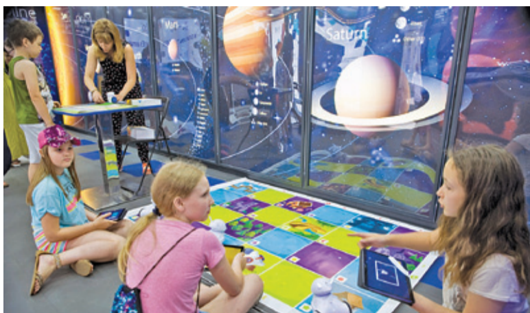
W warsztatach wzięło udział wielu uczniów milanowskich szkół