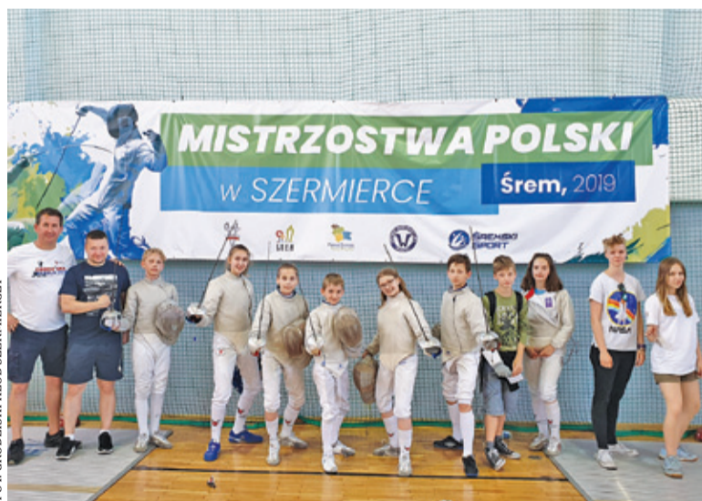
Zawodnicy podczas mistrzostw Polski

Klub z Grodziska rozwija się i zbiera doświadczenia na różnych turniejach. Start w mistrzostwach Polski ma wyjątkowy charakter, a zarazem prestiż. Rywalizacja w Śremie na długo zapisze się w pamięci zawodników i trenerów grodzkiego klubu. Wszyst-