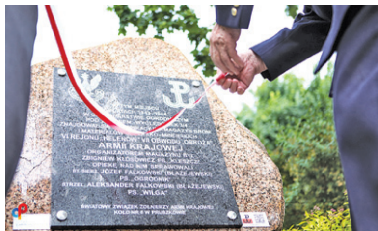
Tablica przy ul. Ewy 22A