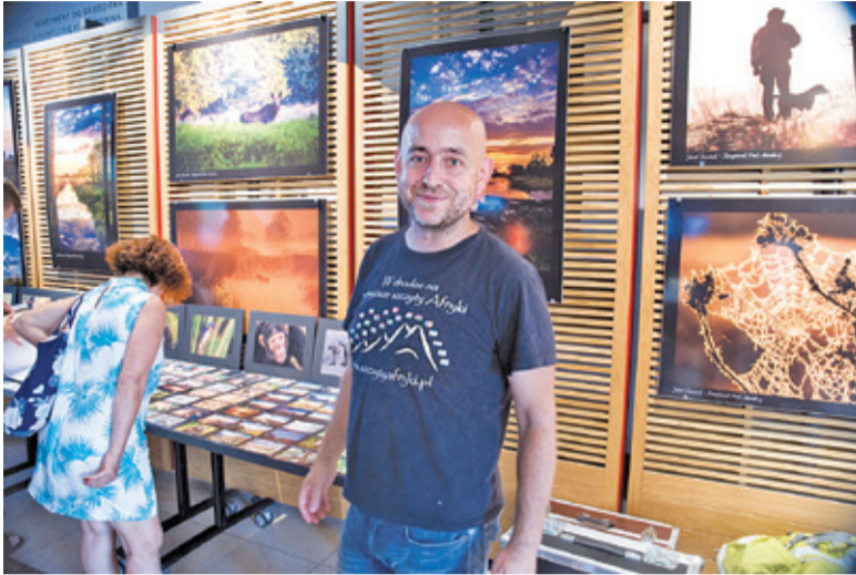
Autor z dumą prezentował swoje znakomite fotografie