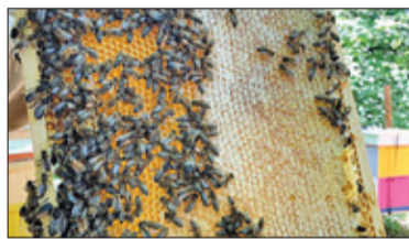
||| Pruszków - Pruszkowskie pszczoły s. 3