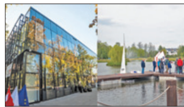
||| Grodzisk Mazowiecki - Głosuj na grodziskie inwestycje s. 5