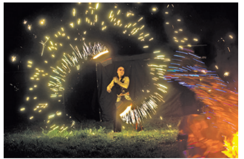
Teatr Ognia znakomicie wpisuje się w klimat święta