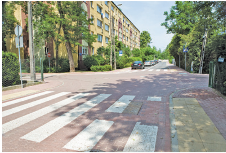
Ulica Kraszewskiego w Brwinowie wygląda teraz znakomicie

Pierwsza z nich to przebudowa ulicy T. Kościuszki w Brwinowie. Inwestycja realizowana była etapami, zaś zakres prac przewidziany do realizacji w latach 2018-2019 obejmował roboty na odcinku od ulicy Kraszewskiego do końca oraz odcinek ulicy Kraszewskiego od Psczelińskiej do Konopnickiej. W ramach inwestycji wybudowany został system odprowadzania wód opadowych, a także chodniki ze zjazdami do posesji. Na jezdni położona została na-