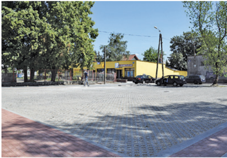
Targowisko przeszło metamorfozę