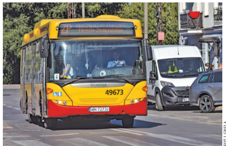
Władze Pruszkowa kontynuują rozmowy z ZTM

Na uciążliwe sąsiedztwo skarżą się przede wszystkim osoby starsze oraz matki małych dzieci.