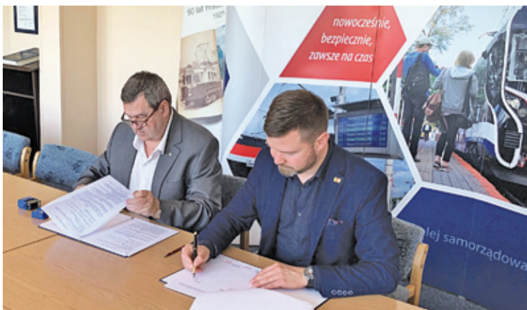
Umowę podpisano 12 czerwca