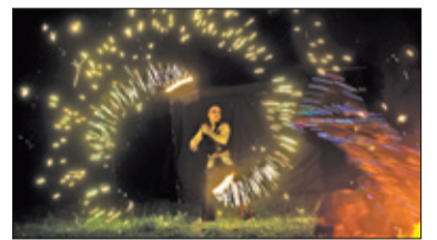
||| Grodzisk Mazowiecki - Grodziskie wianki s. 6