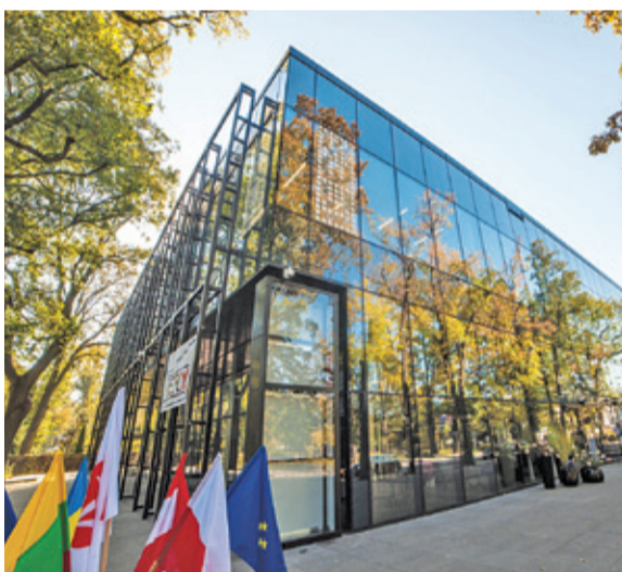
Grodziska Mediateka zajmuje w tej chwili siódmą pozycję, a Stawy Walczeskiego są na ósmym miejscu