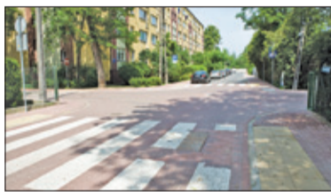
||| Brwinów - Kolejne drogi gotowe s. 2