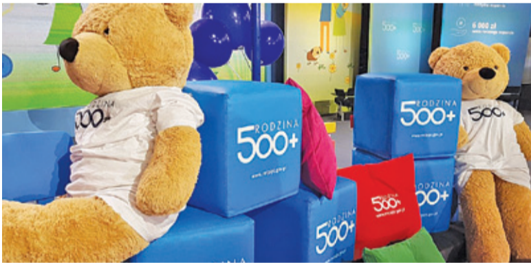
Od 1 lipca w programie 500+ nastąpią istotne zmiany