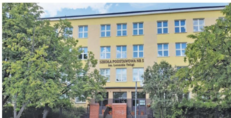
Zarówno gmina, jak i władze szkoły chciałyby wykonać remont podczas wakacji