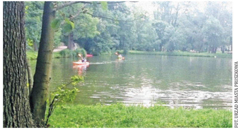
Jedna z propozycji – kajaki