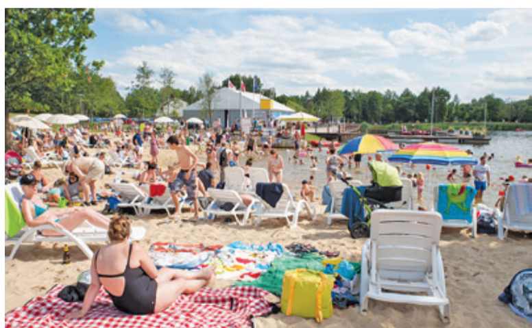
Plaża i kąpielisko były tego dnia oblegane