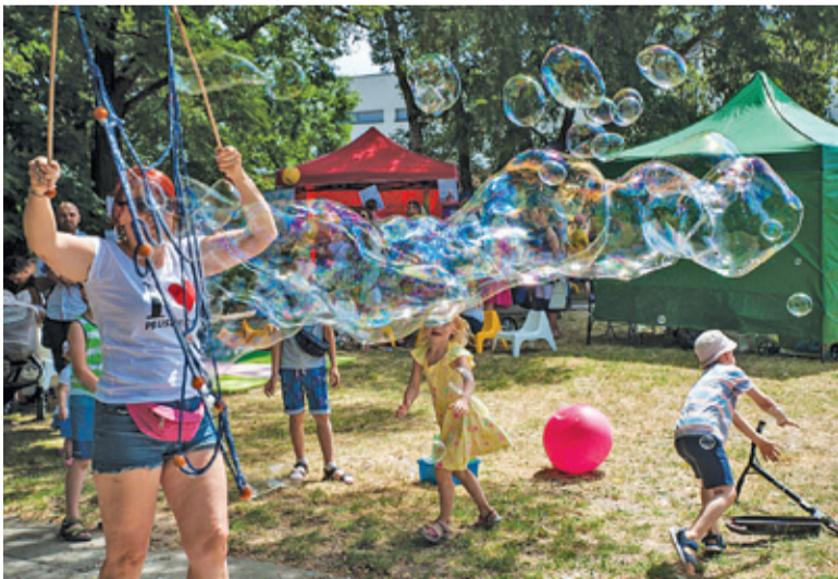
Dzieci uganiały się za gigantycznymi bańkami