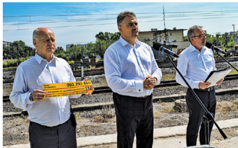
Dzięki żółtej naklejce w ciągu roku 78 razy wstrzymano ruch pociągów na linii kolejowej

100-tonowa lokomotywa, jadąca jedynie 30 km/h, zmiażdżyła osobowe kombi, które w wyniku uderzenia zapaliło się, i przesunęła je o kilkaset metrów. To zrobiło wrażenie. Od razu nasuwa się wtedy myśl, co by się stało, gdyby to był pociąg towarowy, ważący