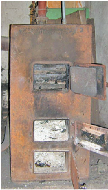
Stare kotły powinny być wymienione

Program Ograniczenia Niskiej Emisji (PONE) ma na celu przede wszystkim systemowe ograniczenie emisji szkodliwych substancji do atmosfery, a wiąże się to z kompleksową wymianą nieefektywnych źródeł ciepła, które