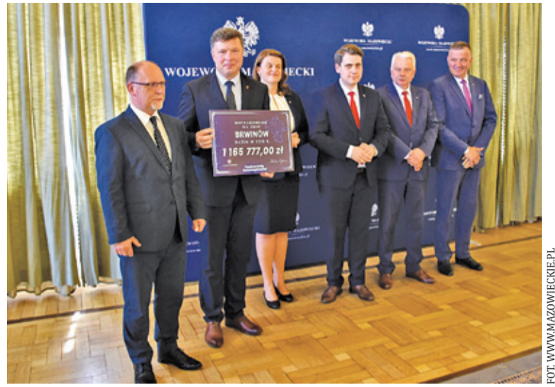
Burmistrz Brwinowa prezentuje otrzymaną promesę