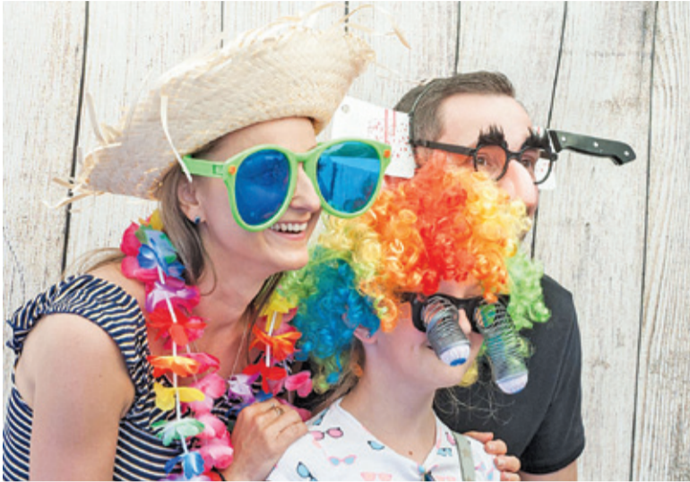
Foto Budka oferowała ekstra foty do rodzinnego albumu