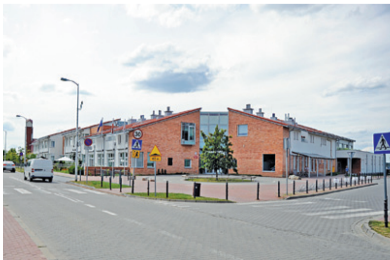
Ten odcinek zostanie przebudowany, co poprawi bezpieczeństwo uczniów

Z większające się systematycznie natężenie ruchu pojazdów w Alei Marylskiego, przy której znajduje się książenicka podstawówka, powoduje