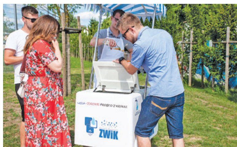
Grodziski ZWIK serwował sodówkę (z sokiem lub bez) prosto z saturatora, który był hitem w czasach PRL

Grodziskim Wiankom towarzyszyła również niezwykle widowiskowa atrakcja, jaką jest Holi – święto kolorów. Zwyczaj ten wywodzi się z hinduskiej tradycji świętowania radości i wiosny. Tradycja obsypywania się kolorowymi proszkami holi rozprzestrzeniła się w ostatnich latach w wielu rejonach Europy i Ameryki Północnej jako święto miłości i kolorów wiosny. Również w Polsce od kilku lat zwyczaj ten popularyzuje się w ogromnym tempie, dając mnóstwo radości uczestnikom w każdym wieku. Święto kolorów towarzyszy również Grodziskim Wiankom i jest to po prostu szalona zabawa w rytm muzyki didżeja. Uczestnicy bawią się, posypując proszkiem w jaskrawych