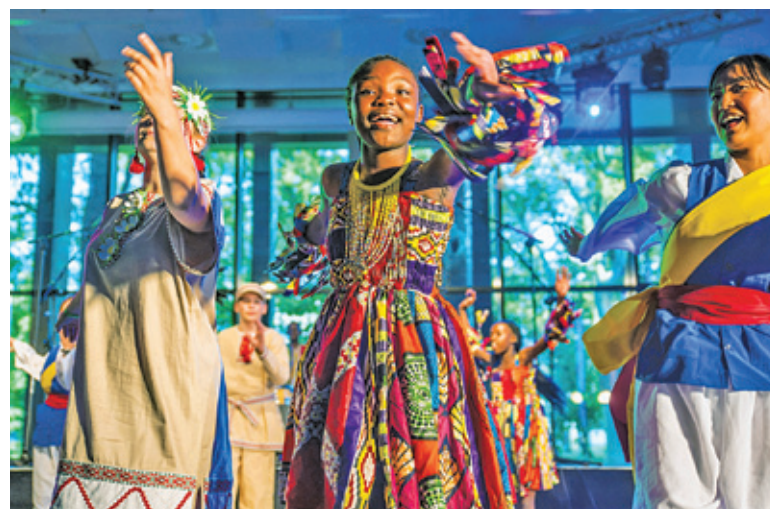
To był wielobarwny, niezwykle dynamiczny spektakl