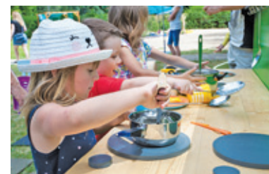
Dla dzieci przygotowane były specjalne atrakcje

Dla wszystkich uczestników, a zwłaszcza tych najmłodszych, przygotowano mnóstwo atrakcji. Warsztaty origami, błotna kuchnia, pawilon gier, stoisko milanowskiej Biblioteki Publicznej „Uwalniamy książkę” – to tylko niektóre z nich. Ogromną frajdę sprawili wszystkim strażacy milanowskiej OSP, którzy zafundowali kąpiel w pachnącej pianie.