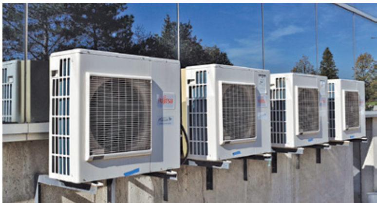
Instalacje klimatyzacyjne stają się coraz bardziej powszechne