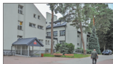
||| Michałowice – Czas na remont s. 5