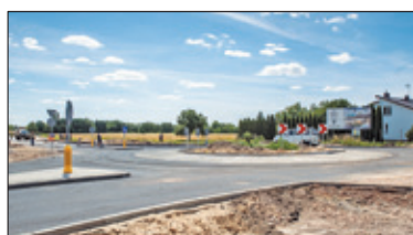
||| Nadarzyn – Przebudowa Południowej s. 3