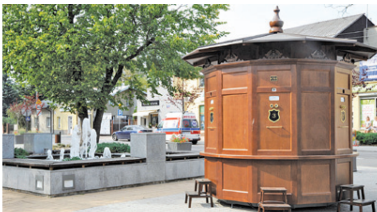
Przez dwa miesiące brwinowski fotoplastykon będzie promował miasto w mrzeżyńskim porcie