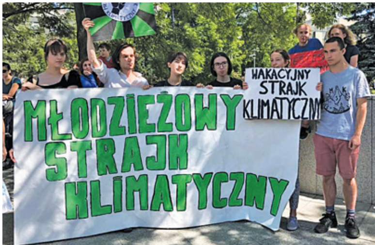
Do protestu 13-letniej grodziszczanki dołącza coraz więcej osób i organizacji