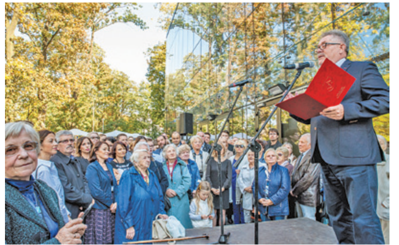
Za tę inwestycję burmistrz Grodziska zbiera same pochwały