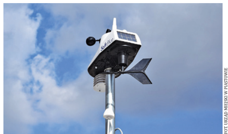
Piastów monitoruje jakość powietrza