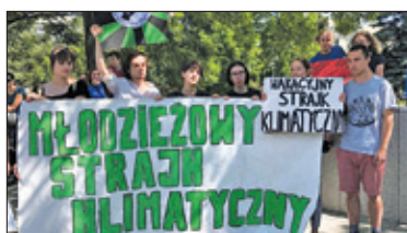
||| Grodzisk Mazowiecki – Strajk dla planety s. 4