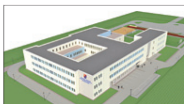
||| Powiat Pruszkowski – Krok w stronę ośrodka s. 2