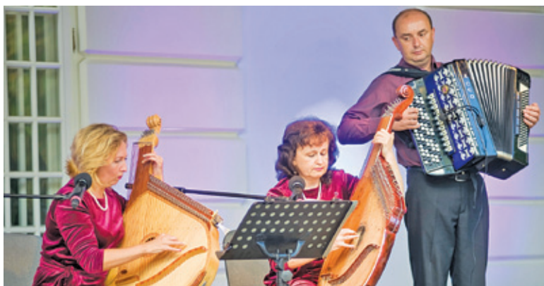
W Młochowskim parku usłyszeć można dźwięki z różnych stron świata

Tradycyjnie w programie usłyszycie muzyków śpiewających i grających