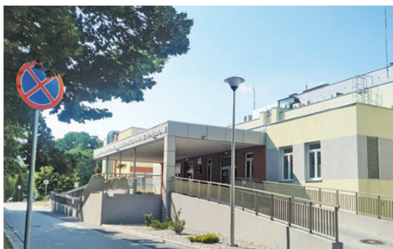
Oprócz problemów z brakiem lekarzy szpital ma też poważne długi