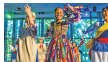
||| Grodzisk Mazowiecki – Spektakl Brave Kids s. 6