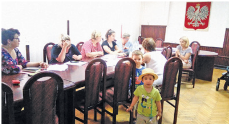
Mieszkańcy chcący złożyć wniosek mogli skorzystać z pomocy