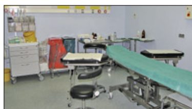
||| Grodzisk Mazowiecki - Szansa dla grodziskiego SOR s. 2