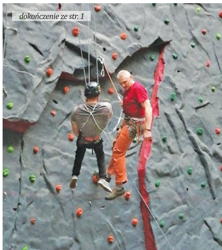
dokończenie ze str. 1

Mieszkańcy mogą korzystać m.in. ze ścianki wspinaczkowej