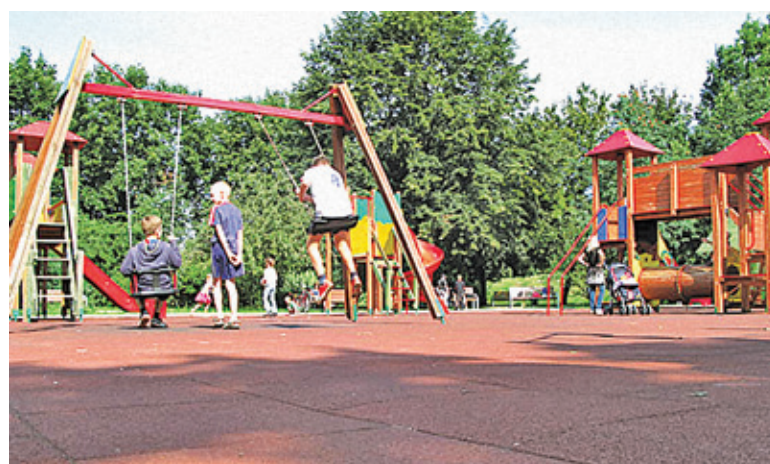
W ramach remontu placu planowana jest m.in. rozbiorka istniejącej nawierzchni z płyt gumowych