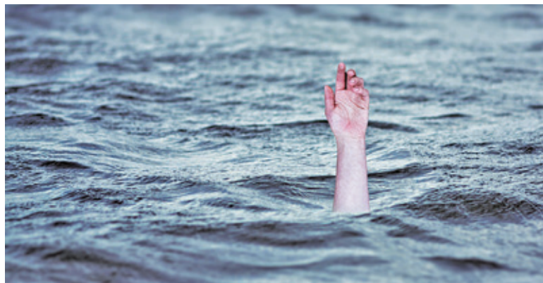
Od kwietnia utonęło w Polsce 196 osób

Nie skaczą do wody w nieznanymi miejscach. Jeżeli skaczesz, musisz dokładnie wiedzieć, na jakiej głębokości jest dno i jakie ono jest. Z dna może