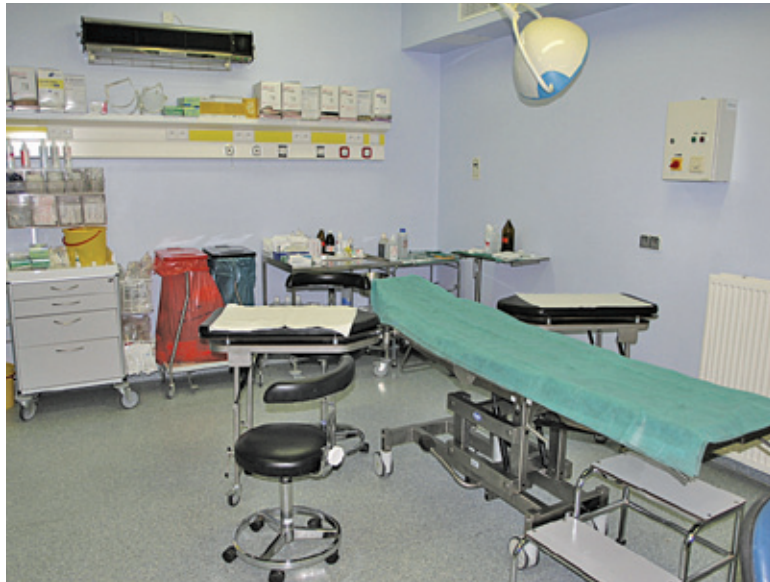
Czy grodziski SOR zostanie odciążony?

Pacjenci zmuszeni do skorzystania z pomocy lekarskiej w Szpitalnym Oddziale Ratunkowym grodziskiego Szpitala Zachodniego czekają na przyjęcie nawet 6 godzin. Oddział jest bowiem mocno przeciążony. Pojawiła się szansa na wsparcie grodziskiego oddziału.