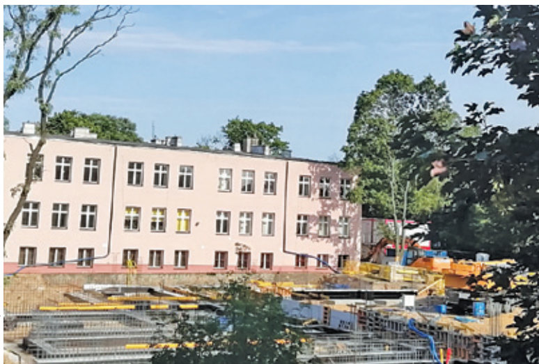
Liceum zostanie rozbudowane