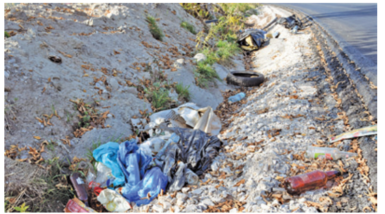
Utylizacja odpadów to coraz większy problem wszystkich samorządów