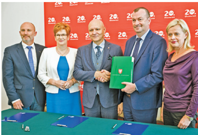
Przedstawiciele gmin podpisali stosowne umowy