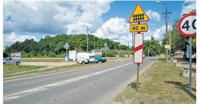
Przy stacji WKD w Otrębusach powstanie parking P&amp;R

– tydzień działań, podczas którego organizowane będą festyny, pikniki, happeningi, panele dyskusyjne oraz inne działania promujące zrównoważony transport;