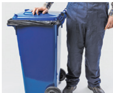
Stawki poszybowały w górę

Ostatnie miesiące były dla samorządowców niezwykle ciężkie. Wszystko przez kwestię stawek za gospodarowanie odpadami. Przez wszystkie przypadki odmieniano słowo „podwyżka”. Na firmy odbierające odpady patrzono ze strachem, a gdy trzeba było ogłaszać przetarg – obawiano się wyso-