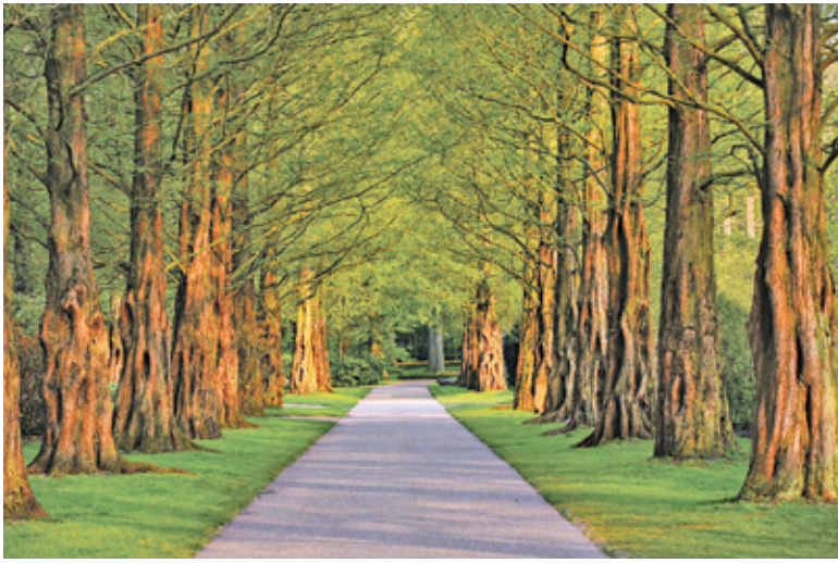
Ograniczenie zużycia papieru to krok w stronę ochrony środowiska