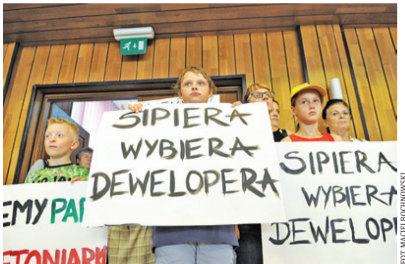
Protestujący byli także na sesji