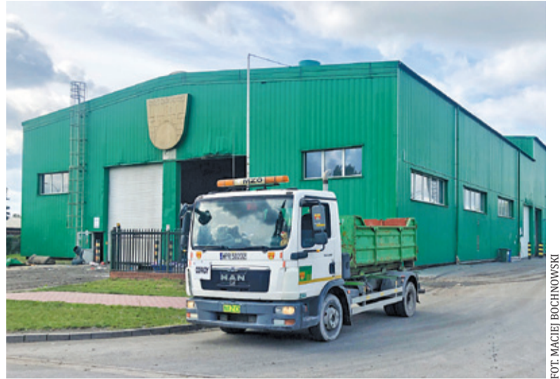
Miejski Zakład Oczyszczania w Pruszkowie

Temat smrodu związanego z funkcjonowaniem MZO nie jest niczym nowym. Mieszkańcy w pobliżu przedsiębiorstwa regularnie narzekają na fetor. Szczególnie w okresie letnim. Podejmowano liczne inicjatywy, prowadzono rozmowy z władzami miasta i MZO, aby rozwiązać tę kwestię. Nie