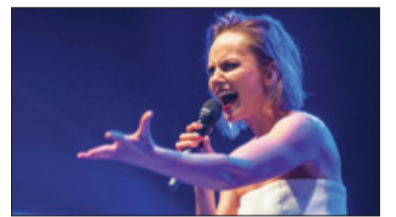
||| Milanówek - Dni Milanówka s. 6