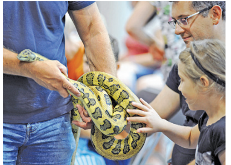
Spotkanie pytona czy boa dusiciela to ogromne przeżycie