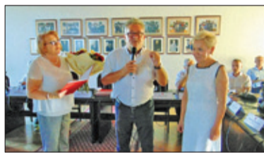
||| Grodzisk Mazowiecki - Z ostatniej sesji s. 2