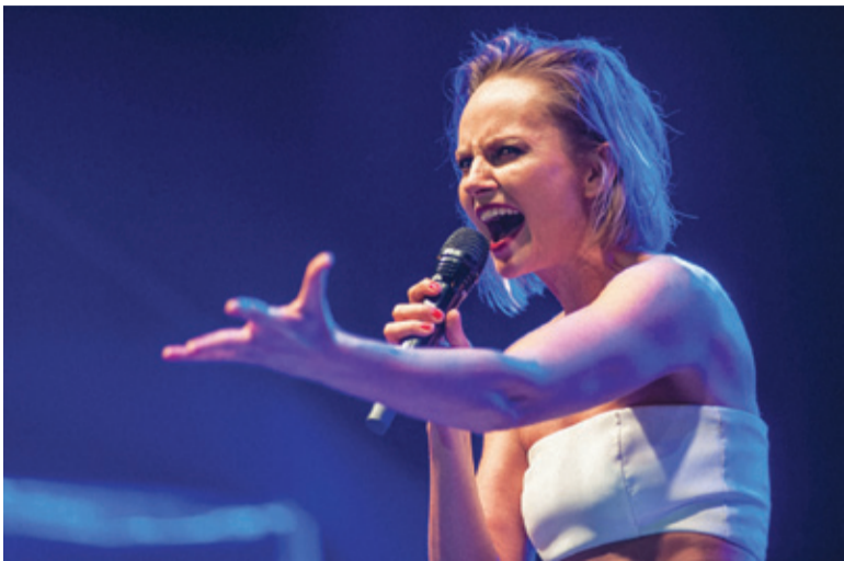
Koncert Varius Manx z Kasią Stankiewicz przyciągnął wielu mieszkańców