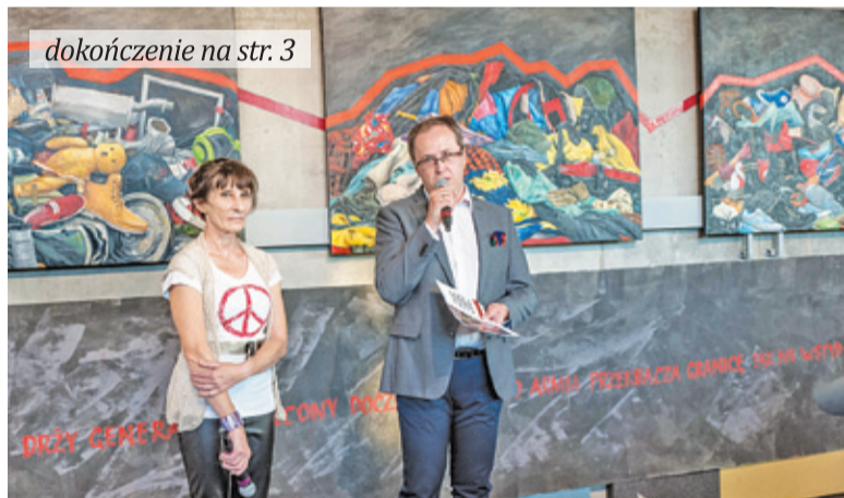
dokończenie na str. 3