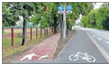
||| Piastów - Ścieżka gotowa s. 4