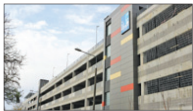
||| Region - Dofinansowanie na parkingi s. 2