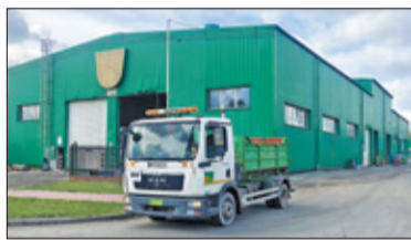
||| Pruszków - Śmierzący problem s. 4