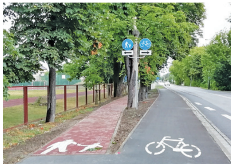
Tak prezentuje się nowa ścieżka