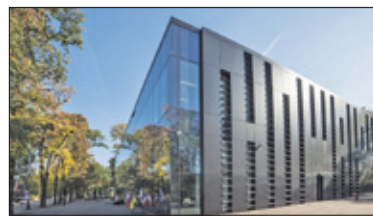
||| Grodzisk Mazowiecki, Brwinów - Nagrodzone inwestycje s. 4