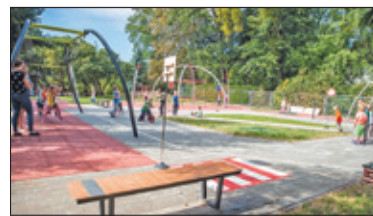
||| Brwinów - Edukacyjny plac zabaw s. 6