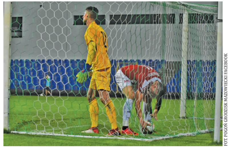
W obecnym sezonie Pogoń straciła 19 bramek