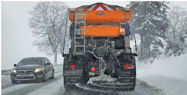
Czy zima zaskoczy drogowców?