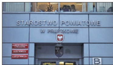
||| Powiat Pruszkowski - Starostwo rozwija e-usługi s. 3