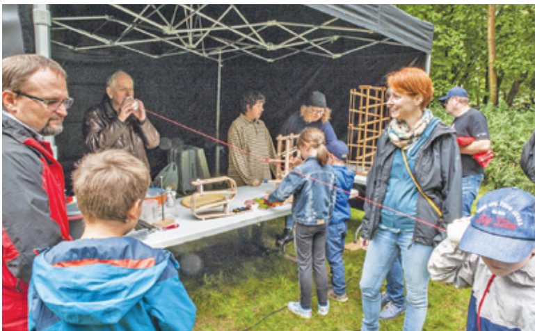
Dużą atrakcją festynu były różnego rodzaju warsztaty