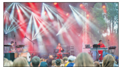
||| Grodzisk Mazowiecki - Święto Miasta s. 6