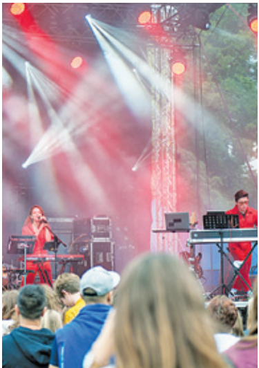
Bardzo dobry koncert zagrał zespół The Dumplings