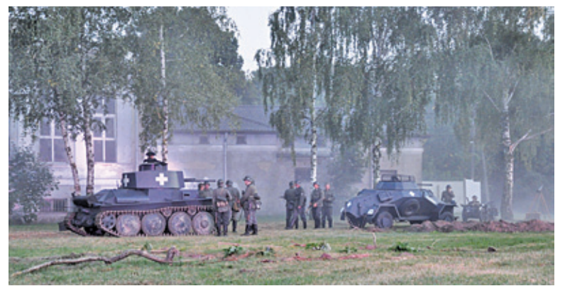
Zdjęcie z ubiegłorocznej rekonstrukcji

Sobotę (14 września) tradycyjnie wypełnią koncerty (początek o godz. 18.00) podczas których zagrają: Blues Fathers, Sunday After, Rock Union, a także gwiazda wieczoru – zespół Perfect. Od 15.00 będzie można odwiedzić stowarzyszenia, fundacje,