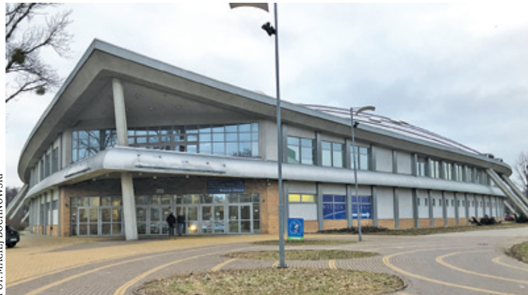
Pruszkowski welodrom znów stanie się areną zmagani

Zbliżają się wielkie kolarskie emocje na pruszkowskim torze. Międzynarodowe Zawody Torowe ORLEN GRAND PRIX Poland odbędą się w dniach 20-22 września.