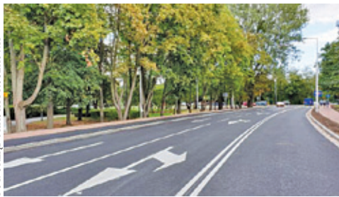
FOT. URZĄD MIASTA PRUSZKOWA

Środki otrzymał również powiat pruszkowski – ponad 1,4 mln zł dofinansowania do wykonanego już ronda na skrzyżowaniu ul. Powstańców i ul. Plantowej z ul. Stalową w Pruszkowie. Dwa wnioski znajdują się na liście rezerwowej – skrzyżowanie al. Armii Krajowej z ul. ks. Józefa i ul. Andrzeja w Pruszkowie oraz ul. Pruszkowska w Granicy.