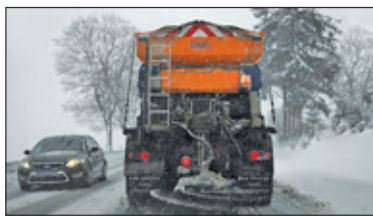
||| Pruszków - Przygotowania do zimy s. 2