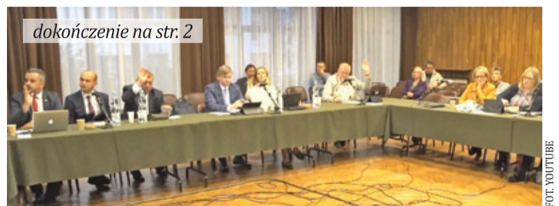
dokończenie na str. 2

Temat przeprawy pojawił się kilka lat temu. Początkowo bardziej prawdopodobna wydawała się opcja budowy tunelu, jednak z czasem kon-