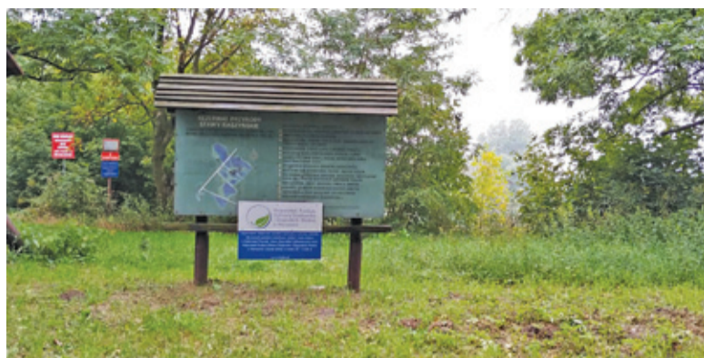
Akcja odbędzie się 12 października