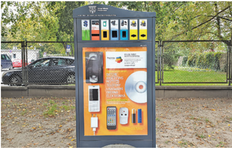
Punkt mieści się przy ul. Kraszewskiego