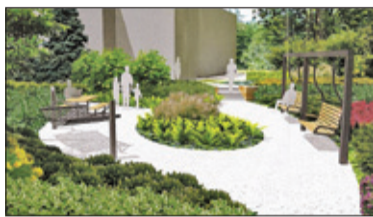
||| Podkowa Leśna - Wybrali rekreację s. 2