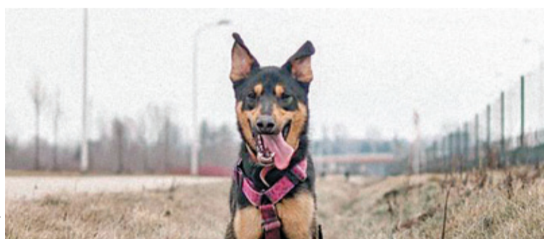
Milanowskie bezdomniaki czekają na gości, którzy zabiorą ich na spacer