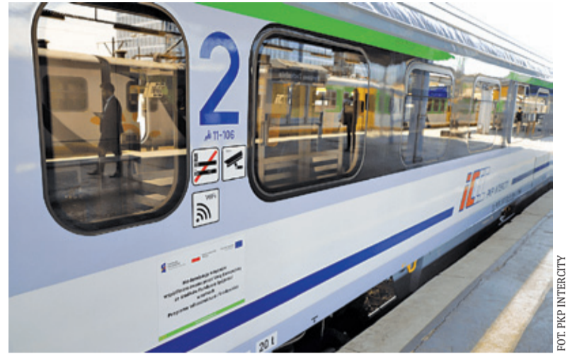
Z Grodziska do Krakowa i Wrocławia pojedziemy bez przesiadek