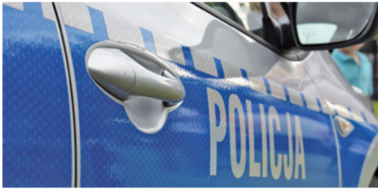
Policja przestrzega przed próbami łapania przepisów