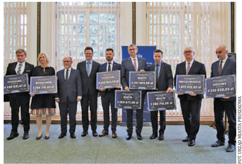
Samorządowcy z czekami