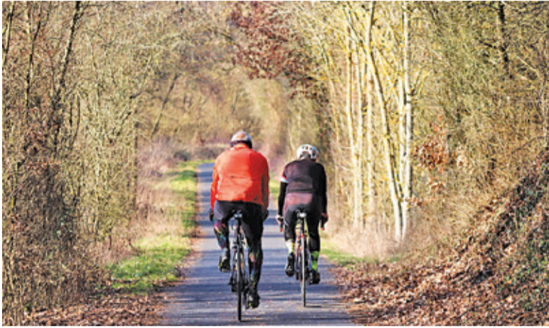
Pierwszy krok to wykonanie projektu ścieżki