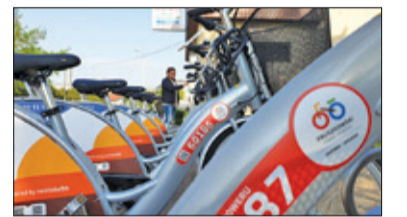
||| Pruszków - Rowerowe plany s. 6