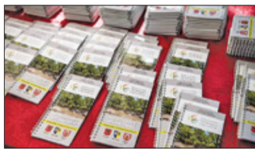
||| Milanówek - W rękach mieszkańców s. 4