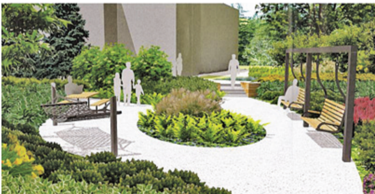
Tak zwycięski projekt prezentuje się na wizualizacjach