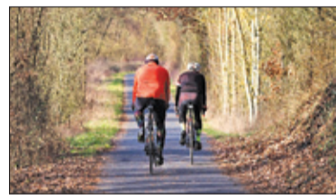
||| Michałowice - Ścieżka wzdłuż rzeki s. 5