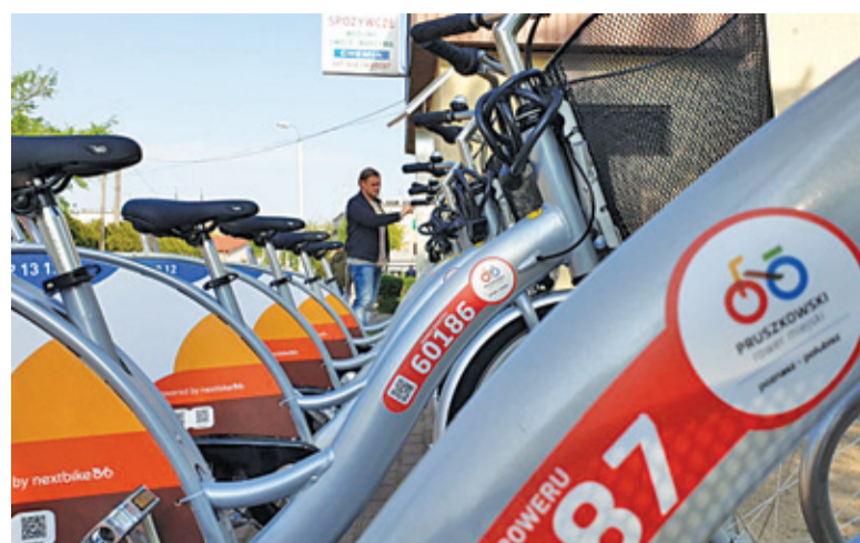
W tym roku do dyspozycji mieszkańców jest ponad 100 rowerów