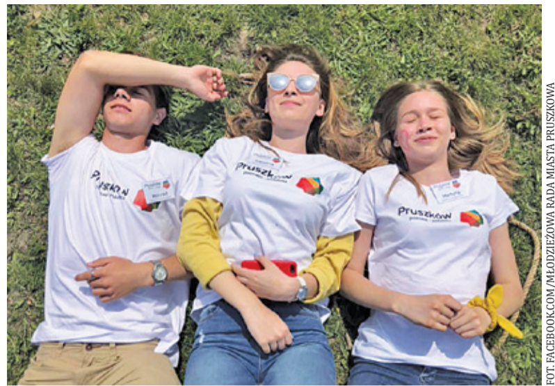
Młodzieżowa rada działa m.in. w Pruszkowie