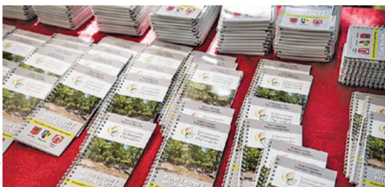
W ubiegłych latach w ramach Budżetu Obywatelskiego między innymi wydano przewodnik rowerowy