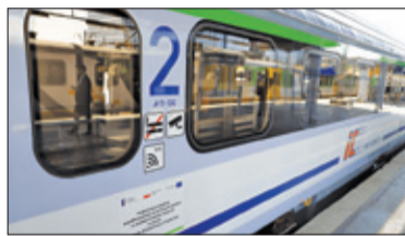
||| Grodzisk Mazowiecki - Pociągi będą stawać s. 3