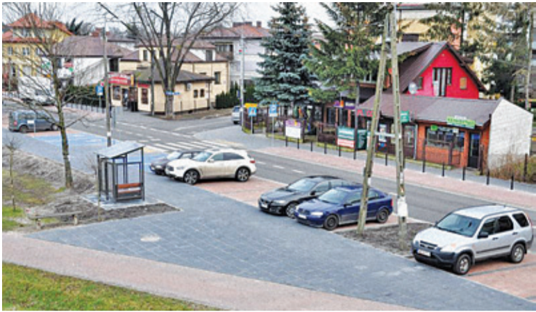
Parking przy ul. Hallera