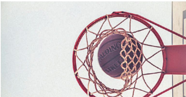
Elektrobud przegrał drugi mecz w sezonie