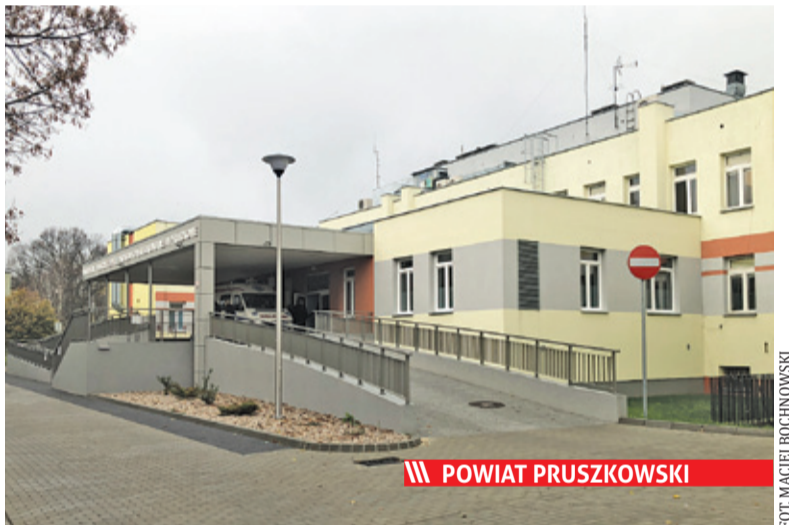
Szpital powiatowy w Pruszkowie

Kilka dworców w naszym regionie odzyska dawny blask.