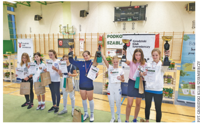
Najlepsi sięgnęli po medale i nagrody