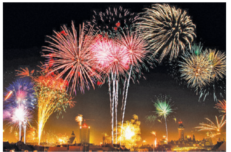
Mieszkańcy Grodziska Mazowieckiego i Pruszkowa nie chcą fajerwerków w sylwestra