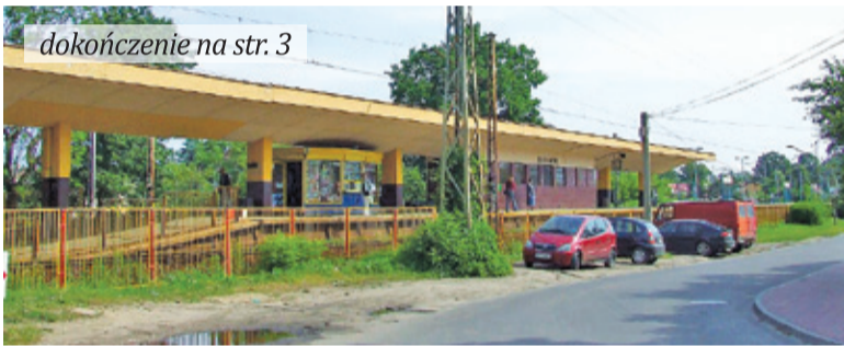
Brwinowski dworzec doczeka się renowacji