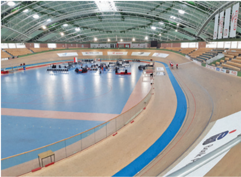
Sytuacja jest więcej niż trudna