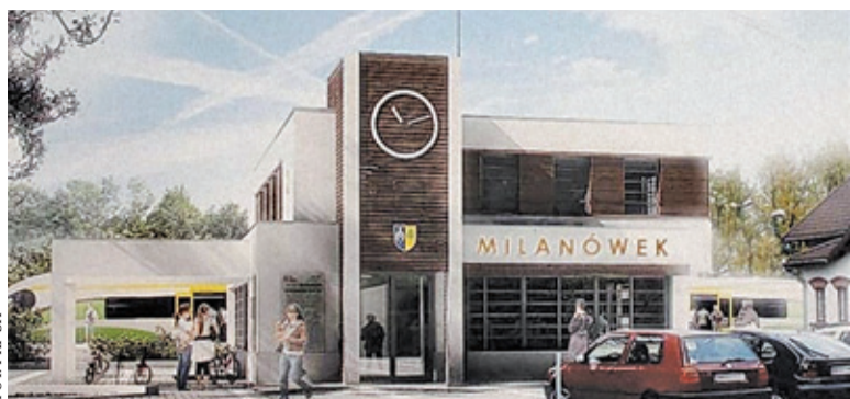
Wizualizacja nowego dworca w Milanówku