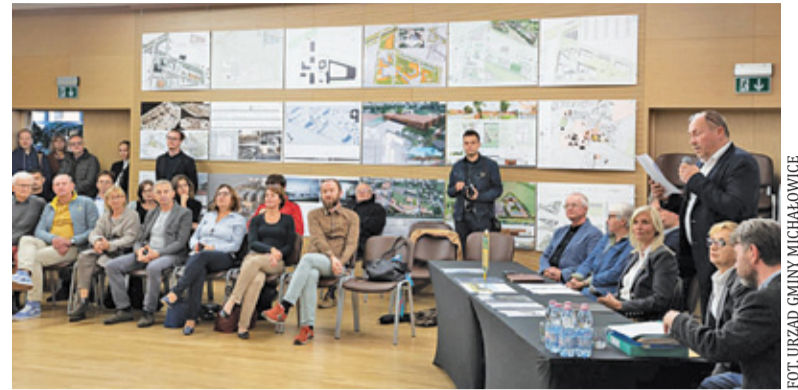
Ogłoszenie wyników konkursu

Gmina Raszyn przygotowuje się do drugiego etapu prac konserwatorskich na Reducie Raszyńskiej, która upamiętnia bitwę pod Raszynem. Mieszkańcy oddali hołd tym, którzy walczyli z korpusem austriackim. W 1828 roku przy ówczesnym Nowym Trakcie pojawiła się kamienna figura Matki