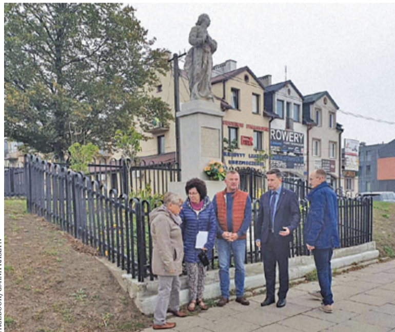
Czas na drugi etap konserwacji

N iezwykle ważna jest troska o miejsca pamięci, które są symbolem ważnych wydarzeń historycznych. To nasze dziedzictwo i zarazem zobowiązanie. Przy pomnikach historycznych odbywają się uroczystości patriotyczne, są one także istotne dla turystów, którzy poznają historię danej miejscowości.