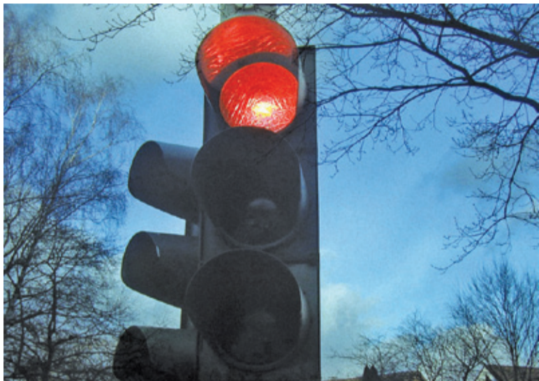
Zbyt szybka jazda zaowocuje zmianą światła na czerwone