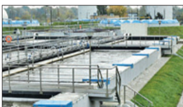
||| Grodzisk Mazowiecki – Farma prądu s. 4