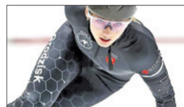
||| Sport – Jedzie na igrzyska s. 6