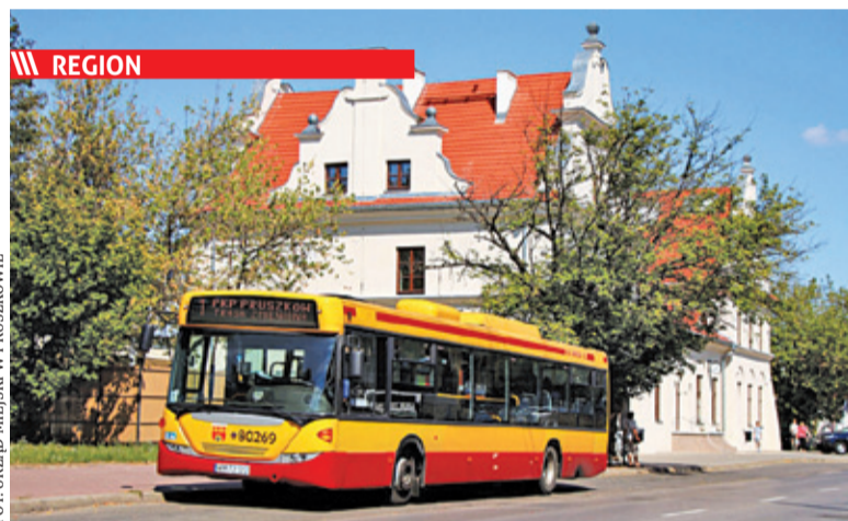
W Pruszkowie będą kursowały linie C1 i C2