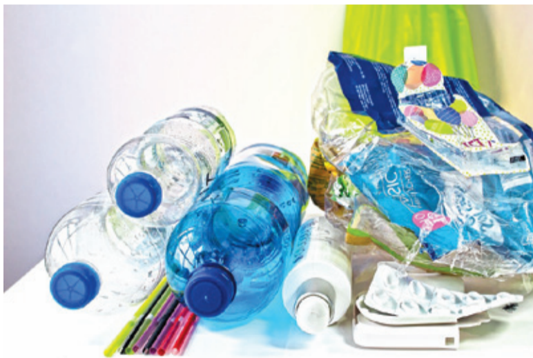
Mieszkańcy będą segregować odpady na pięć frakcji