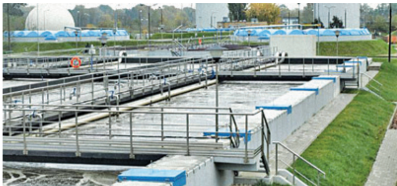
Farma ma pokrywać połowę zapotrzebowania na prąd oczyszczalni