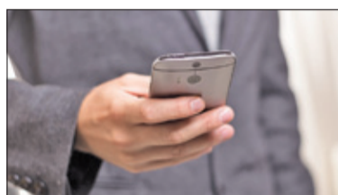
||| Michałowice – System powiadamiania s. 2