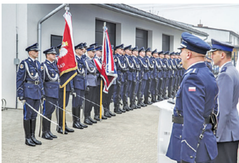
Uroczystość miała podniosły charakter