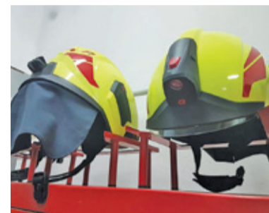
W poprzedniej edycji udało się m.in. doposażyć OSP w hełmy i mundury

parku Zielony Dołek w leżaki i hamaki miejskie. Dziewiąty pomysł dotyczy zakupu wyposażenia dla OSP – chodzi tu m.in. o kamerę termowizyjną, latarki czy drabinę nasadkową. Propozycja nr 10 zakłada budowę stref do gry w tenisa i 5 pokrewnych dyscyplin. Strefy miałyby powstać w okolicach szkół lub przy Orliku. Projekt 11 to Kaczkomat,