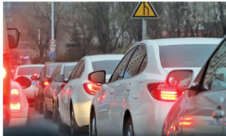
Nowa obwodnica pozwoli rozładować ruch w mieście i ułatwić dojazd do A2

konieczności budowy obwodnicy miasta mówi się od lat. Sprawa napotykała szereg problemów. W połowie ubiegłego roku do ministerstwa wpłynęło sześć odwołań od decyzji o budowie drogi. Skargi dotyczyły przede wszystkim możliwości zabudowy działek i dostępu do drogi publicznej. Po długich negocjacjach udało się dojść do porozumienia z autorami odwołań i procedury mogły ruszyć od nowa. We wrześniu 2018 r. pojawiło się światelko w tunelu – udało się uzyskać Zgodę na Realizację Inwestycji Drogowej (ZRID). Ten dokument teoretycznie powinien dać podstawy do ogłoszenia przetargu