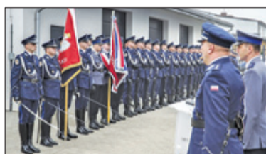
||| Raszyn – Nowy komisariat otwarty s. 3