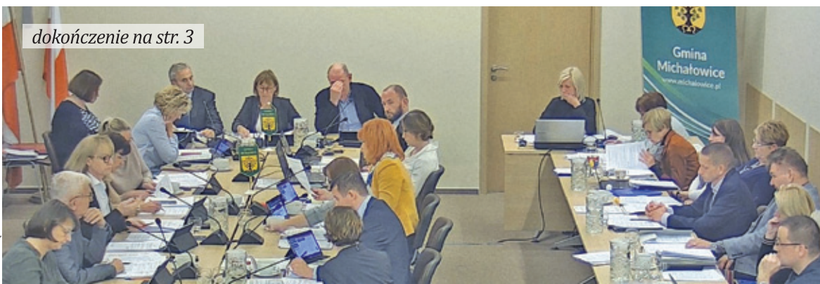
dokończenie na str. 3

ka, radni przyjęli zmiany do budżetu pozwalające na uruchomienie dwóch linii. Pierwsza z nich to M1, która ma połączyć Sokołów i Ursus PKP. Planowana trasa: Ursus PKP, Regulska, Aleja Powstańców Warszawy, Parkowa, ks. Woźniaka, Sąsiedzka/Rodzina, Sokołów. Powrót ulicami Parkową i Sokołowską.