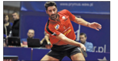
||| Sport - Bogoria w ćwierćfinale s. 6