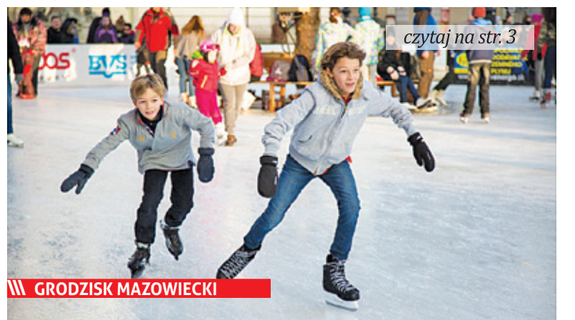
czytaj na str. 3