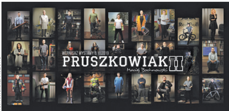
Nowa wystawa będzie liczyła 18 zdjęć