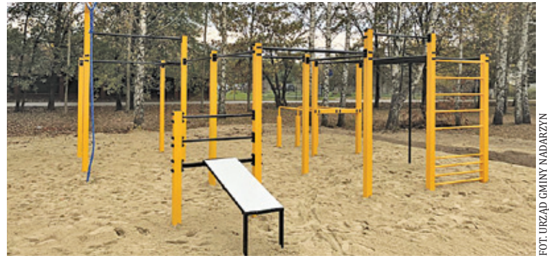
Urządzenia na flowparku służą treningom kalistenicznym