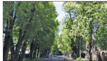
||| Komorów - Jesienne porządki s. 4