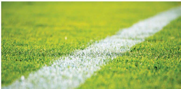
Pogoń na własnym terenie nie wypada najlepiej