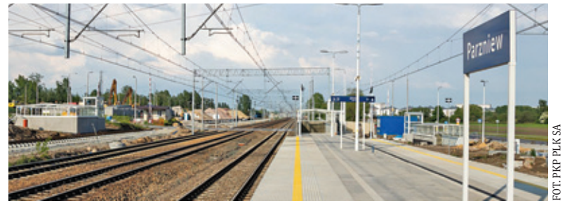
Instalacja SDIP to element trwającej od 2017 r. modernizacji linii 447