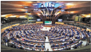
||| Podkowa Leśna - Tusiński został delegatem s. 2