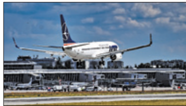
||| Region - Za głośno lądują? s. 2