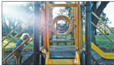
||| Pruszków - Ogród za 500 tysięcy s. 4