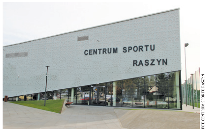
Centrum Sportu Raszyn