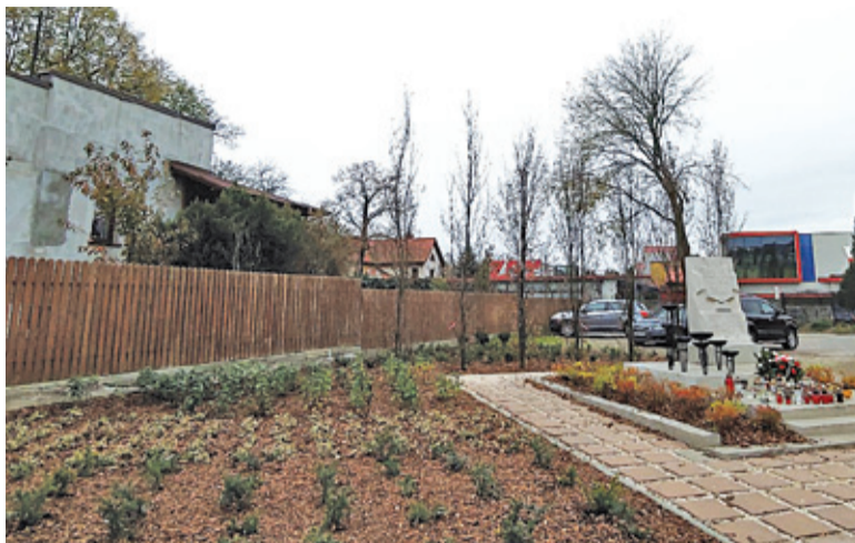
Miejsce pamięci o żołnierzach Wojska Polskiego