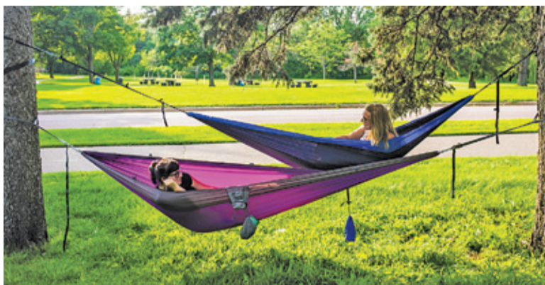
Wśród wybranych projektów znalazł się pomysł zakupu hamaków miejskich do Zielonego Dołka