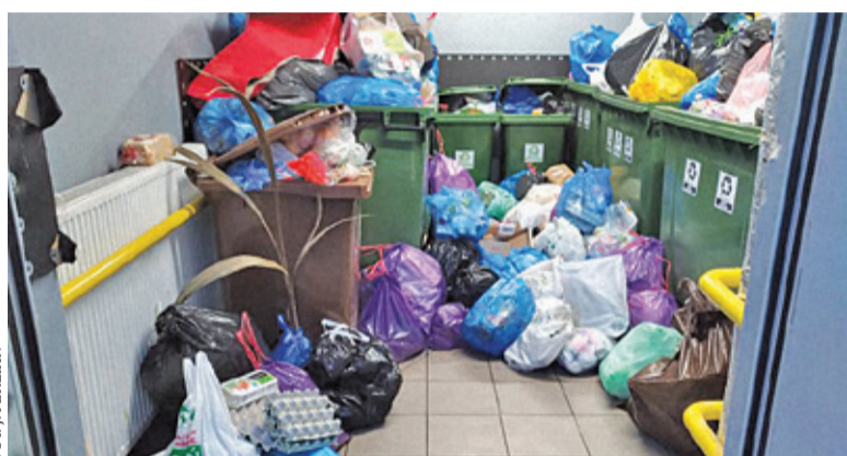
Stawki wzrosną od nowego roku