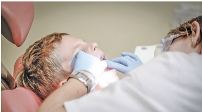
Wszystkie wizyty dzieci i młodzieży będą bezpłatne