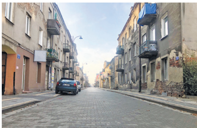
Ulica Stalowa jest bardzo ważnym ciągiem komunikacyjnym