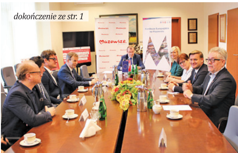
Spotkanie władarzy odbyło się 18 listopada

18 listopada w urzędzie marszałkowskim władze Michałowic, Pruszkowa, Grodziska, Milanówka, Sulejówka i Żyrardowa podpisali umowę na budo-