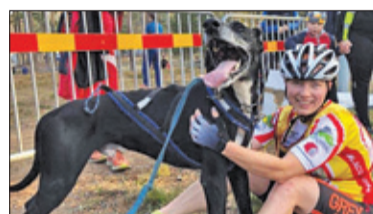
||| Sport - Medale w psich zaprzęgach s. 6