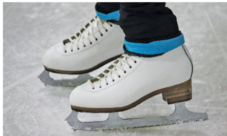
Lodowisko powinno być gotowe najpóźniej 6 grudnia

Korzystanie z lodowiska tradycyjnie będzie bezpłatne, zaś wypożyczenie łyżew będzie kosztować złotówkę. Można będzie także wypożyczyć dodatkowy sprzęt, jak kaski czy chodziki do nauki