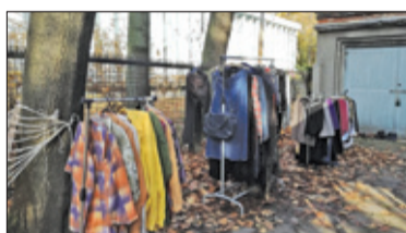
||| Pruszków - Wymiana ciepła s. 4