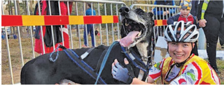
Po wyścigu na twarzy pojawia się uśmiech