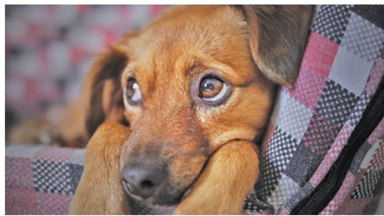
Lokatorzy milanowskiego schroniska liczą na naszą pomoc