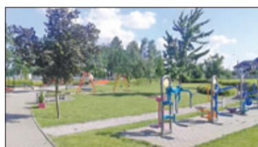
||| Raszyn - Park czekają zmiany s. 0