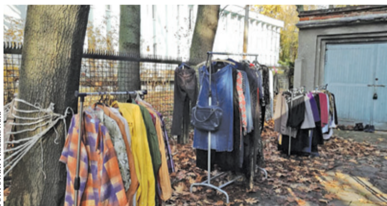
Następna Wymiana Ciepła 14 grudnia