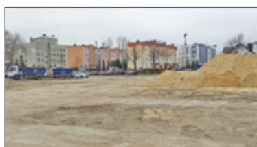
||| Grodzisk Mazowiecki - Umowa już za chwilę s. 2