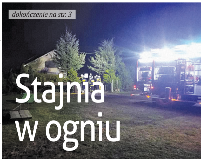
Strażacy rozpoczęli akcję od obrony sąsiadującego z płonącej stajnią domu mieszkalnego