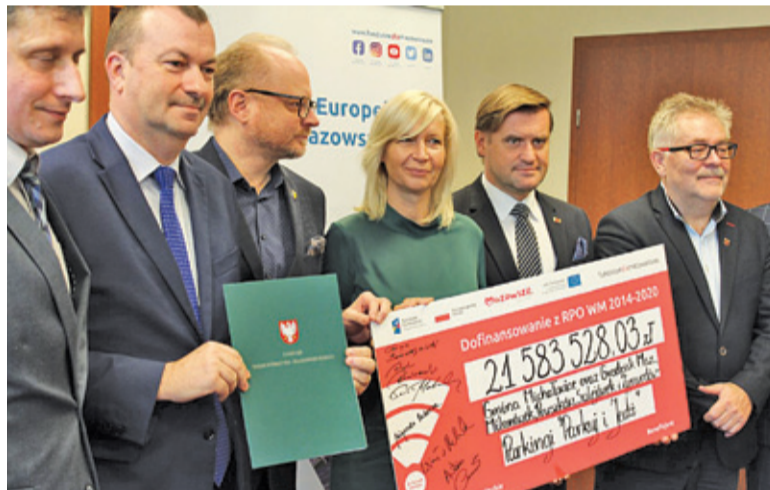
Pozyskano ponad 21 mln zł

Od pewnego czasu obserwujemy rozwój infrastruktury w regionie w postaci budowy parkingów. Działanie ma na celu zachęcenie mieszkańców do zostawiania samochodów i korzystania z komunikacji autobusowej czy też pociągów. Jednocześnie realizowane projekty wiążą się z troską o poprawę jakości powietrza i ograniczenia emisji zanieczyszczeń. W tym roku w sąsiedztwie przystanku WKD Reguły i Urzędu Gminy Michałowice powstał Park&Ride dla 114 samochodów. Również w Pruszkowie, w poprzednim