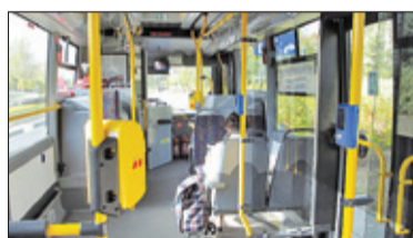
||| Brwinów - Operator bez zmian s. 5