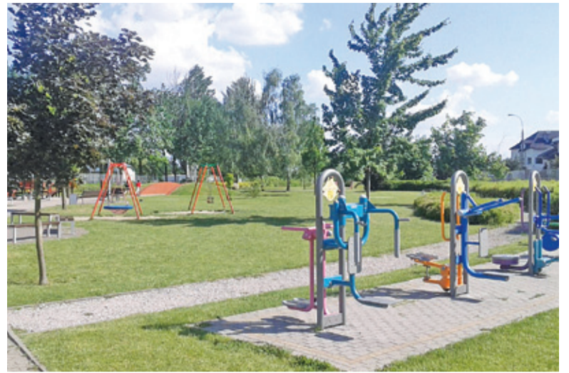
Gmina podpisała umowę z wykonawcą