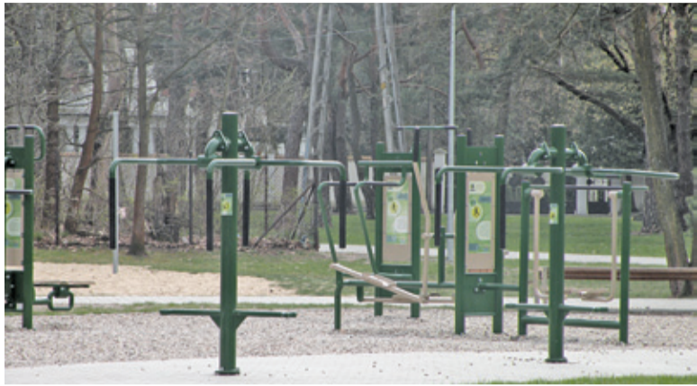
Siłownia plenerowa staną w Bartoszówce, Józefinie i Żelechowie