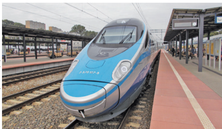
Do zderzenia samochodów z rozpędzonym pendolino zabrakło dosłownie kilku centymetrów