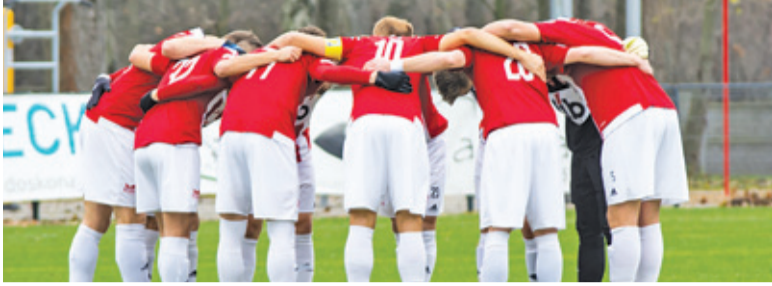
Pogoń zakończyła rundę na 13. miejscu