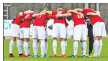
||| Sport – Koniec rundy s. 6