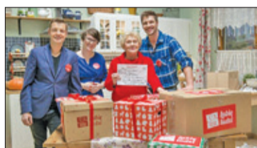
||| Region – Bądź szlachetny s. 5