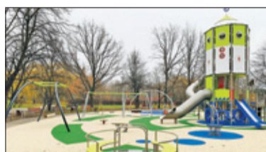
||| Pruszków – Plac zabaw wart milion s. 2