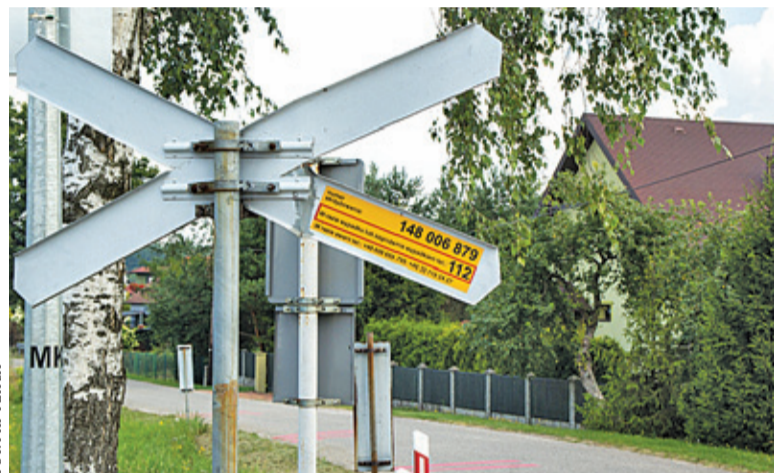
Dzięki obecnej na przejazdach żółtej naklejce już wielokrotnie udało się zapobiec tragedii

W ubiegłym roku spółka PKP PLK oznakowała wszystkie przejazdy kolejowe żółtymi naklejkami, zawierającymi informacje ratujące życie. Na każdej nalepce podany jest indywidualny numer przejazdu, numer alarmowy i numery telefonów do służb technicznych. Jeśli