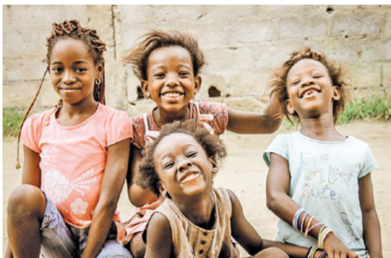
Dzieci z Afryki mają utrudniony dostęp do edukacji