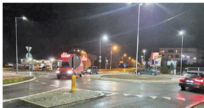
W miniony piątek kierowcy mogli wreszcie skorzystać z ronda