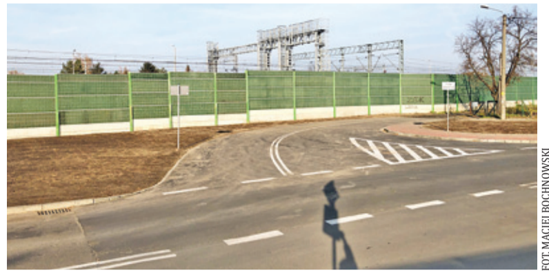
Obecnie trwają prace nad dokumentacją projektową