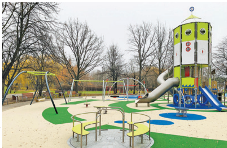
Na placu zabaw zamontowano 29 urządzeń

Minęły dwa miesiące, efekty są widoczne. Plac zabaw został odebrany i jest dostępny dla dzieci, które mogą korzystać z szeregu atrakcji. Wylano bezpieczną nawierzchnię, zamontowano 29 urządzeń zabawowych, w tym huśtawki łańcuchowe i wagowe, statek