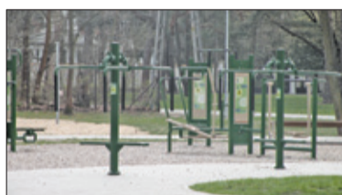
||| Żabia Wola – Relaks zbyt drogi s. 2