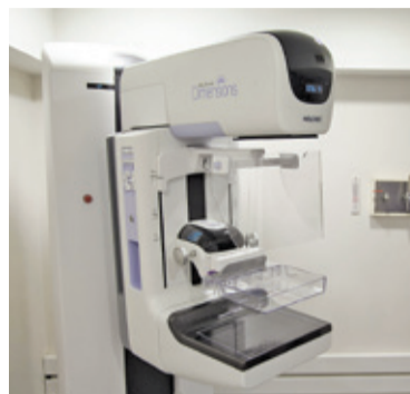
Nie trzeba mieć skierowania lekarskiego

minut. Podczas badania pierś zostaje ułożona na stoliku aparatu i dociśnięta do urządzenia. Zdjęcia oceniane są przez lekarzy radiologów. Jeśli wynik badania nakazuje przeprowadzenie dogłębnej diagnostyki, Pacjentka może