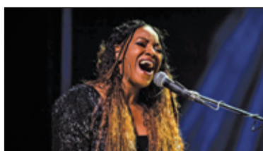
||| Grodzisk Mazowiecki – Muzyka daje siłę s. 4