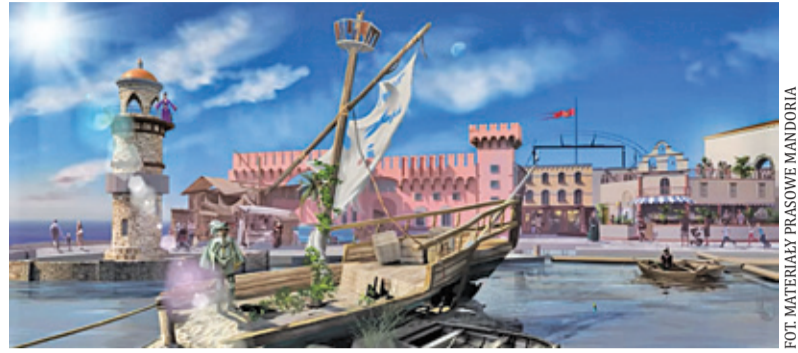
Jedna z wizualizacji ukazuje wrak i latarnię morską – atrakcje parku rozrywki

– Przekraczając bramy Mandorii nasi goście zapomną o rutynie, pracy,