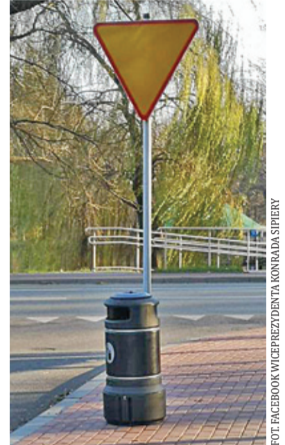
Kosze zamontowano na ul. Stalowej i ul. Miry Zimińskiej-Sygietyńskiej

Wszystko wskazuje, że elementy małej infrastruktury pojawią się na