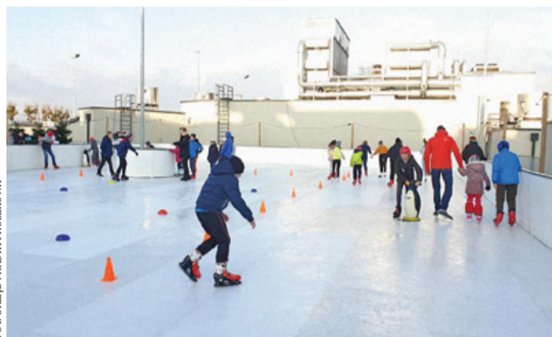
Lodowisko zostało otwarte 14 grudnia

Na lodowisku będzie również animator dla dzieci. Dzięki temu nie zabraknie atrakcji i zabaw dla najmłodszych. Animacje będą odbywały się w każdą sobotę i niedzielę w godzinach