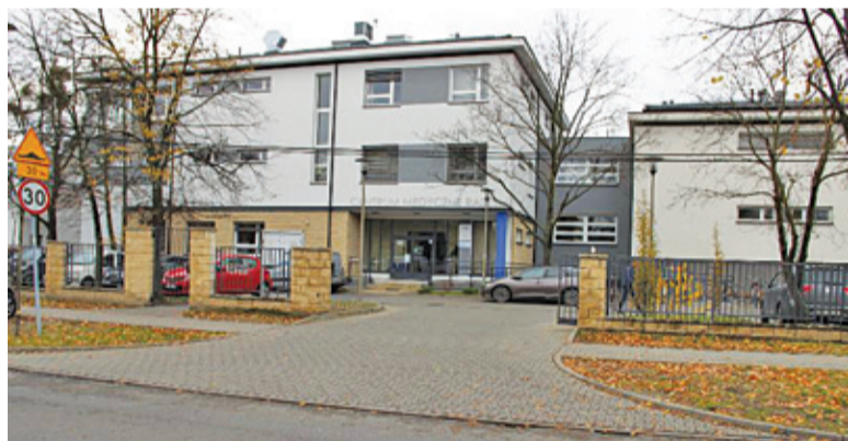
Zgodnie z wyrokiem sądu placówka ma trafić w zarząd stolicy