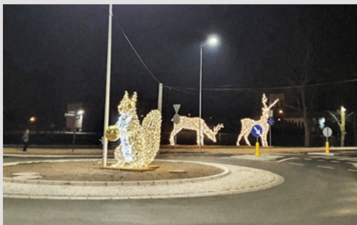
Rondo na ul. Biskupickiej odwiedził cały zwierzyniec

AUTOR: KAROLINA HOFMAN