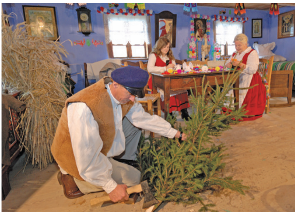
W Wigilię każdy miał określone zadania. Gospodarz przynosił choinkę, kobiety przygotowywały kolację, a dzieci wykonywały ozdoby