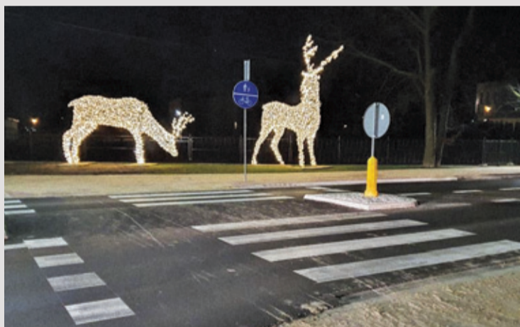
Renifery zatrzymały się przy Biskupickiej na krótki popas, zanim przyjdzie czas zaprzęgać mikołajowe sanie...

W Brwinowie i Pruszkowie stanęły rozświetlone konstrukcje.