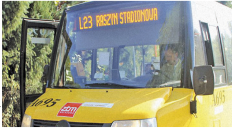
L23 funkcjonowało przez pięć lat

Każdego dnia z komunikacji autobusowej korzystają tysiące osób. Również na poziomie lokalnym. Tymczasem z transportowej mapy Raszyna zniknie linia L23. Z jej usług można korzystać jeszcze do końca roku. Autobus zaczął funkcjonować 1 września 2014 roku i od początku łączył gminę Raszyn z Pruszkowem. Dzięki temu mieszkańcy mogli bez problemu dotrzeć do pracy, starostwa, sądu czy punktów usługowych, a młodzież dojechać do szkół. Początkowo L23 jeździł przez al. Krakowską, Sokołów i Pęcice. Rok później trasa linii została rozszerzona o Nowy Sękocin, Laszczki, Falenty Duże i Falenty. L23 realizowało kursy przez cały tydzień, z mniejszym natężeniem w weekendy.