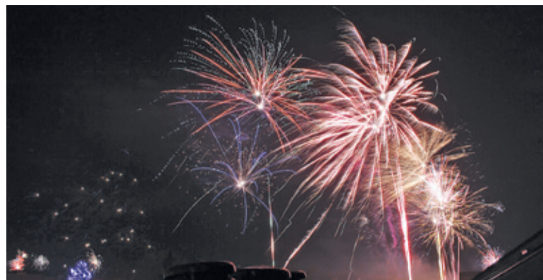
Coraz więcej miast rezygnuje z hucznych wystrzałów

Coraz więcej samorządów decyduje się na rezygnację z pokazów pirotechnicznych podczas miejskich imprez. Kilka miesięcy temu w Pruszkowie i Grodzisku Maz. przeprowadzono ankiety, w których mieszkańcy wyrazili sprzeciw wobec stosowania fajerwerków. Wobec takiej postawy, władze obu miast postanowiły, że tegoroczne miejskie sylwestry odbędą się bez