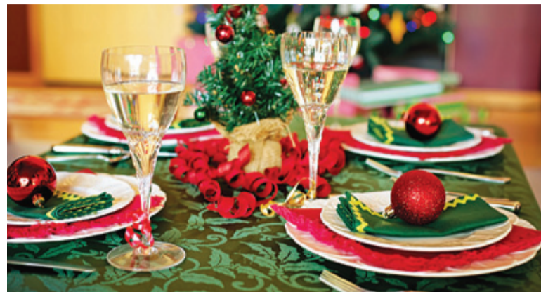
Organizatorzy zapraszają wszystkich mieszkańców i obiecują prawdziwie świąteczną atmosferę