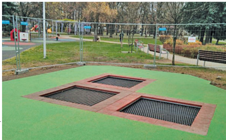
Trampoliny zainstalowano od strony ul. Chopina

Kilka tygodni temu władze Pruszkowa oddały do użytku nowoczesny plac zabaw w parku Anielin Wschodni. Zamontowano 29 urządzeń zabawowych, a koszt całej inwestycji to blisko 990 tys.