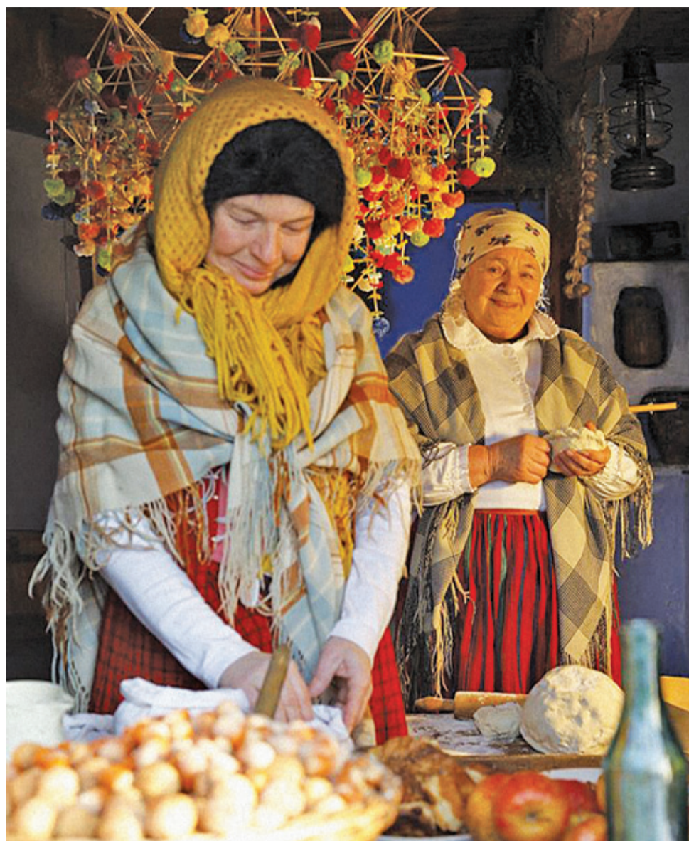
Na bożonarodzeniowych stołach królowały postne potrawy