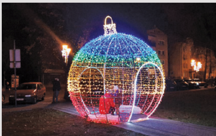
Jeśli bombka jest tak wielka, pomyślcie, z jakiej choinki musiała spaść! Ulica Kraszewskiego w Pruszkowie