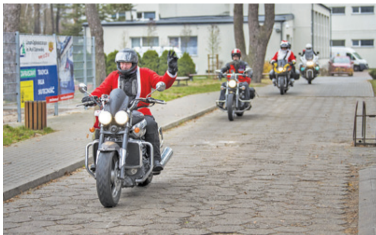
Podczas wydarzenia panowała miła atmosfera

Czas płynął jednak nieubłaganie i Moto-Mikołaje ruszyli w dalszą drogę. Następnymi punktami na trasie podróży były świetlice w Regułach i Opaczkowie, kawiarnia w Michałowicach, orlik w Sokołowie, świetlice w Suchym