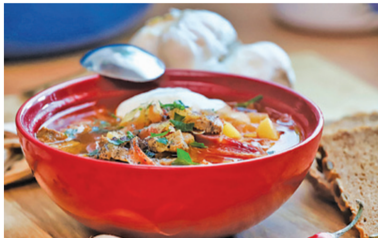
Zbiórka będzie trwała do 20.15

26 grudnia w Piastowie odbędzie się akcja „Podziel się posiłkiem z bezdomnymi”. Marnowanie jedzenia nie