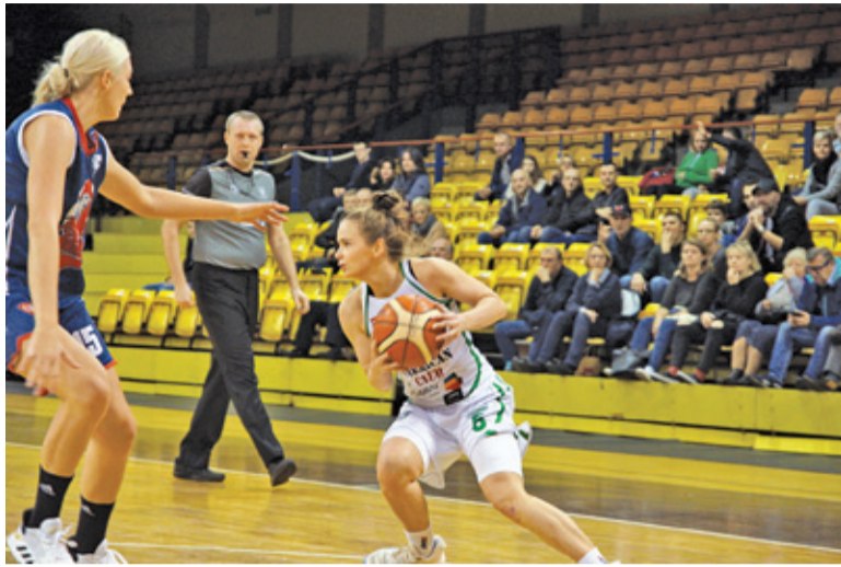
MKS zagra w finale Pucharu Polski w dniach 17-19 stycznia