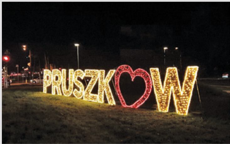
...a Pruszków upewnił się, by Mikołaj z daleka wiedział, gdzie jest