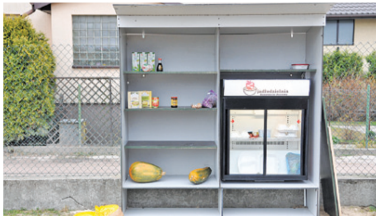
Sieć punktów dzielenia się żywnością regularnie się powiększa

Od niedawna działa także aplikacja na telefon ShareFood43, pozwalająca