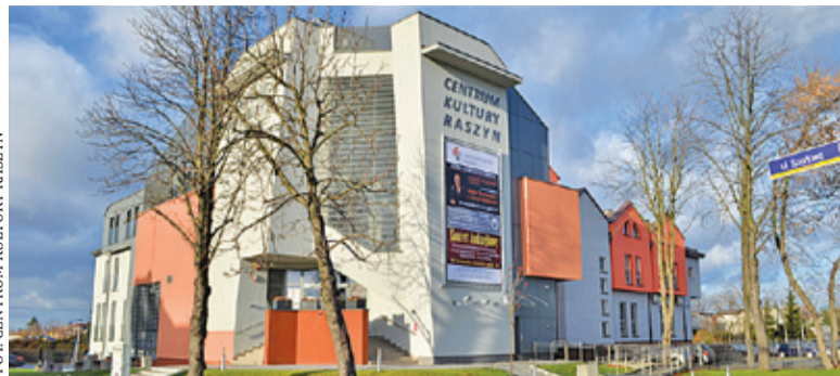
Koncert noworoczny odbędzie się w Centrum Kultury Raszyn