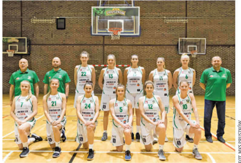
MKS przegrał z CCC 59:95

Koszykarki z Polkowic już w pierwszej kwarcie zbudowały przewagę – 24:11. Z minuty na minutę strata MKS rosła. Na półmetku pruszkowski zespół przegrywał 27:61. W wielu przypadkach zawodniczki czekałyby na koniec rywalizacji. Pruszkowska drużyna podjęła walkę i w trzeciej kwarcie dotrzymała kroku rywalkom. CCC wygrało różnicą tylko czterech punktów, ale MKS nie miał szans na zwycięstwo. Czwar- ta kwarta to dla obu trenerów szansa