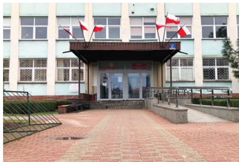
Urząd Gminy Raszyn

Na dodatek firmy drastycznie podniosły ceny, co musiało przełożyć się na stawki dla mieszkańców. Miejski Zakład Oczyszczania zaapelował o podniesienie stawek za odbiór odpadów w Pruszkowie. Umowa z miastem obowiązuje do kwietnia, ale od sierpnia mieszkańcy płacą więcej. Za odpady segregowane jest to 17 zł, zaś za niesegregowane – 28 zł. Wcześniej było to odpowiednio 12 zł i 21 zł. Gorzej sytuacja wygląda w samorządach, którym skończyły się umowy i konieczne było przeprowadzenie postępowań przetargowych. Nie obyło się bez drastycznych podwyżek. Od nowego roku w gminie Michałowice wywóz odpadów segregowanych kosztuje 33 zł, zaś niesegregowanych 66 zł.