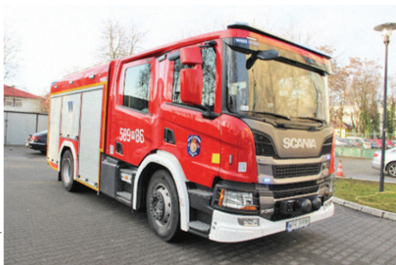
Strażacy mają nowoczesny samochód