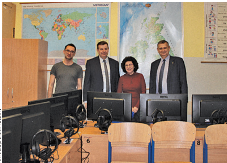
Uczniowie zyskali nowoczesny sprzęt

W procesie edukacji istotną rolę odgrywa zaangażowanie uczniów i nauczycieli, ale także warunki oraz dostęp do pomocy naukowych. Szkoła posiadająca nowoczesny sprzęt może w ciekawy sposób przekazywać