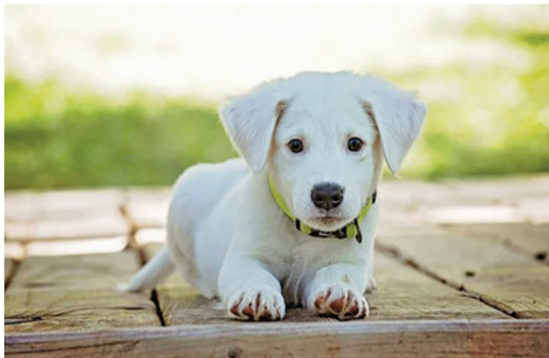
Zbiórka jest prowadzona w liceum T. Zana

Niejednokrotnie na ulicy mijamy porzucone psy i koty. Służby je odławiają i przekazują do schroniska, gdzie zwierzęta czekają na kogoś, kto