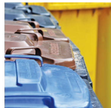
Sprawa budowy PSZOK w Milanówku ciągnie się już od kilku lat

Projekt PSZOK zakłada stworzenie obiektu składającego się z kontenera socjalno-biurowego, magazynu na elektrośmieci i tzw. odpady niebezpieczne oraz wiaty do zbierania śmieci wiel-