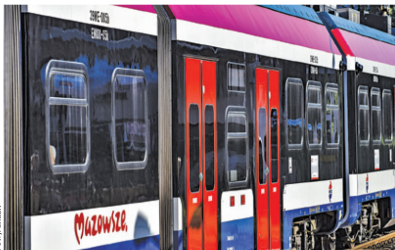
Miniony rok był rekordowy dla WKD – z usług przewoźnika skorzystało blisko 8,8 mln pasażerów