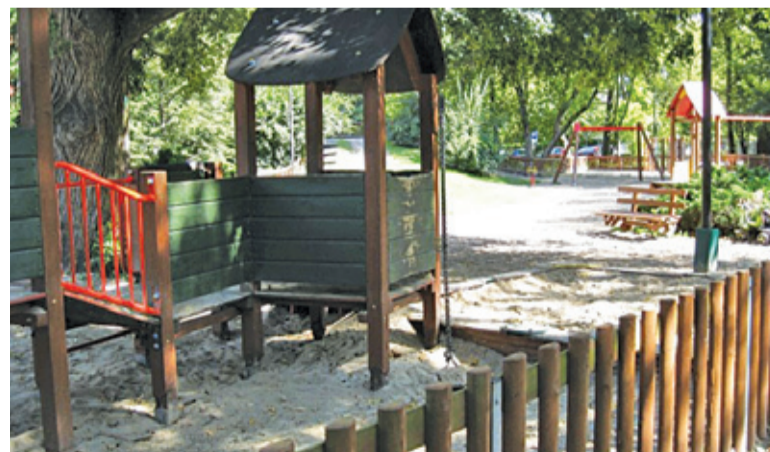
Rewitalizację rozpoczęto od placu zabaw

Wymiana urządzeń to pierwszy etap szerszej rewitalizacji, którą magistrat zapowiadał jesienią ubiegłego roku. Wcześniej udało się zainstalować na