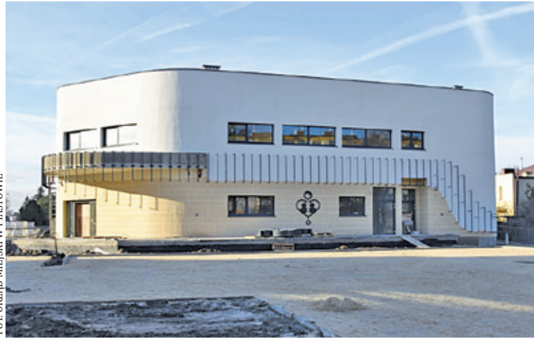
Dotacja i pożyczka pochodzą z NFOŚiGW

P iaستowski samorząd chce zapewnić mieszkańcom najwyższy standard usług medycznych oraz dogodne wa-