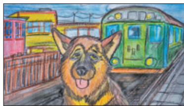
||| Pruszków – 1000 nowych książek s. 4