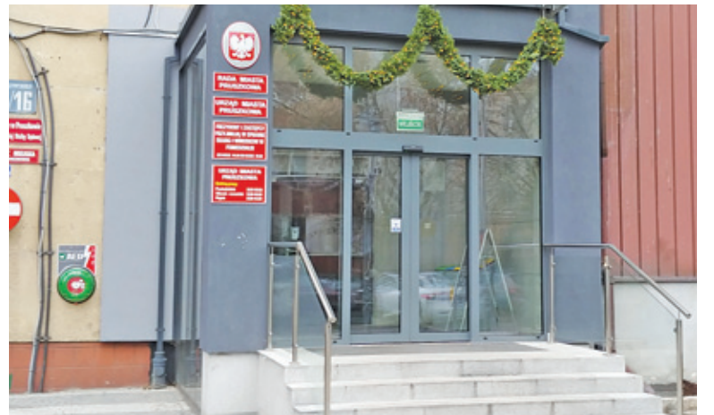
Wnioski należy składać w kancelarii urzędu

sowanie w wysokości 75% poniesionych kosztów, ale nie więcej niż 8 tys. zł. Warunkiem jest likwidacja pieca węglowego i zastąpienie go urządzeniem opalonym gazem, paliwem olejowym lub biomasą. O dotację mogą ubiegać się również osoby, które chcą zastąpić dotychczasowy kocioł piecem nowszej generacji. Należy zaznaczyć, że pierwszeństwo będą miały inwestycje związane z likwidacją pieców węglowych.