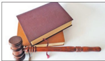
||| Michałowice – Prawnik pierwszego kontaktu s. 4