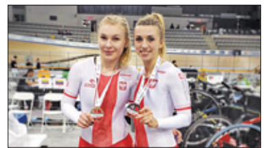
||| Sport – Kanadyjskie srebro s. 6