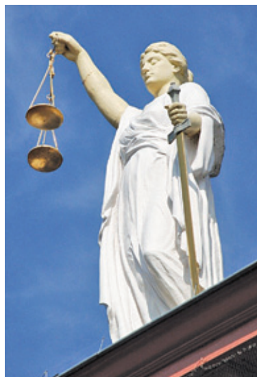
Radni oskarżają wójta o popełnienie przestępstwa

przy ul. Poniatowskiego 18a przez lata poruszała raszyńską społeczność. Wszystko przez standard obsługi oraz zły stan samego budynku. Pacjenci mieli problem, żeby zapisać się do specjalisty. Tworzyły się kolejki, w których lu-