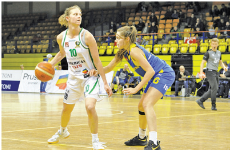
Pruszkowski klub w tym sezonie budzi postrach wśród rywali

października w starciu z SMS PZKosz Łomianki – 73:86. MKS sieje postrach na I-ligowych parkietach i wysoko pokonuje kolejnych rywali. Pruszkowski zespół wygrał m.in. z Arką II Gdynia