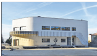
||| Piastów – Przychodnia z dotacją s. 2