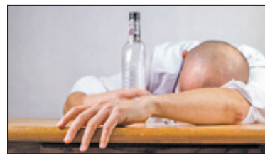
||| Powiat Pruszkowski – Izba wytrzeźwień s. 5