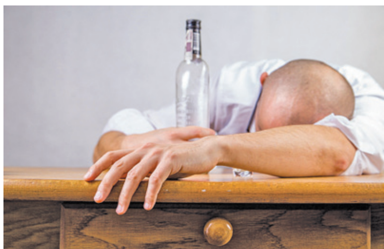
Samorządowcy chcą utworzenia izby wytrzeźwień

Jak widać, działania w sprawie uruchomienia placówki są zaawansowane. Izba wytrzeźwień prawdopodobnie będzie działać w jednym z lokali na terenie szpitala w Tworkach. – Nasze działania