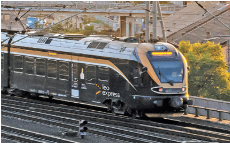
Połączenie Terespol – Praga to kolejny element ekspansji czeskiego operatora w Polsce