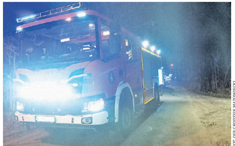
Do wybuchu doszło o trzeciej nad ranem (zdjęcie ilustracyjne)