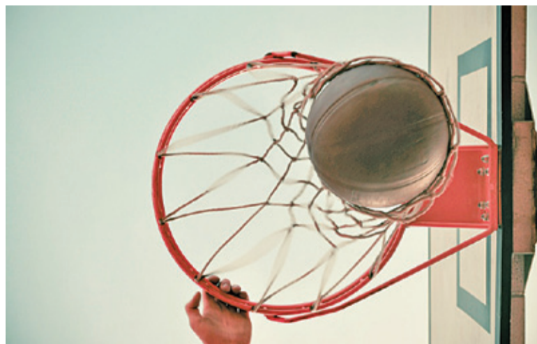
To jedenasta porażka Elektrobudu w tym sezonie