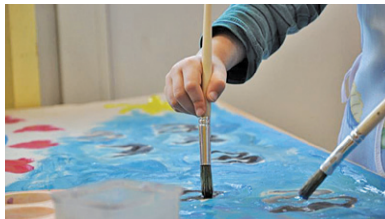
W CK przy ul. Spółdzielczej na dzieci czekają m.in. zajęcia plastyczne

Centrum Kultury w Grodzisku Maz. oferuje tygodniowe turnusy zajęć dla dzieci od 6 do 13 lat, z podziałem na grupy wiekowe. W pierwszym tygodniu w salach budynku przy ul. Spółdzielczej na młodzież czekają m.in. warsztaty taneczne, plastyczne czy taekwondo. Drugi tydzień upłynie pod znakiem gier planszowych, szermierki i zumbi. Wszystkie spotkania są bezpłatne, należy jednak pamiętać, że możemy zapisać dziecko tylko na jeden tydzień zajęć.