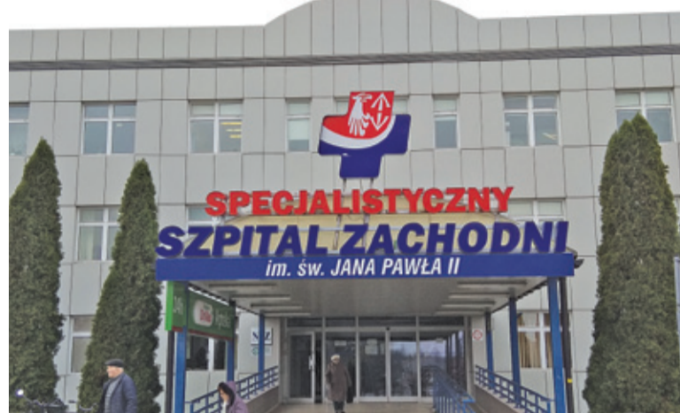
Pacjent żądający specjalnej opieki został przetransportowany karetką do szpitala zakaźnego