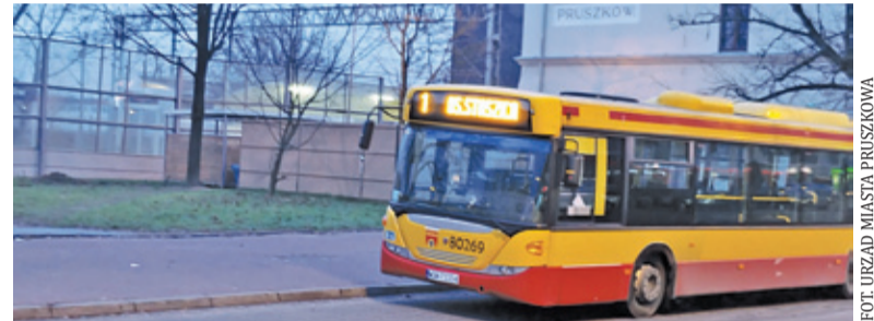
Zmiany zaczną obowiązywać od 1 lipca

Nie da się ukryć, że darmowy transport brzmi kusząco. Aby można było korzystać z tej opcji, należy posiadać Pruszkowską Kartę Mieszkańca. Można ją wyrobić w Urzędzie Miasta w pokoju nr 14 bądź drogą elektroniczną: https://pruszkow.informica.pl/ . Trzeba jednak spełnić dwa warunki: mieszkać na terenie Pruszkowa oraz rozliczać podatek dochodowy w tutejszym urzędzie. Pasażerowie, którzy nie mają PKM, będą musieli kupować bilety. Za jednorazowy zapłacą 4 zł, za ulgowy 2 zł. Bilet miesięczny to koszt 120 zł (ulgowy – 60 zł). Przewóz wózka dziecięcego, roweru, bagażu i zwierząt będzie bezpłatny.