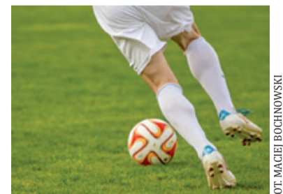
W Pruszkowie Lechia nie miała zbyt wiele do powiedzenia

Wysoka wygrana piłkarzy Znicza Pruszków w spotkaniu sparingowym. Żółto-czerwoni pokonali Lechię Tomaszów Mazowiecki 5:1.