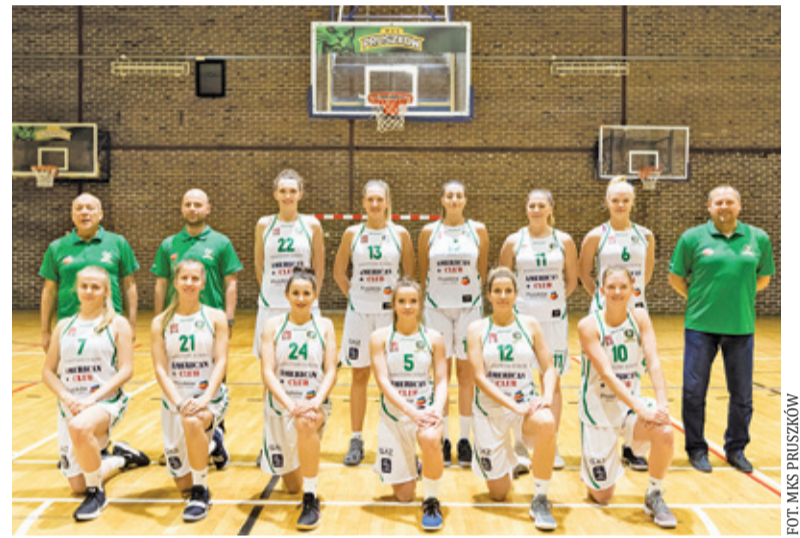
MKS pokonał Politechnikę 88:49

MKS przewodzi ligowej stawce z dorobkiem 27 punktów. Za plecami ma Arkę II Gdynia – 26 oczek i SKK Polonię Warszawa – 22. Kolejne spotkanie ekipa z Pruszkowa rozegra 15 lutego o godz. 16.00. Rywalem będzie KKS Olsztyn.