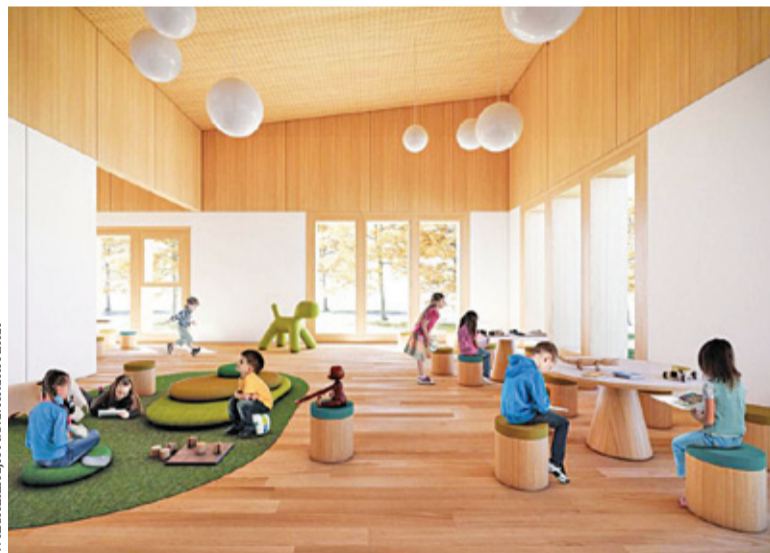
Przedszkole ma liczyć siedem sal edukacyjnych

W ubiegłym roku władze Michałowic, wraz ze Stowarzyszeniem Architektów Polskich, przeprowadziły dwuetapowy konkurs na koncepcję urbanistyczną i przedszkole w Regułach. Pod koniec września jury wyłoniło zwycięzcę. Obecnie samorząd prowadzi kolejne działania zmierzające do rozpoczęcia inwestycji. – Uzgodniona jest koncepcja, która uwzględnia wszystkie zalecenia sądu konkursowego SARP oraz gminy. Obecnie MOC Architekci pracują nad projektem budowlanym. Jesteśmy w kontakcie roboczym – infor-