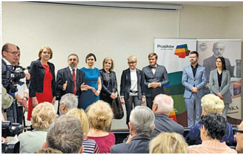
„Przystanek Pruszków” otwarto 31 stycznia