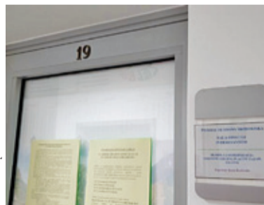
Skorzystanie z pomocy pracownika PGNiG będzie możliwe w drugi i czwarty wtorek miesiąca

Troska o poprawę jakości powietrza jest dla samorządów niezwykle istotna. Mieszkańcy mogą korzystać z różnych programów dofinansowań. Ważne jest również wsparcie informacyjne, które jest dostępne pruszkow-