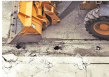
Zakres prac zakłada położenie nowej nawierzchni, ułożenie chodników i wykonanie odwodnienia

w zakładanym budżecie, magistrat planował bowiem przeznaczyć na inwestycję 2 mln zł. Najatrakcyjniejsza okazała się oferta firmy Delta z Warszawy, która zaproponowała najniższą cenę. Wiele wskazuje więc na to, że uda się zaoszczędzić ponad pół miliona złotych.