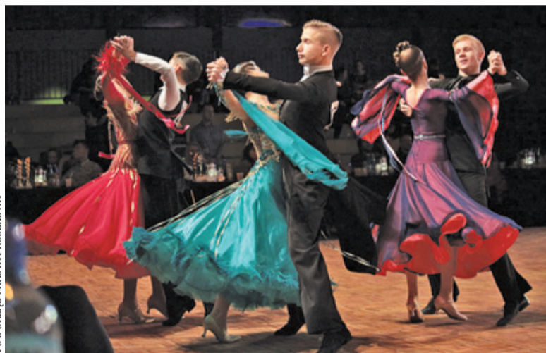
Top Dance Cup 2020

Z kolei miniony weekend upłynął pod znakiem 18. Festiwalu Tańca Mazovia Open 2020. W Szkole Podstawowej nr 10 przy ul. Pływackiej pojawiło się ponad 2000 tancerzy. Dominowała różnorodność, niezwykła oprawa sceniczna oraz wysokie umiejętności zawodniczek i zawodników. Festiwal trwał trzy dni, podczas których każdy mógł odbyć podróż przez różne style. Impreza rozpoczęła się od pokazów uczniów Dance