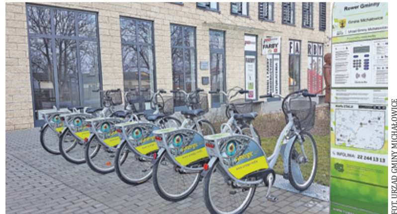
Za kilka tygodni rowery pojawią się na stacjach

Gmina Michałowice rozpoczęła przygotowania do kolejnego sezonu i ogłosiła przetarg na uruchomienie i zarządzanie systemem wypożyczalni rowerów. Planowane jest uruchomienie dziewięciu stacji, które zostaną zlokalizowane przy urzędzie w Regułach, przy stacjach WKD w Opaczy, Micha-