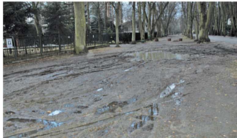
Aleja ma zyskać nową nawierzchnię, częściowo mineralną, a częściowo granitową. Mieszkańcy obawiają się o przyszłość drzew

nansowanie z programu partnerskiego budowy ścieżek rowerowych i rezygnacja z realizacji grozi utratą dotacji nie tylko dla Podkowy, ale również pięciu