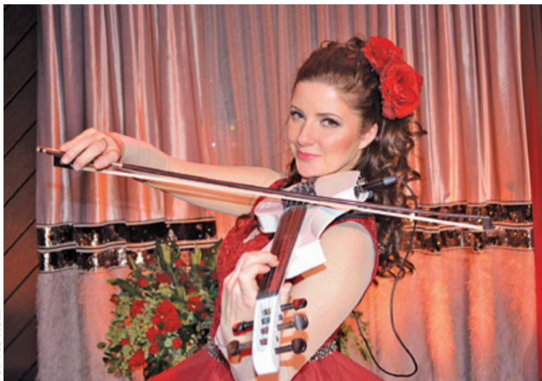
FOT. YLO VIOLIN