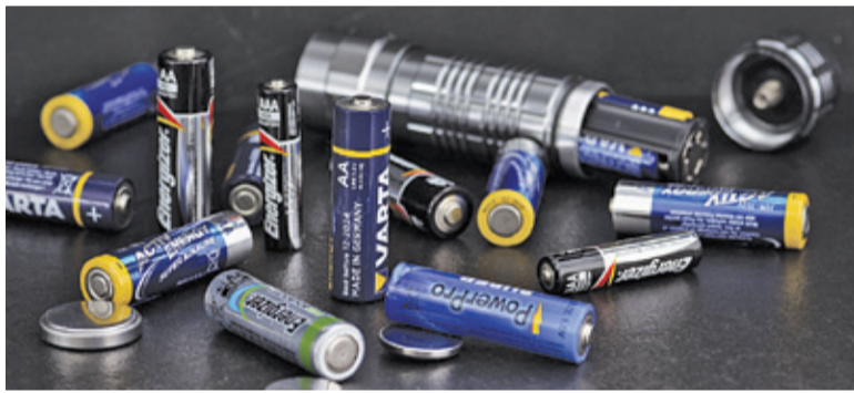
W projekcie bierze udział blisko 1700 dzieci

Troska o stan środowiska jest niezwykle istotna, dlatego ważną rolę odgrywają akcje edukacyjne prowadzone w przedszkolach i szkołach. Dzięki temu dzieci i młodzież zyskują wiedzę dotyczącą ekologii. Do 8 maja w pruszkowskich przedszkolach będzie realizowany projekt „Pruszków wolny od elektroodpadów 2020”. Objętych nim jest blisko 1700 dzieci w wieku 3-6 lat.