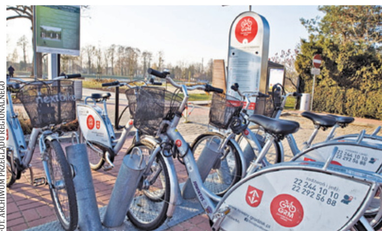
Do dyspozycji mieszkańców są 92 jednoślady, dostępne na 12 stacjach na terenie Grodziska

Podobnie jak w ubiegłym roku, w celu wypożyczenia jednoślada możemy skorzystać z aplikacji mobilnej lub terminala dostępnego na każdej stacji rowerów. Aby skorzystać z Grodzkiego Roweru Miejskiego, należy zarejestrować się w systemie – można to zrobić przez stronę internetową rowery.grodzisk.pl lub za pośrednictwem aplikacji