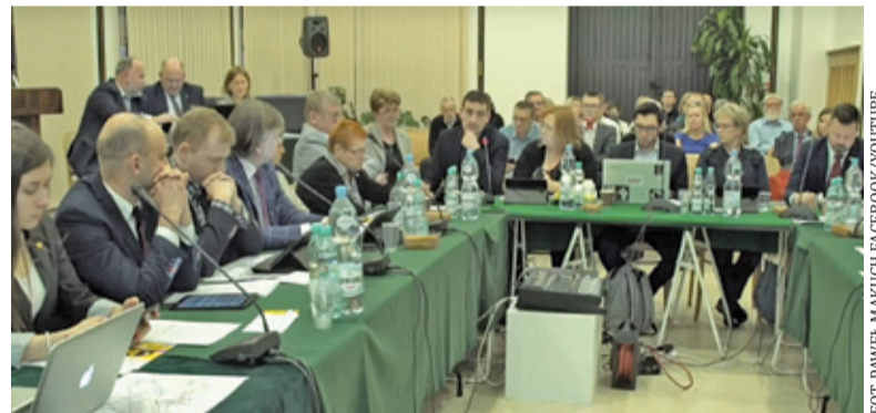
Radni podjęli decyzję o wycofaniu uchwały

W ostatnich tygodniach temat budowy łącznika dróg wojewódzkich nr 701 i 718 był przedmiotem dyskusji władz Pruszkowa i Brwinowa. Strony spierały się na temat projektu i przebiegu łącznika. – W planie zagospodarowania przestrzennego ten łącznik ma szerokość 15 metrów. Pan burmistrz Kosiński zaprojektował tę drogę o szerokości 30 metrów – zwracał uwagę zastępca prezydenta Pruszkowa Konrad Szipera. – Jaki ruch ten łącznik ma obsługiwać? Pytanie