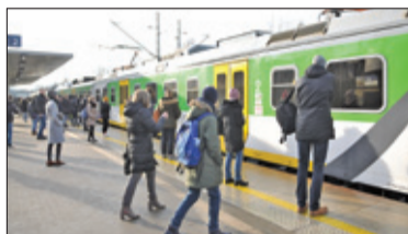
||| Region – Zmiany w rozkładach s. 4