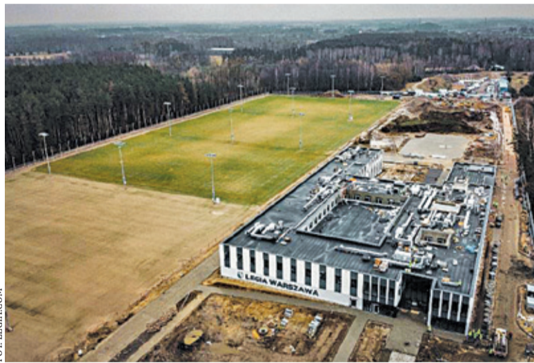
Ośrodek ma być nowoczesnym centrum treningowym dla kadry trenującej w warszawskim klubie

Niedawno klub Legii ogłosił konkurs na nazwę nowej ulicy. W internetowym głosowaniu zwyciężyła nazwa Legionistów. Klub złożył do Rady