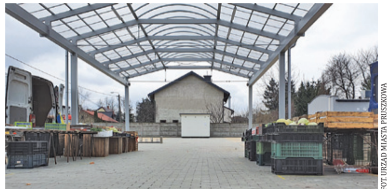
Obraz targowiska uległ znacznej zmianie

W sprawie remontu targowiska mówiono się od dawna. Istotne kroki w tej sprawie poczyniono w 2018 roku. W marcu ogłoszono przetarg w formule „zaprojektuj i wybuduj” na przebudowę targowiska, zaś umowę