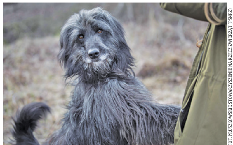
Dzięki pomocy uczniów z pruszkowskiego LO Walenty i jego futrzani koledzy mają zapewnioną dobrą opiekę

Aby jednak stowarzyszenie mogło funkcjonować, niezbędne jest wsparcie z zewnątrz. W pomoc organizacji przyszli uczniowie LO im. Tomasza Zana. Tak narodził się „Rozmerdany pro-