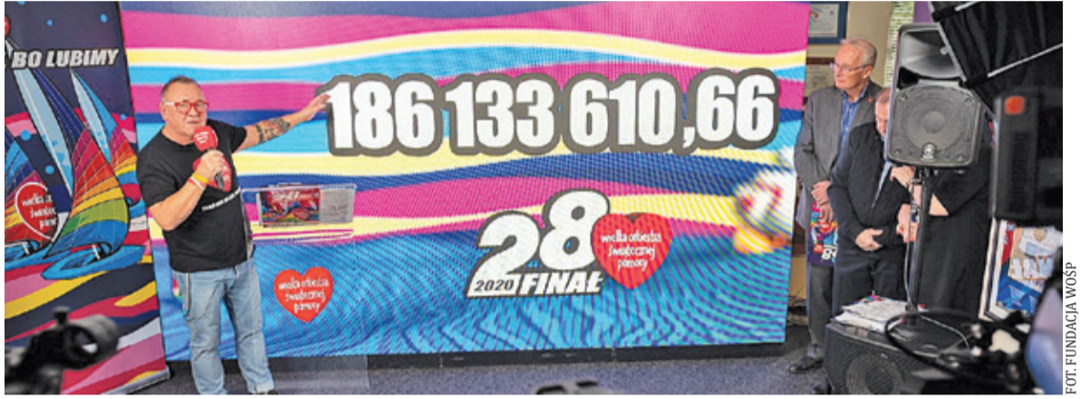
Środki zebrane podczas 28. Finału zasilą dziecięcą medycynę zabiegową

Kwota zadeklarowana w dniu Finału wyniosła bowiem ponad 115 milionów złotych – ponad 23 miliony więcej, niż rok wcześniej. Przeczucia nie zawiodły – znów okazaliśmy wyjątkową szczodrość.