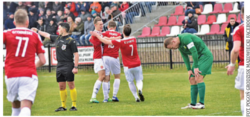
Pogoń pokonała Świt 3:2

Dla grodziszczan każdy mecz jest niezwykle istotny. Pogoń potrzebuje punktów, aby ugruntować swoją pozycję w III lidze i zapewnić sobie utrzyma-