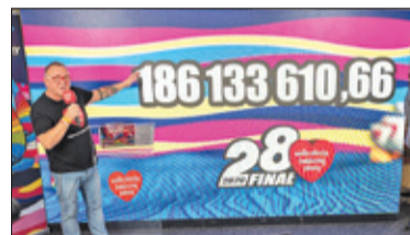
||| Kraj – Rekordowy wiatr w żagle s. 6