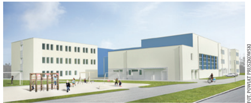
Wizualizacja nowej siedziby ośrodka

Powiat otrzymał dotację w wysokości 4 milionów złotych na budowę nowej siedziby Specjalnego Ośrodka Szkolno-Wychowawczego przy ul. Wapiennej 2 w Pruszkowie. Obiekt ma być gotowy w 2022 roku.