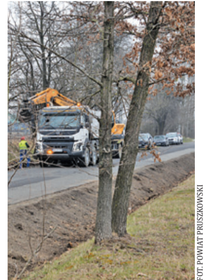
Remont powinien potrwać ok. 2 miesięcy

ul. Solidarności pozostanie zamknięta na odcinku od przejazdu kolejowego do wjazdu na teren centrum handlowego. Nieprzejezdny jest również wyjazd z ul. Wolności. Objazdy wytyczono ulicami