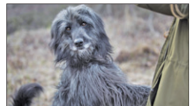
||| Pruszków – Merdające liceum s. 6