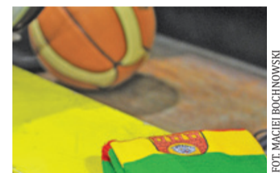
Elektrobud trafił 51,7% rzutów

Wydawać by się mogło, że zespół Andrzeja Kierlewicza zmierza w dobrą stronę. Początek trzeciej kwarty pokazał, że gospodarze muszą mieć się na baczności. Czarni rozpoczęli odrabianie strat – 40:45. Sygnał do pobudki dał Kierlewicz – 48:40. Elektrobud zaczął się rozpędzać, a rywale byli bezradni i popełniali błędy. Pruszkowska drużyna prowadziła już 60:42 i wydawało