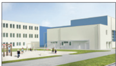
||| Powiat Pruszkowski – 4 miliony na ośrodek s. 2

P R U S Z K Ó W ||| P I A S T Ó W ||| B R W I N Ó W ||| M I C H A Ł O W I C E ||| N A D A R Z Y N ||| R A S Z Y N