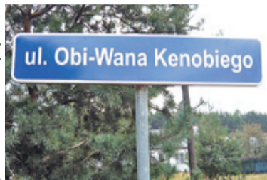
Swoją ulicę w Polsce ma już inny bohater sagi „Gwiezdnych wojen”

Pruszkowscy radni zajęli się sprawą nadania imienia Luke'a Skywalkerera ulicy bądź skwerowi w mieście. Petycję w tej sprawie podpisało ponad 1100 osób.