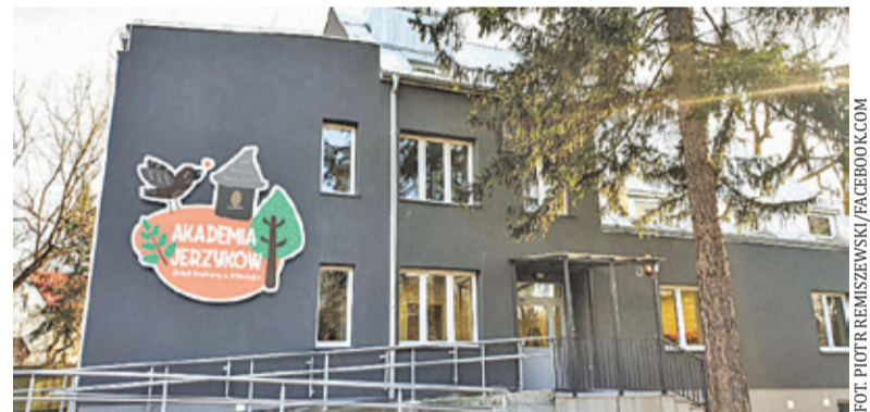
Oficjalne otwarcie placówki nastąpiło 9 marca

Przekształcenie budynku w żłobek stało się możliwe dzięki rządowemu programowi Maluch+, z którego udało się pozyskać dotację w wysokości 1,5 mln zł. W lipcu ubiegłego roku rozstrzygnięto przetarg i wyłoniono wykonawcę przebudowy. W zakres prac wchodziły m.in. wzmocnienia stropów, wyburzenie części ścian działowych, położenie nowych instalacji, przebudowa klatki schodowej i uporządkowanie terenu wokół budynku. Całkowita wartość inwestycji wyniosła 1,85 mln zł.