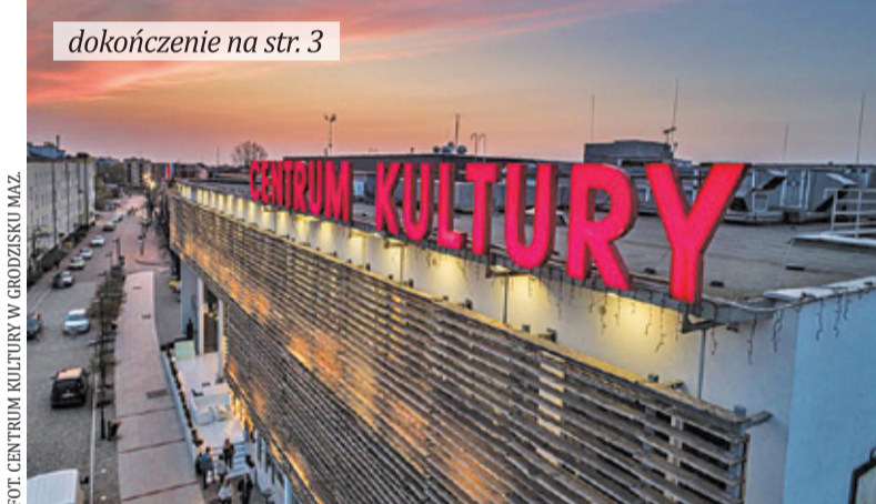
Wojewoda mazowiecki apeluje o odwołanie imprez masowych i unikanie dużych zgromadzeń