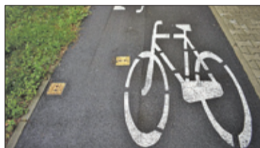
||| Jaktorów – Drogi drogi dla rowerów s. 4