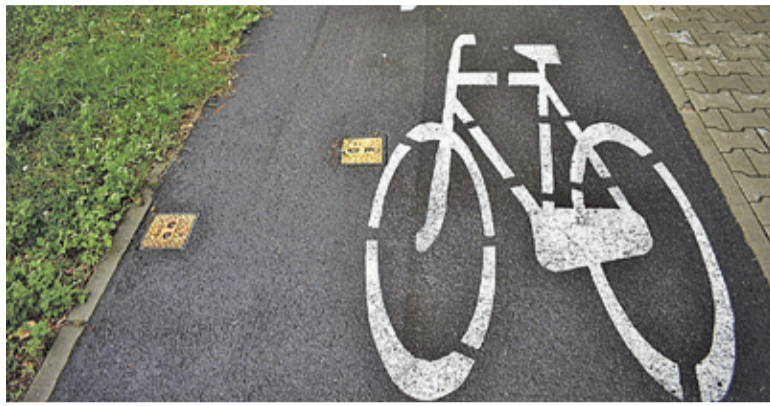
Prace powinny zakończyć się do 30 listopada

sano przetarg na dokończenie rozpoczętych prac. Gmina planowała przeznaczyć na budowę maksymalnie 6,86 mln zł. Tymczasem wszystkie cztery