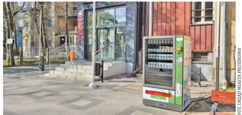
W automacie kupimy m.in. maski i rękawiczki

Od 16 kwietnia wszyscy muszą zasłaniać usta i nos. Nakaz dotyczy wszystkich przebywających w prze-