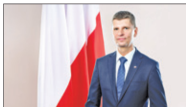
||| Kraj – Do szkół za miesiąc s. 2