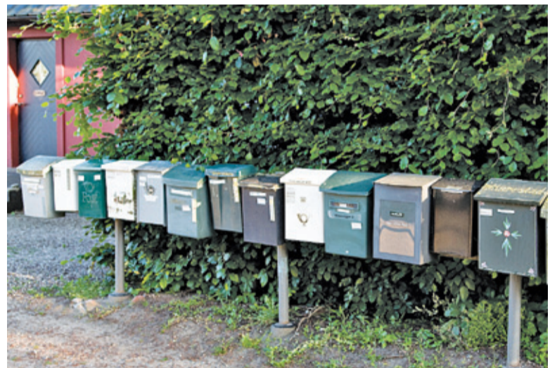
Operator powołał się na ustawę antycovidową z 16 kwietnia

O sprawie wniosku o przekazanie danych operatorowi pocztowemu zrobiło się głośno w czwartek 23 kwietnia. Niektórzy polscy samorządowcy opublikowali na swoich portalach społecznościowych informację o tajemniczym anonimowym mailu, który przyszedł nocą z adresu Poczty Polskiej. W mailu podpisanym „Poczta Polska” wnioskowano o udostępnienie danych osób istniejących w spisie wyborców w danej gminie. Dane te miały zawierać numer PESEL, imiona i nazwisko, dokładny adres. Dane, opracowane w konkretny sposób (sic!), miałyby zostać przesłane w ciągu dwóch dni roboczych w skompresowanym, niezasyfrowanym pliku. Chodzi oczywiście o organizację wyborów korespondencyjnych. Operator powołał się na tzw. ustawę antycovidową z 16 kwietnia. Sprawą