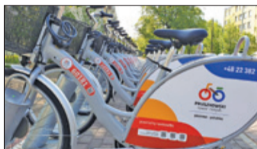
||| Pruszków – Rowerowa integracja s. 4