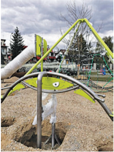
Zabawki już są na terenie

Na tyłach raszyńskiej pływalni znajduje się park, który cieszy się popularnością wśród mieszkańców. Chętnie odwiedzają go dzieci, które korzystają z dostępnych zabawek. Latem można odpocząć na plaży wyposażo-