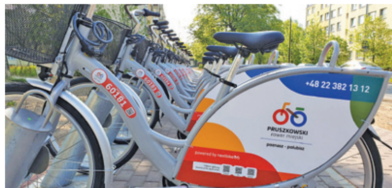
Mieszkańcy Pruszkowa będą mogli korzystać z warszawskich rowerów

W wielu miejscowościach przybywa tras dla cyklistów, rozbudowuje się również niezbędna infrastruktura. Dla mieszkańców Pruszkowa szykuje się kolejne udogodnienie na tym polu. Podczas ostatniej sesji radni zajęli się kwestią wyrażenia zgody na zawarcie przez miasto porozumienia z Warszawą na rzecz integracji systemów: Prusz-