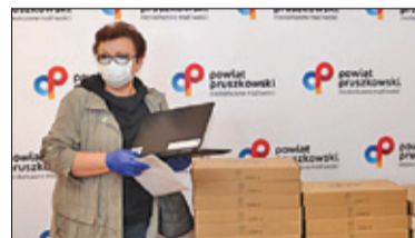
||| Powiat Pruszkowski – Laptopy zostały rozdane s. 5