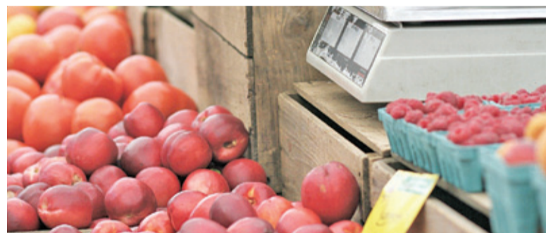
Na grodziskim targowisku kupimy produkty z ograniczonego asortymentu

Na targu przy ul. Montwiłła będą mogli sprzedawać wyłącznie kupcy z powiatu grodziskiego. Asortyment, który będziemy mogli kupić na targu, będzie ograniczony do kilku kategorii: owoce, warzywa, produkty rolne, mięso, wędliny, sadzonki oraz chemia gospodarcza. W dni targowe (środy i soboty) kupcy będą mogli wjechać na plac bramą od ul. Spokojnej w godz. 4.30-6.00. Od godz. 6.00 klienci będą wpuszczani furtką od strony ul. Spokojnej, wyjście będzie się odbywać furtką przy ul. Montwiłła. Na targowisku będą