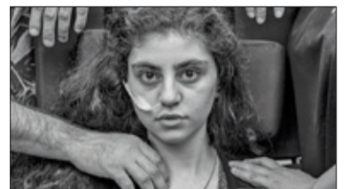
||| Podkowa Leśna – Nagrodzone przebudzenie s. 6