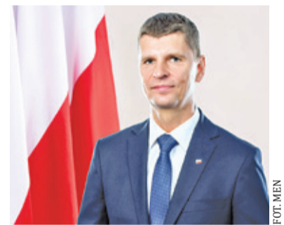
Minister edukacji podał również terminy egzaminów

Placówki oświatowe mają zostać zamknięte do 24 maja, a więc jeszcze przez miesiąc. Jak przyznał Piontkowski, obecne warunki nie pozwalają na ich otwarcie. Podał również więcej szczegółów dotyczących zbliżających się egzaminów. Jak zapowiedział, matury i egzaminy ósmoklasisty odbędą