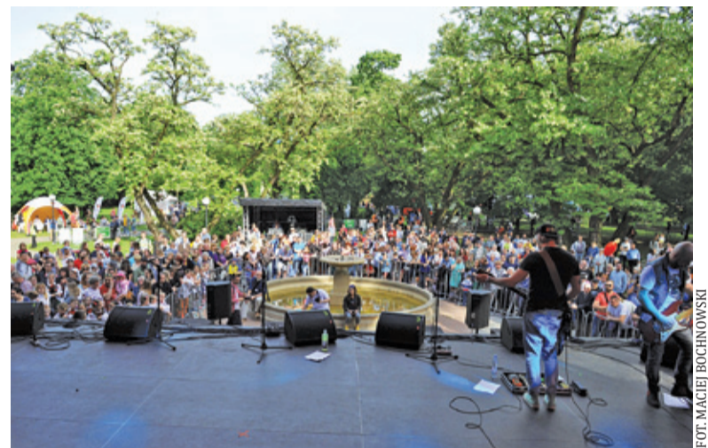
W 2019 roku mieszkańcy mogli cieszyć się dobrą zabawą

Muzyka, taniec, zabawa i liczne atrakcje – tak miało wyglądać tegoroczne świętowanie. Szykowała się trzydniowa zabawa. 29 maja planowano nightskating oraz dyskotekę plenerową prowadzoną przez didżeja Kalwi&Remi. W sobotę na scenie miały zaprezentować się gwiazdy polskiej estrady – Lady Pank, Majka Jeżowska i Maciej Maleńczuk. Na koniec zaplanowano liczne atrakcje dla najmłodszych