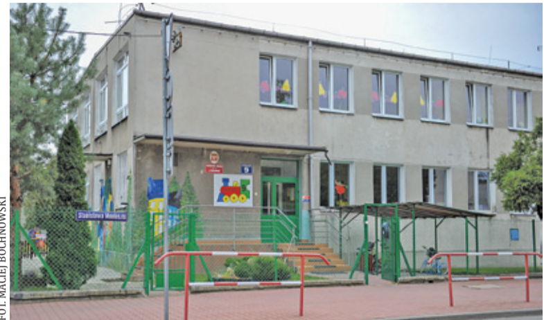
Przedszkole nr 9 w Pruszkowie