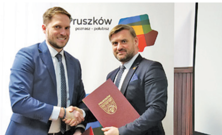
Umowa na wdrożenie systemu została podpisana w lutym

pruszkowskiej komunikacji. Kilka prostych czynności i już wiemy, ile mamy czasu do odjazdu autobusu i jak długo potrwa nasza podróż.