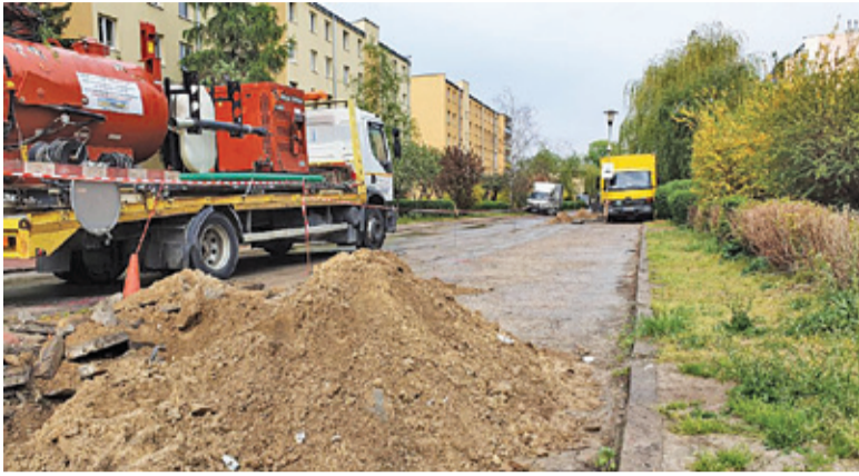
Modernizacja Wokulskiego to koszt 2,5 mln zł