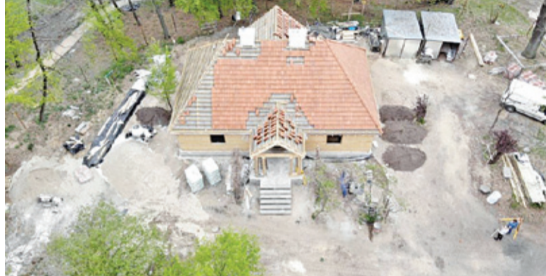
Aktualnie trwają prace dekarские, a wewnątrz zabytku układane są nowe instalacje

Zawarty w umowie zakres prac zakłada odtworzenie drewnianego, zabytkowego dworku wraz ze stylowym meblowaniem. Na terenie wokół posiadłości powstaną także ścieżki parkowe i ogródek domowy. Jak zapewnia magistrat, prace postępują w dobrym tempie. Wykonano już roboty związane z konstrukcją budynku, mostka i kładki. Obecnie kontynuowane są prace dekarские oraz wykonywane instalacje wewnętrzne w budynku. Termin za-