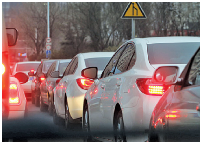
Budowa obwodnicy pozwoli wyprowadzić tranzyt z miasta i rozładować korki na drogach dojazdowych do autostrady

Na budowę trasy samorząd województwa zaplanował kwotę 193 mln zł. W ogłoszonym na początku roku przetargu zgłosiło się siedmiu wykonawców. Kiedy na początku kwietnia otwarto oferty, okazało się, że wszystkie mieszczą się w planowanym budżecie. Najtańszą propozycję złożyła firma Strabag – jej oferta opiewa na nieco po-