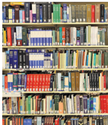
W bibliotece wolno nam przebywać krótko – tylko na czas niezbędny do wypożyczenia książek

Mieszkańcy mogą już korzystać z zasobów gminnej biblioteki mieszczącej się przy ul. 3 Maja 57. Nadal obowiązują jednak ograniczenia, z którymi warto się zapoznać, zanim wybierzemy się do Mediateki. Z jakimi obostrzeniami musimy się liczyć? Przede wszystkim zmieniono godziny pracy placówki. W poniedziałki, wtorki i środy zbiory będą dostępne w godz. 12.00-20.00. Co dwie godziny będzie prowadzona piętnastominutowa przerwa na dezynfekcję. W czwartki i piątki do Mediateki wejdziemy w godz. 12.00-17.00, z przerwą o 14.30. W soboty biblioteka będzie czynna od 10.00 do 14.00, a przerwa na dezynfekcję będzie o 12.00. W bibliotece mogą przebywać jednocześnie 4 osoby, przy czym rodzic lub opiekun prawny może wejść maksymalnie z dwójką dzieci poniżej 13 lat (starsze dzieci są traktowane jako samodzielne). Na podłogach wytyczono strefy zapewniające zachowanie bezpiecznej odległości. W bibliotece wolno