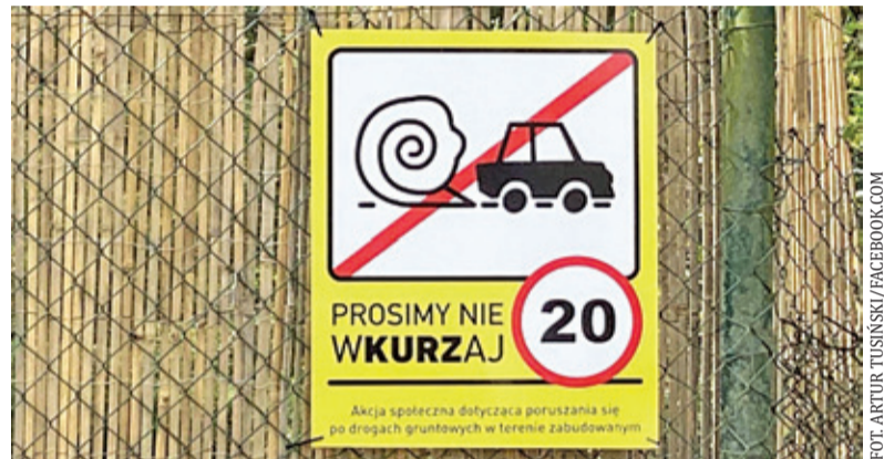
Tabliczki z apelem skierowanym do kierowców pojawiły się na ulicach miasta

– Mamy potworną suszę, co w przypadku mieszkańców dróg gruntowych niejednego może doprowadzić do pylicy płuc. Podkowanie proszą kierowców o zdjęcie nogi z gazu, przyłączam się do zainicjowanej akcji społecznej „Prosimy nie wKURZaj!” Miejmy wyobraźnię i bądźmy dla siebie życzliwi – prosi w