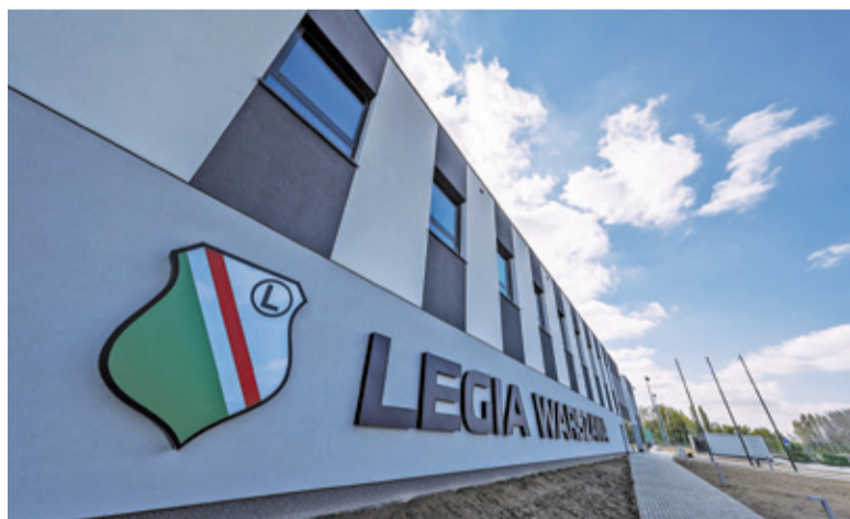
Legia Training Center to nowoczesny ośrodek szkoleniowy

Informujemy, że w związku z nieuregulowanymi płatnościami na najbliższy dzień roboczy zleciliśmy demontaż licznika. Szczegóły na epge-bok.pl/C3a Od: +48798479231