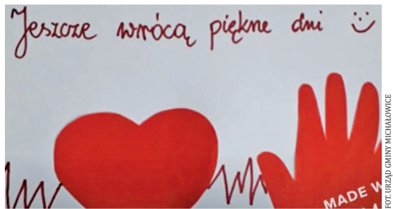
Dzieci dziękują medykom

Lekarze, pielęgniarki, farmaceuci, pracownicy medyczni to prawdziwi bohaterowie dzisiejszych czasów. Wątpliwości co do tego nie mają również dzieci. Przedшкоłaki z grup Żabki i Skrzaty oraz z oddziałów 0a i 0b Zespołu Szkolno-Przedшкоłowego w Nowej Wsi wzięły udział w akcji „Karta dla pracowników służby zdrowia”. Ołówki, kredki i flamastry poszły w ruch, a efektem wysiłku dzieci są piękne, pełne emocji i wdzięczności prace plastyczne. Stworzono z nich krótki filmik, który przedstawia dzieła przedшкоłaków. – Za waszą pomoc, wytrwałość, zaangażowanie w czasie pandemii koronawirusa – tak