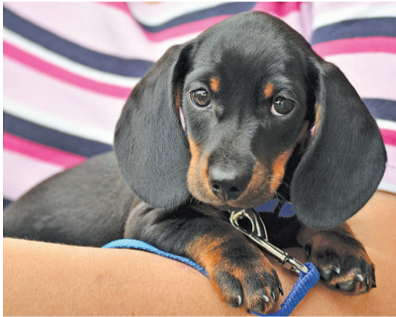
Konieczne jest złożenie wniosku

W przypadku zaginięcia zwierzęcia pojawiają się emocje i obawy właściciela, zaś dla czworonoga taka sytuacja jest niezwykle stresująca. Gdy pies bądź kot posiada mikroczip, można poznać dane opiekuna. Tym samym czworonóg szybko wróci do do-