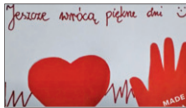
||| Nowa Wieś – Karta dla medyka s. 4