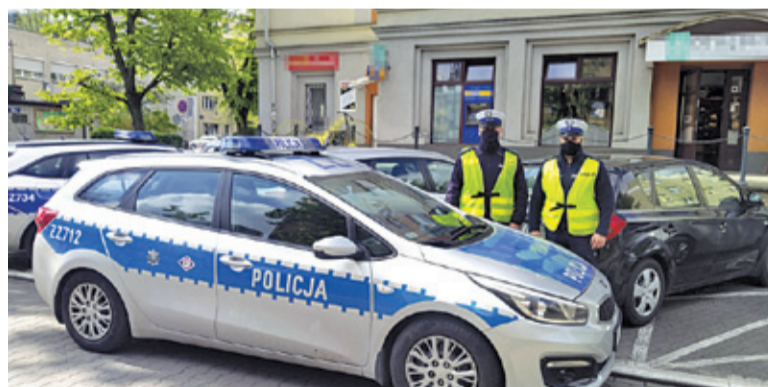
Jak widać, praca drogówki to nie tylko wlepianie mandatów piratom drogowym

– Policjanci każdego dnia pomagają ludziom w różnych, często bardzo