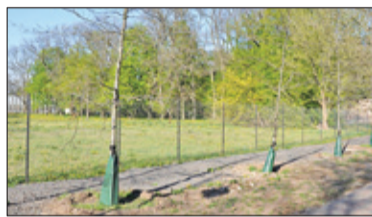
||| Brwinów – Nowatorskie podlewanie s. 4