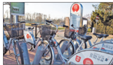
||| Grodzisk Mazowiecki – Restart miejskiego pedałowania s. 5