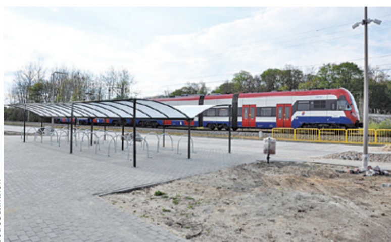
Oprócz miejsc parkingowych wybudowano również wiatę rowerową

ich więc 69. Na tę rozbudowę przeznaczono 155 tys. zł. Zakończono już etap opracowywania dokumentacji projektowej. Magistrat zapowiada otwarcie gotowego parkingu pod koniec czerwca.