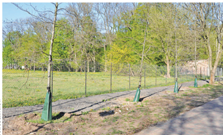
Hydrobufory zapewniają drzewom stały dostęp do wody, która jest uwalniana stopniowo do systemu korzennego roślin

Park miejski przy ul. Dworskiej wzbogacił się niedawno o nowe nasadzenia. Niektóre z drzew to dość duże okazy – Referat Ochrony Środowiska i Rolnictwa zdecydował się bowiem przesadzić tu rośliny, z miejsc, w których zagrażała im wycinka. Ukorzenianie w nowym miejscu wymaga jednak