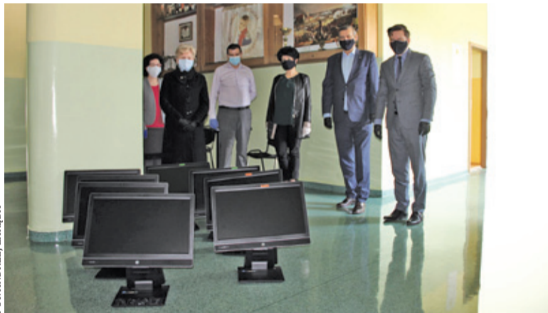
Komputery trafiły do szkół

P andemia koronawirusa wywróciła do góry nogami sytuację uczniów i nauczycieli. Edukacja odbywa się online, a więc niezbędne są komputery i dostęp do Internetu. Problem w tym,