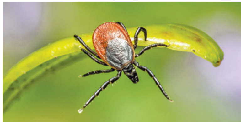
Nie wszystkie kleszcze przenoszą choroby

Po powrocie do domu trzeba zdjąć ubranie i wytrząść je, na przykład nad wanną. Potem dokładnie trzeba obejrzeć całe ciało. Kleszcze najczęściej wbijają się w miejsca gdzie jest najcięższy naskórek: na głowie przy linii włosów i za uszami, w szyję, pod pachami, w zgięciu ręki, w okolicach pępka, w pachwinach, pod kolanami i w okolicach ścięgna Achillesa.