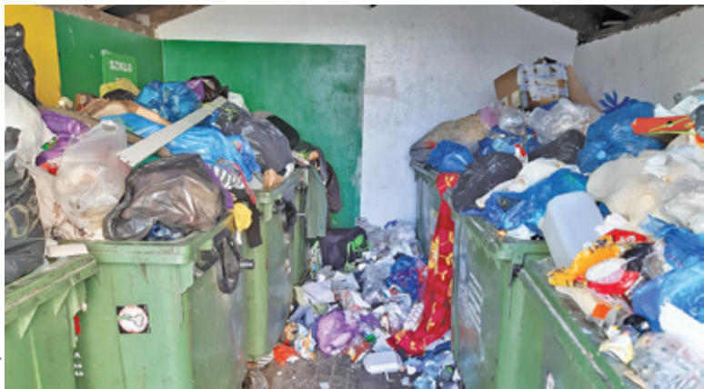
W ostatnim czasie koszty odbioru i obsługi odpadów ostro poszybowały w górę