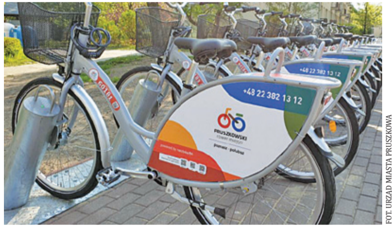
Sezon wystartował 6 maja

Mieszkańcy Pruszkowa mogą wypożyczać rowery w 13 stacjach. W tym roku pojawiły się dwie nowe: w rejonie Al. Niepodległości i ul. Chopina oraz przy ul. Mickiewicza. Rowery czekają na użytkowników również w następują-