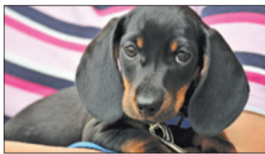
||| Raszyn – Bezpłatne czipowanie s. 2