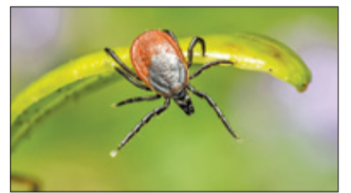
||| Kraj – Sezon na kleszcza s. 6