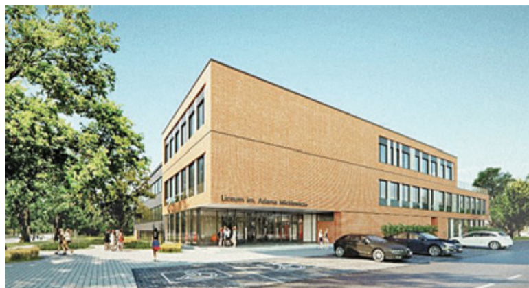
Tak ma wyglądać liceum po rozbudowie

Głównym przedmiotem zadania jest rozbudowa placówki, aby stworzyć młodzieży odpowiednie warunki. Ich gwarantem mają być nowa część liceum, część biblioteczna oraz remont obecnego obiektu. Ponadto, w ramach inwestycji przewidziano budowę hali sportowej. Prace ruszyły rok temu, a wartość całego zadania to ponad 80 mln zł. Efekty mają być widoczne w 2021 roku. Warto podkreślić, że inwestycja została podzielona na etapy. Obecnie wykonano ok. 70% pierwszego z nich. – W budynku hali sportowej trwają prace wykończeniowe i malarskie. Zakończo-