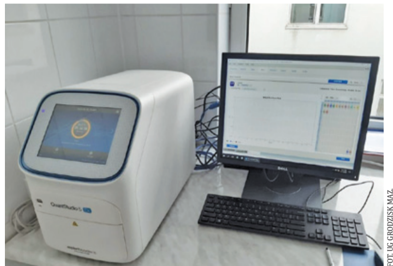
Personel i pacjenci szpitala, osoby wychodzące z kwarantanny oraz pracownicy oświaty mogą liczyć na bezpłatny test na obecność SARS-CoV-2

Każda dostępna maszyna do testów jest obecnie na wagę złota. Przykłady