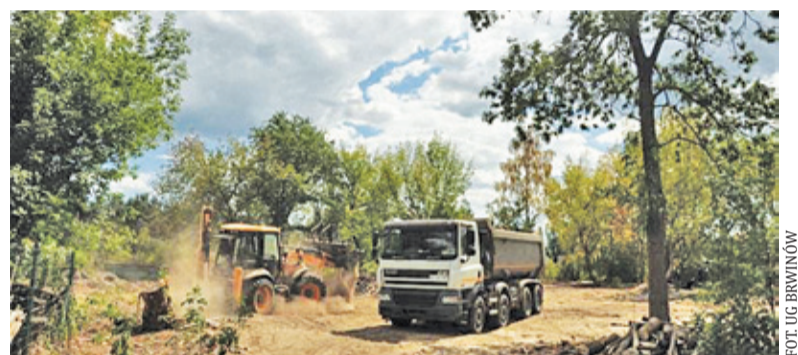
Obecnie na działce przy ul. Piłsudskiego trwają prace przygotowawcze

Nowy budynek ma mieć 429 m 2 , w tym 404 m 2 powierzchni użytkowej. Na dwóch kondygnacjach znajdą się m.in. dwie pracownie, aneks kuchenny, sala główna oraz toalety przystosowane do potrzeb osób z niepełnosprawnościami.