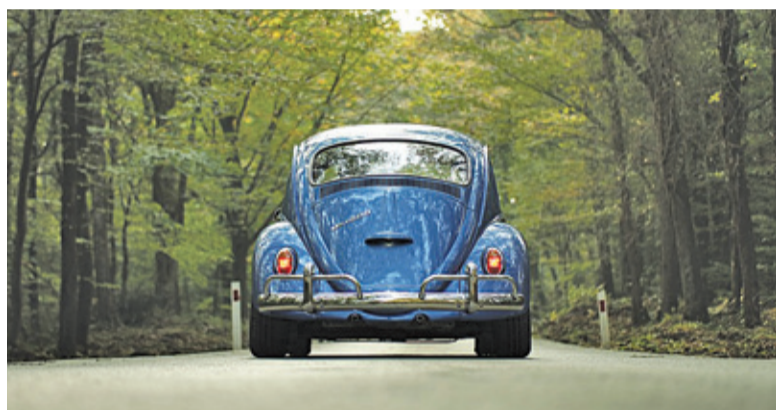
Wystarczy wejść na esp.pwpw.pl

dów i załatwiania spraw związanych z prawem jazdy przez Internet. Szybko, sprawnie i wygodnie – tak ma wyglądać cały proces. Mieszkańcy mogą korzystać z nowego narzędzia w postaci elektronicznej skrzynki podawczej systemu „Pojazd i kierowca”. Sprawa wygląda wręcz banalnie. Wystarczy zarejestrować się, następnie kliknąć w link aktywny, który otrzymamy na podany adres e-mail. Kolejny krok to zalogowanie się do systemu, wybór urzędu oraz sprawy do załatwienia. Elektroniczna skrzynka podawcza dostępna jest pod adresem: www.esp.pwpw.pl .