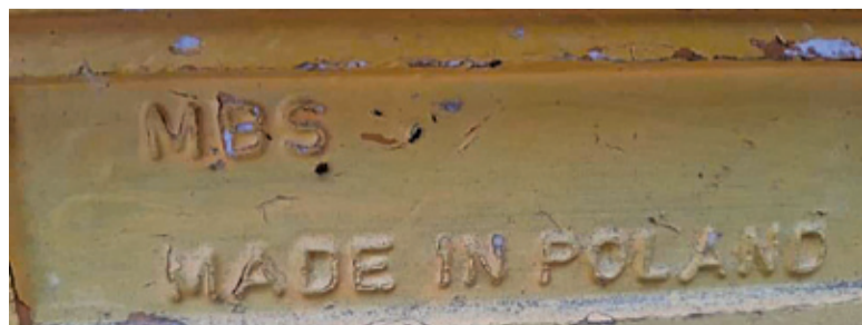
Skradzione ule są charakterystyczne – wykonane ze styropianu i sygnowane

ły tylko ślady opon i puste miejsce po 10 ulach. Sprawa została oczywiście zgłoszona policji, ale sąsiedzi i rodzina próbują też szukać ukradzonej pasieki