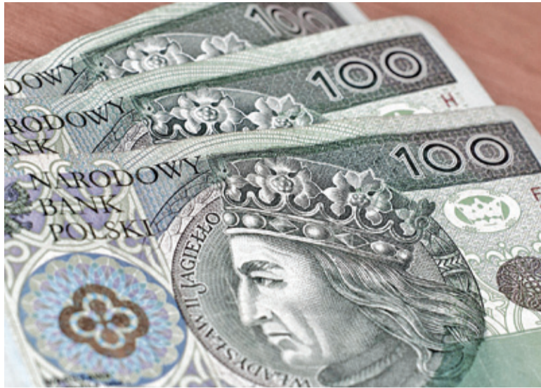
Dodatek ma wynieść 310 zł

Jedno jest pewne: wspólnym mianownikiem wszystkich stron była kwota dodatku w wysokości 310 zł. Uwagi do projektu przedstawionego przez radnych miał prezydent Makuch. Dokument budził wątpliwości radcy prawnego. – Są to wątpliwości związane z procesem prowadzonych uzgodnień części regulaminu. W trakcie analizowania całego procesu pojawiają się pytania, na które na obecnym etapie