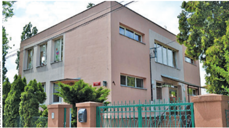
Przedszkole miejskie nr 7 w Pruszkowie

Kwestia otwarcia przedszkoli wywołała liczne dyskusje. Niejednokrotnie