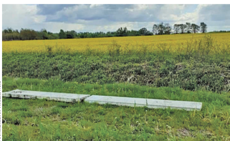
Rankiem 12 maja pszczelarz zastał tylko puste podkładki