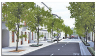
||| Pruszków - Główne ulice czekają zmiany s. 4