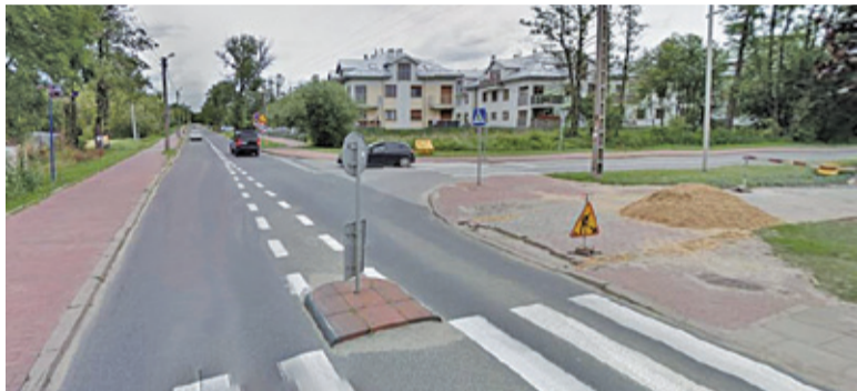
W tym miejscu jeszcze w tym roku ma powstać rondo

Trwa ocena formalno-merytoryczna złożonych ofert. Po jej zakończeniu poznamy wykonawcę, który powinien zakończyć prace do 10 grudnia br.