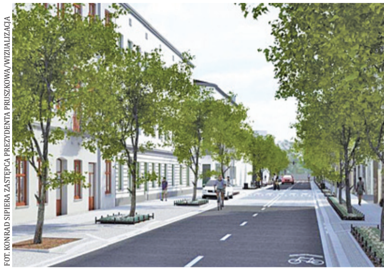
Drogi mają zyskać nową jakość

W ubiegłym roku gruntowną przebudowę przeszła ul. Stalowa w Pruszkowie. Przez wiele lat kierowcy narzekali na stan nawierzchni, jednak w końcu nadszedł czas na zmiany. Stalowa zmieniła się nie do poznania, a koszt inwestycji wyniósł ponad 5,8 mln zł, z czego 4,5 mln zł pochodziło z Funduszu Dróg Samorządowych.