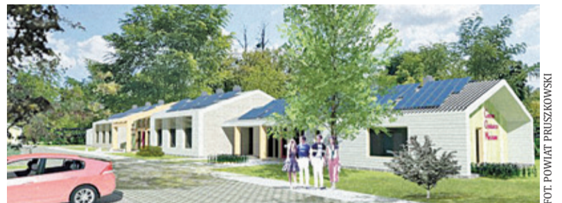
W PCOM będzie mogło przebywać 30 osób