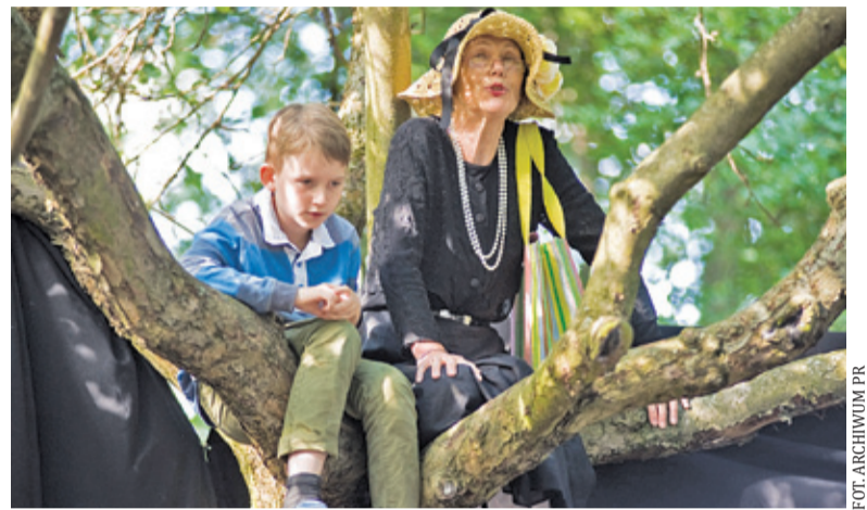
Organizatorzy zapraszają gości do swoich ogrodów, w których odbywają się rozmaite koncerty, spektakle i inne wydarzenia kulturalne

Tradycja Festiwalu Otwarte Ogrody sięga 2005 r. Impreza została zainicjowana w Podkowie Leśnej, na 80. urodziny miasta. Od tamtej pory festiwal objął swoim zasięgiem m.in. Milanówek, Brwinów, Zalesie Dolne, Konstancin-Jeziornę, Józefów czy warszawską Sadybę. Ideą imprezy jest ochrona dziedzic-