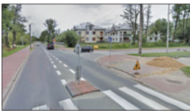
||| Grodzisk Mazowiecki - Rondo w cenie s. 2

GRODZISK MAZOWIECKI ||| BARANÓW ||| JAKTORÓW ||| PODKOWA LEŚNA ||| MILANÓWEK ||| ŻABIA WOLA P R U S Z K Ó W ||| P I A S T Ó W ||| B R W I N Ó W ||| M I C H A Ł O W I C E ||| N A D A R Z Y N ||| R A S Z Y N