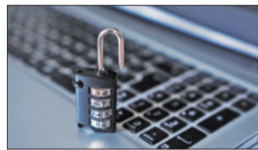
||| Kraj - Ostrożność w sieci s. 5