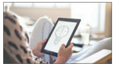
||| Pruszków - Kupią tablety dla uczniów s. 5