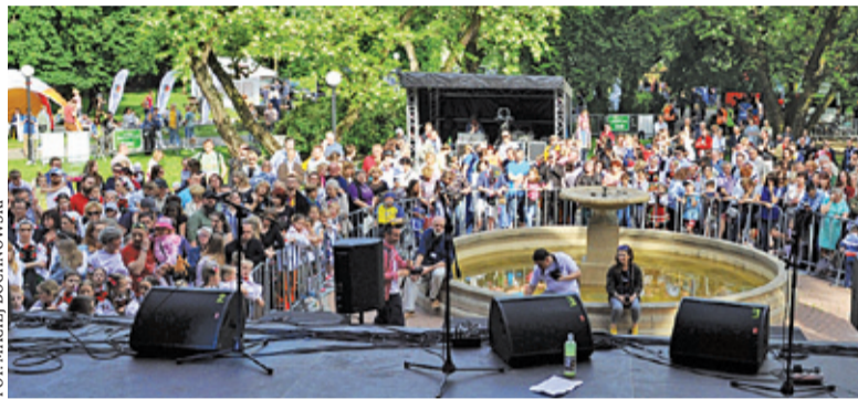
W tym roku publiczność nie zbierze się pod sceną

Kolejnego dnia szykują się wyzwania dla dzieci. 31 maja o 9.00 wystartuje konkurs plastyczny „Pruszków! Poznasz – polubisz”. Godzinę później coś dla zdrowia i formy, czyli gimnastyka dla najmłodszych. O 12.00 dzieci z klas 4-8 będą mogły sprawdzić swoją wiedzę w