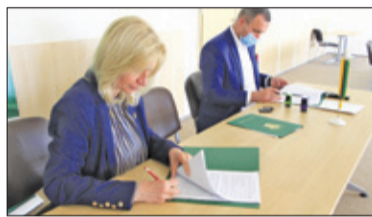
||| Michałowice - Przebudowa za 3,5 miliona s. 2