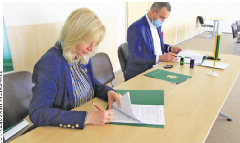
Wartość umowy to ponad 3,5 mln zł

W działania związane z budową rowu U1, nazywanego czasem Regułą, zaangażowane są Michałowice, Pruszków, Piastów oraz warszawski Ursus. Inwestycja jest złożona, a jej po-