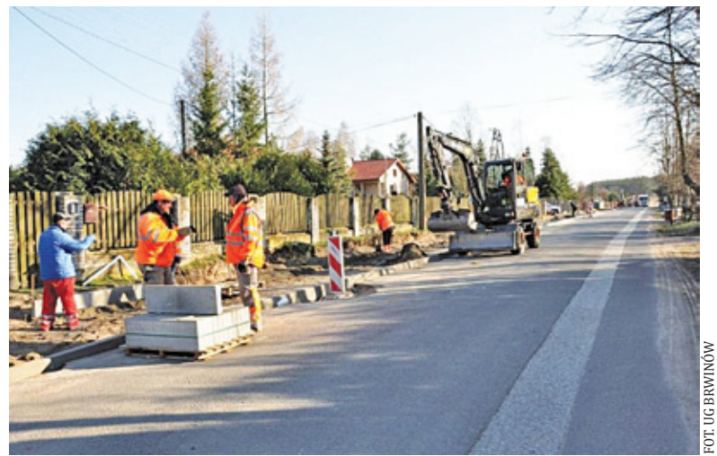
Realizowane obecnie prace są częścią większego projektu rozbudowy sieci dróg rowerowych

Realizowane obecnie prace są częścią większego projektu rozbudowy sieci dróg rowerowych w gminie Brwinów.