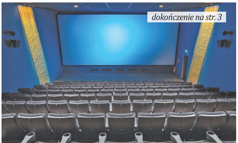
dokończenie na str. 3