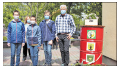
||| Michałowice – Szkoła pozyskuje deszczówkę s. 6