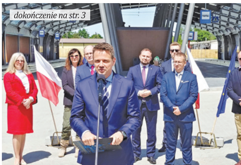
dokończenie na str. 3

Na tę inwestycję mieszkańcy Nadarzny czekali już od dawna. Plany budowy dużego parkingu połączonego z pętlą autobusową napotkały trudności już na początku drogi. Przetarg na realizację musiał być kilkakrotnie unieważniany z uwagi na zbyt wysokie ceny oferentów. Dopiero po kilku miesiącach, pod koniec 2018 r. udało się wyłonić wykonawcę.