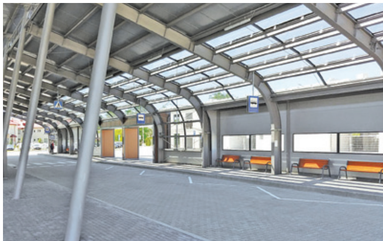
Budowa parkingu trwała blisko rok i kosztowała 6,7 mln zł

Na razie na nowym dworcu zatrzymują się linie 711, 733 oraz autobusy podmiejskie kursujące między Nadarżynem a Pruszkowem. Od 15 czerwca