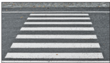
||| Pruszków – Aktywne przejścia dla pieszych s. 6