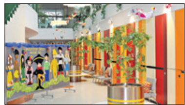
||| Raszyn – Bez dyżurów wakacyjnych s. 2