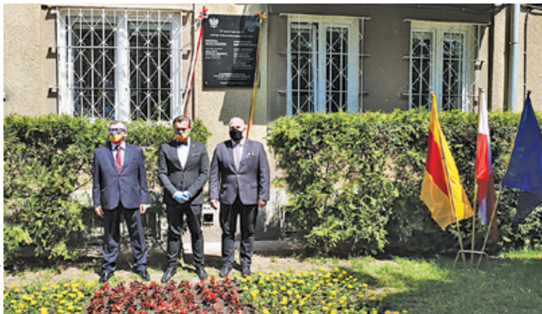
Pamiątkowa tablica została odsłonięta 27 maja

Wspomniano również, że podczas wyborów samorządowych w 1990 roku mieszkańcy Pruszkowa wybrali 32 radnych. Prezydentem miasta został Kon-