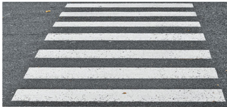
Aktywne przejścia powstaną w trzech lokalizacjach

– Całość systemu powinna działać w synchronizacji z zainstalowanymi czujnikami ruchu i zmiernicami. Lamy winny „rozjaśnić się” po pobudzeniu czujnika przez pieszego. System winien być zsynchronizowany z uruchamianiem się punktowych aktywnych elemen-