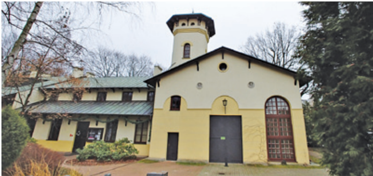
Muzeum Starożytnego Hutnictwa Mazowieckiego