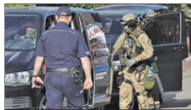
||| Komorów – Oblężenie na Rubinowej s. 4