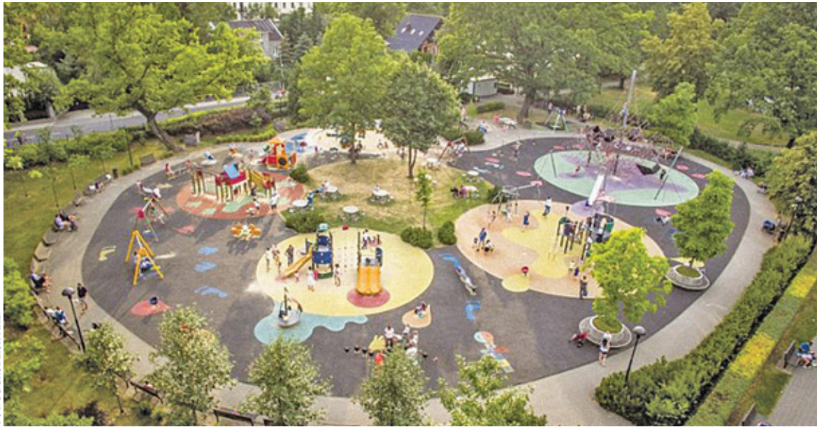
Park przy ul. Bałtyckiej wyróżnia ciekawe założenie projektowe: ścieżki piesze i rabaty roślinne nawiązują kształtem do meandrującej rzeki