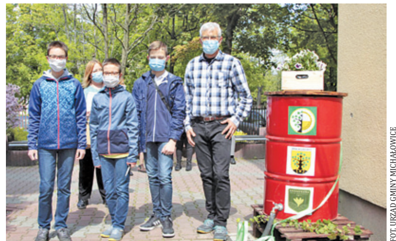
Przy szkole w Michałowicach uruchomiono „wodołapacz”

To początek działań związanych z zbieraniem deszczówki w gminie Michałowice. Podczas ostatniej sesji radni