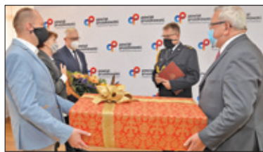
||| Pruszków – Podziękowanie dla komendanta s. 2