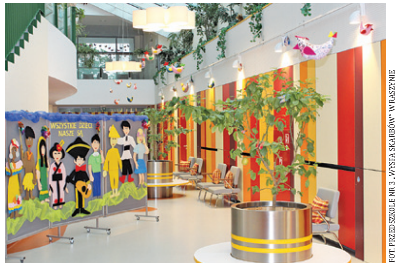
Zamiast dyżurów wakacyjnych dzieci będą przebywać w swoich przedszkolach

rząd dał zielone światło do otwierania żłobków oraz przedszkoli. 11 maja taki krok uczyniły placówki z terenu gminy Raszyn. Urząd przekazał do przedszkoli pakiety startowe w postaci środków bezpieczeństwa. Część rodziców ko-