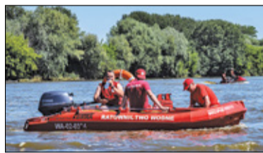
||| Kraj - Nad wodą najważniejszy jest rozsądek s. 5