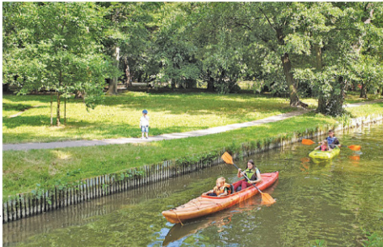
Bezpłatna wypożyczalnia kajaków jest dostępna przez siedem dni w tygodniu

Z pewnością wiele osób z atrakcji będzie chciało skorzystać w weekend.