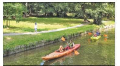
||| Pruszków - Czas na kajaki s. 6