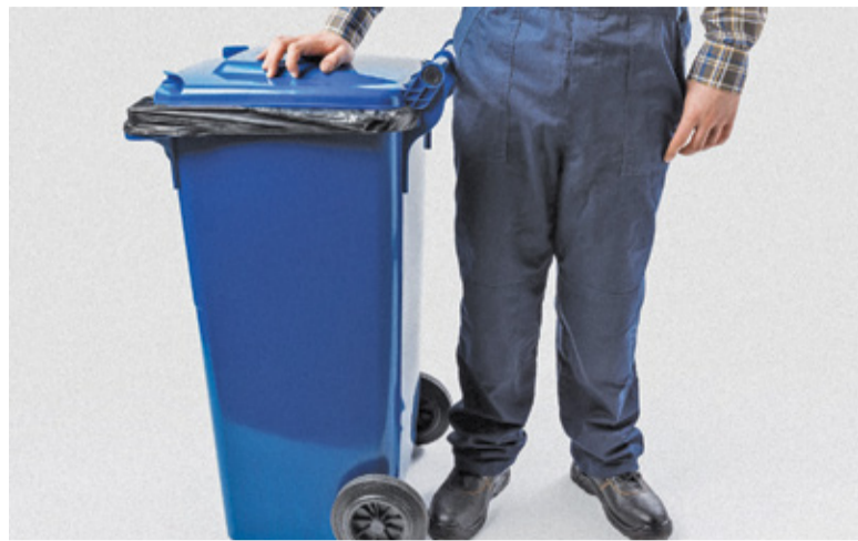
Karta Dużej Rodziny daje zniżkę w opłatach za śmieci

Od 1 lipca mieszkańcy Piastowa w zabudowie jednorodzinnej będą płacić 35 zł za osobę za odbiór odpadów. Z kolei w przypadku budownictwa wielorodzinnego sytuacja wygląda inaczej. Opłata będzie pobierana od ilości zużytej wody. Za metr sześcienny mieszkaniec zapłaci 10 zł. Przyjmuje się, że miesięcznie na osobę przypada 3,5 m 3 , a więc wychodzi 35 zł. Warto wspomnieć o możliwych ulgach. Rodziny wielodzienne posiadające Kartę Dużej Rodziny mogą liczyć na zniżkę w wysokości 5 zł od osoby w zabudowie jednorodzinnej oraz 1,40 zł od m 3 w wielorodzinnej. Przewidziano również ulgi dla kompostujących odpady zielone. W tym przypadku opłata będzie niższa o 1 zł od osoby. Opłaty za okres lipiec-