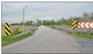
||| Powiat pruszkowski - Milion na rozbudowę drogi s. 4