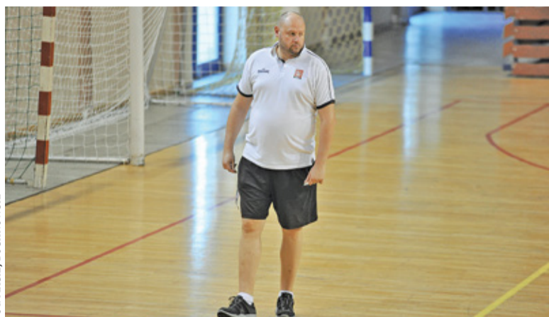
Szkoleniowiec ma za sobą 58. spotkanie w roli trenera Elektrobudu