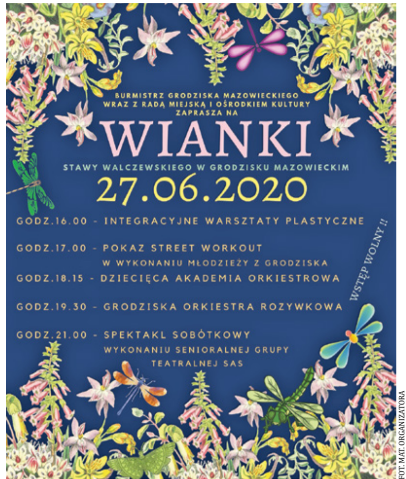
W sobotę 27 czerwca powitamy lato na Stawach Walczewskiego

Wszystkie te trudności nie zniechęciły jednak Centrum Kultury do organizacji tradycyjnych już Grodziskich Wianków. W sobotę 27 czerwca powitamy lato na Stawach Walczewskiego. Jednak tegoroczna impreza będzie skromniejsza, niż w latach poprzednich.