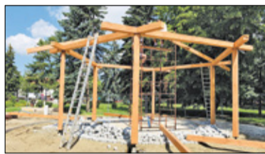
||| Pruszków - Tężnia w budowie s. 4