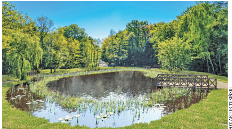
Tak miałyby wyglądać staw po rewitalizacji. O ile władzom miasta uda się doprowadzić sprawę do finału

Wiele wskazuje na to, że przed nami kolejna odłona przepychanek wokół podkowieńskiego stawu. Tusiński poinformował niedawno, że skupiona w Dendropolis grupa aktywi-