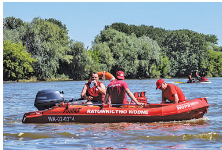
RCB przypomina, aby pływać tylko w wyznaczonych miejscach

puszczalne normy wiąże się z grzywną w wysokości do 500 zł. Jeśli policjant stwierdzi, że użytkownik sprzętu pływającego nie jest w stanie kontynuować podróży, może zarządzić odholo-