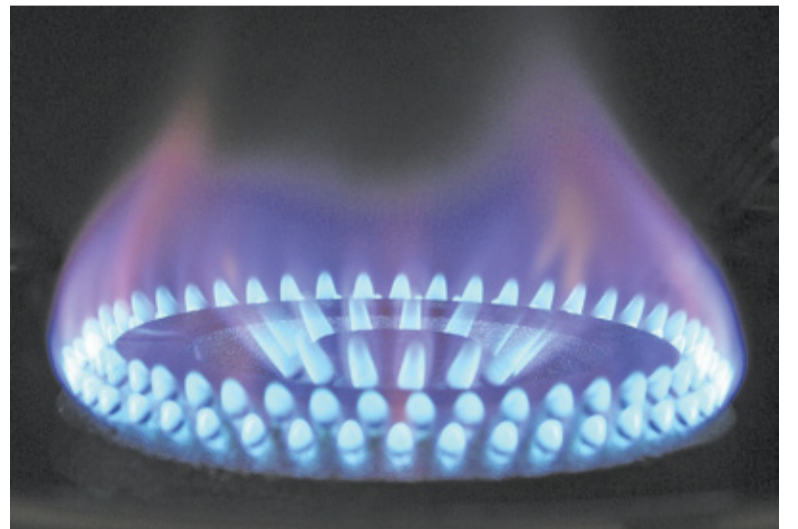
Inwentaryzacja obejmie wszystkich mieszkańców

Inwentaryzacja potrwa do października br. i obejmie wszystkich mieszkańców. W przypadku zabudowy jednorodzinnej informacje będą zbierali ankieterzy pracujący w godzinach 8.00-20.00. W razie wątpliwości, dane