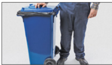
||| Piastów - Nowe stawki za odpady s. 2

P R U S Z K Ó W ||| P I A S T Ó W ||| B R W I N Ó W ||| M I C H A Ł O W I C E ||| N A D A R Z Y N ||| R A S Z Y N