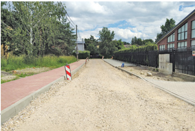
We wrześniu droga ma być gotowa