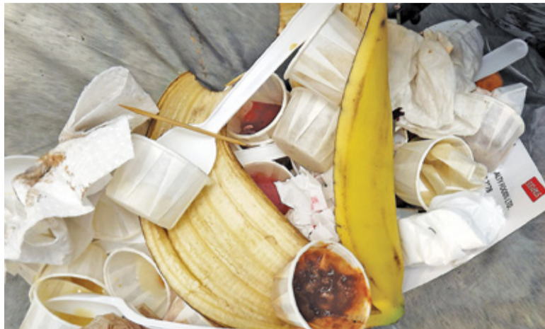
1 lipca wszedł w życie bezwzględny obowiązek segregowania śmieci. Za jego nieprzeżegowanie będzie nam grozić kara

Nowe regulacje rządowe nie są jedynym źródłem podwyżki cen. Wynika ona również z kwot, jakich zażądały firmy, które stanęły do przetargu. Przypomnijmy, że grodziski magistrat