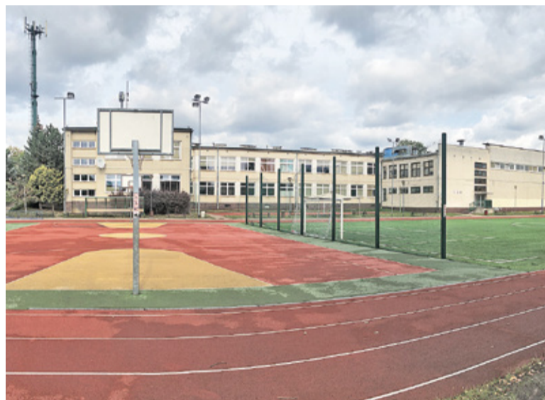
Szkoła w Michałowicach

Modernizacja obiektu przedszkolnego i biblioteki w Nowej Wsi ma dotyczyć elewacji oraz obróbek blacharskich