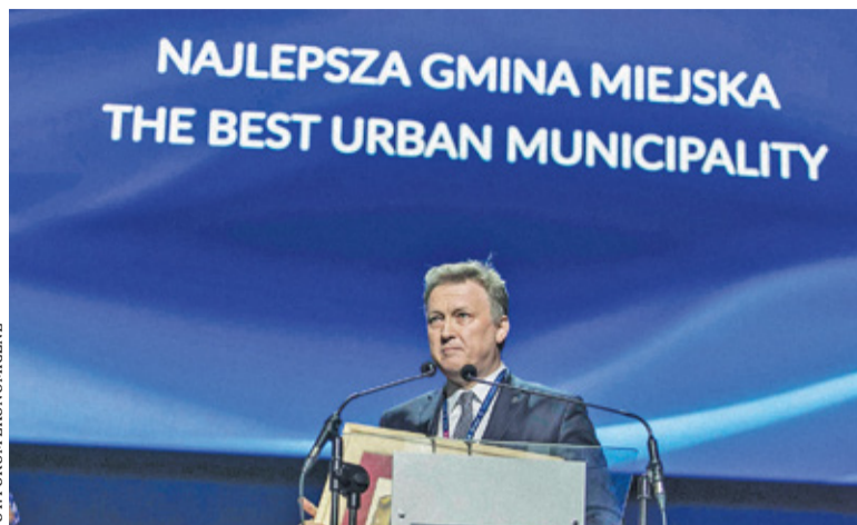
W zeszłym roku Podkowa Leśna zajęła pierwszą lokatę, w tym roku uplasowała się na trzecim miejscu

W opublikowanym właśnie rankingu wysokie miejsca zajęły gminy z naszych terenów. Trzecie miejsce w swojej kategorii (gmina miejska) zajęła Podkowa Leśna, którą wyprzedziły tylko Józefów i Puszczykowo. Piąte miejsce w kategorii gmin miejsko-wiejskich awansował Brwinów. Z kolei w kategorii gmin wiejskich również piątą lokatą może pochwalić się gmina Michałowice.