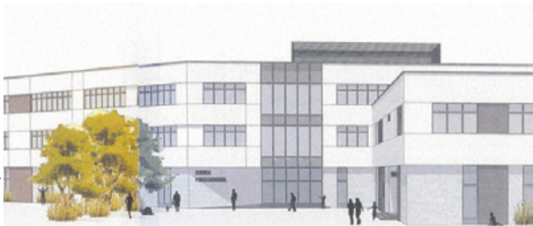
Wizualizacja nowej placówki oświatowej