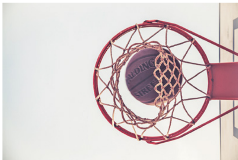
Czosnowski ostatnio grał w Dzikie Warszawa

w wieku 16 lat. W Zniczu Basket koszykarz występował w latach 2011-2016, zaliczył 131 ligowych spotkań. Z Pruszkowa trafił do SKK Siedlce, gdzie grał przez dwa sezony. Następnie reprezentował barwy drużyny Żubry Leo-Sped