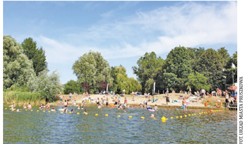
Kąpielisko będzie działało do 31 sierpnia

Pamiętajmy, aby korzystać z kąpieliska z zachowaniem rozsądku i odpowiedzialności. W Parku Mazowsze nad bezpieczeństwem czuwać będą ratownicy z miejskiej pływalni „Kapry”. – Życzymy radosnego i bezpiecznego spędzania czasu w Parku Mazowsze – zapraszają pruszkowscy urzędnicy.