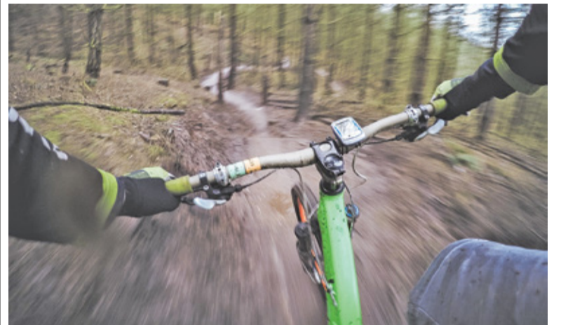
Każdy może wziąć udział w akcji

Aktywne lato w gminie Michałowice to nie tylko ruch, ale i rywalizacja.