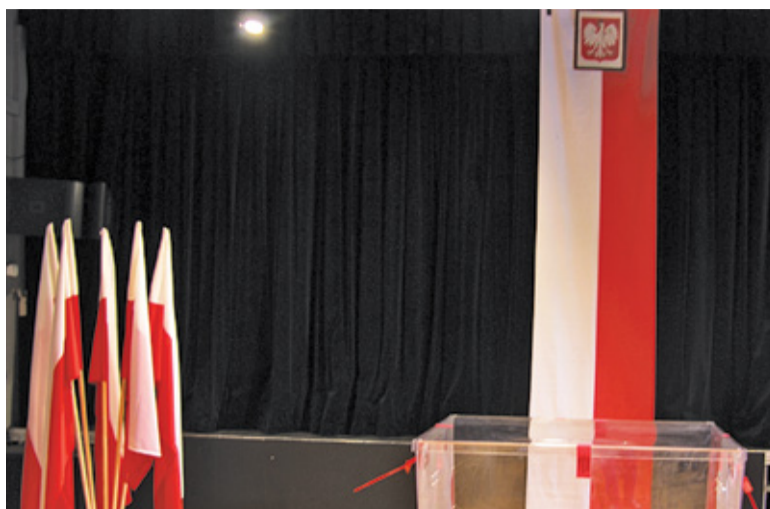
12 lipca czeka nas dogrywka między Rafałem Trzaskowskim a Andrzejem Dudą

Milanówek postawił na Rafała Trzaskowskiego, który otrzymał 41,18% głosów. Andrzej Duda uzyskał wynik