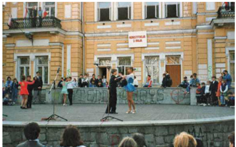
Tak prezentowały się „dechy”

Pałacyk Sokoła jest jednym z najbardziej rozpoznawalnych obiektów w Pruszkowie. Swego czasu przed budynkiem mieściły się tzw. „dechy”, czyli scena plenerowa. Miejsce miało swój klimat, służyło zabawie i tworzyło wyjątkową scenografię. Zniknęło jednak przy okazji modernizacji pałacu. W miejsce „dech” pojawiła się fontanna, z którą jest obecnie problem. Woda w niej nie wygląda najlepiej. Przyczyną jest awaria przyłącza energetycznego oraz mechanizmu odprowadzania wody z niecki fontanny. Z tego powodu dochodzi do zalewania piwnicy w pałacu.