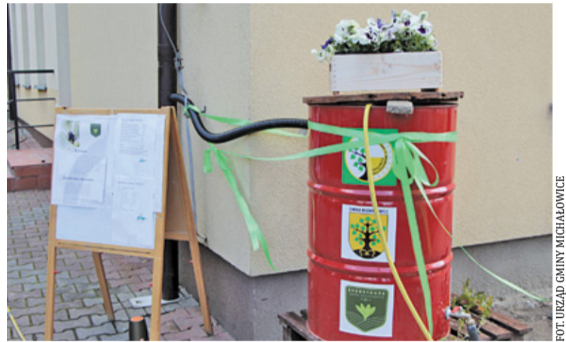
Wodołapacz przed szkołą w Michałowicach

jest na zbiornik na deszczówkę, pompę do beczki oraz dorynnowy zbieracz wody deszczowej. Dofinansowanie można uzyskać do 6 elementów (maksymalnie po dwa każdego rodzaju). Co istotne, zakupu można dokonać dopiero po podpisaniu umowy na dotację celową.