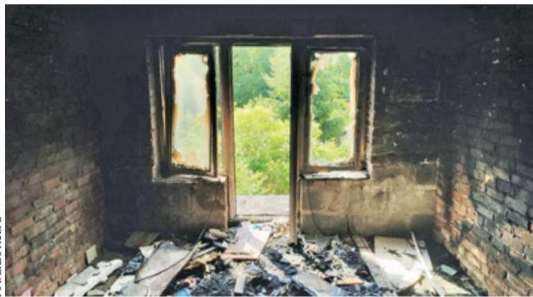
Aby dom nadawał się do ponownego zamieszkania, potrzebny będzie generalny remont

Aby przywrócić dom do stanu używalności, potrzebne będzie minimum