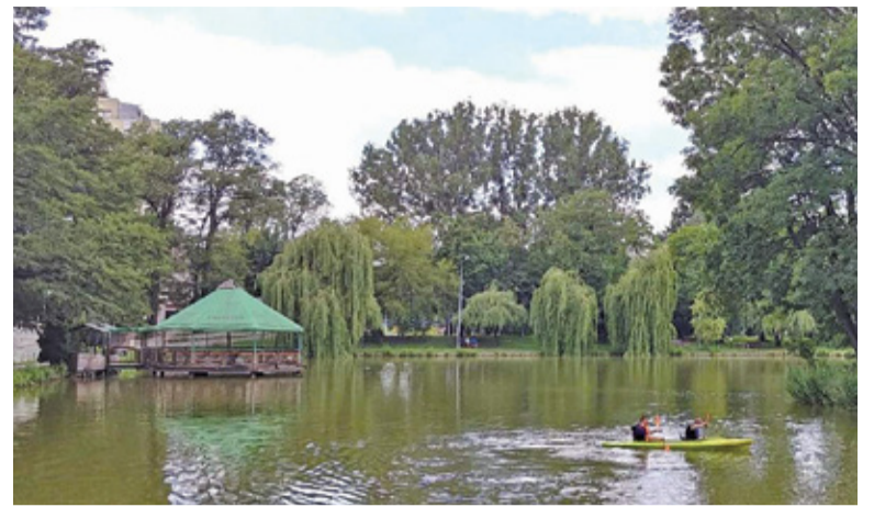
Staw w Parku Potulickich

czy siłownie zewnętrzne oraz bogata roślinność. Niejednokrotnie parki bywają również miejscem organizacji licznych wydarzeń, m.in. koncertów i imprez sportowych. Trzeba jednak pamiętać, że niezwykle ważna jest troska o utrzymanie terenów zielonych. Miasto Pruszków planuje przeprowadzić zmiany w dwóch parkach.