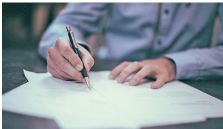
Najpierw konieczny jest projekt

ny do Utraty poniżej zalewu. Z kolei w kierunku ul. Komorowskiej wody opadowe gromadzone są w zbiornikach retencyjno-chłonnych. Przelewają się one do kanału deszczowego w poboczu ul. Długiej. Z pozostałych ulic wody trafiają