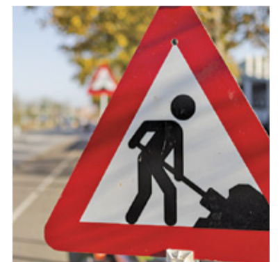
Dokumenty musiały przejść obowiązkową dezynfekcję, po której nie dotarły na czas do właściwego wydziału

Są i dobre wiadomości. Wszystkie otwarte 21 lipca oferty mieszczą się w zakładanym budżecie. Gmina zaplanowała wydać na remont al. Sadowej pół miliona złotych, tymczasem zaproponowane w przetargu ceny wahają się od 356 tys. zł do 492 tys. zł. Można się zatem spodziewać, że w nowym postę-