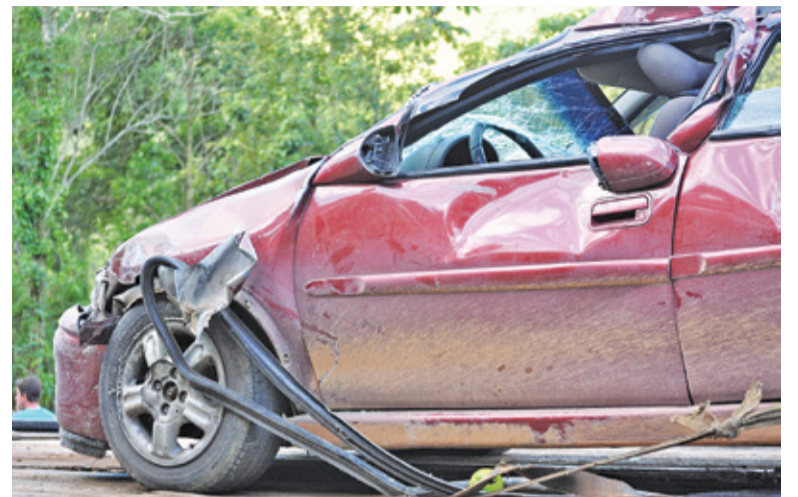
Rokrocznie w okresie wakacyjnym na drogach dochodzi do setek śmiertelnych wypadków

Wakacje to czas odpoczynku i podróży. Staramy się wykorzystać każdą wolną chwilę, by wybrać się na plażę czy nad jezioro. Dla policji wakacje to jednak okres wytężonej pracy. Statystyki są nieubłagane: rokrocznie w ciągu letnich miesięcy na drogach dochodzi do setek wypadków śmiertelnych. Od początku wakacji odnotowano już 198 takich zdarzeń – to średnio pięć wypadków dziennie. Aby uświadomić skalę problemu, Komenda Główna Policji przygotowała Mapę Wypadków Drogowych. To interaktywna mapa, aktualizowana na bieżąco. Klikając na czarny punkt na mapie dowiemy się, jaki był charakter zdarzenia i ile osób straciło życie. Projekt był już realizowany w zeszłym roku i spotkał się z pozytywnym odbiorem w społeczeństwie, dlatego w tym roku przygotowano kolejną edycję, wzbogaconą o dodatkowe funkcjonalności. – Bieżąca aktualizacja, w tym wizualizacja danych, ma na celu zwrócenie uwagi na skalę tragedii do jakich dochodzi na polskich drogach, skłonienie do refleksji użytkowników dróg oraz zachęcenie mediów do dyskusji na temat bezpieczeństwa w ru-