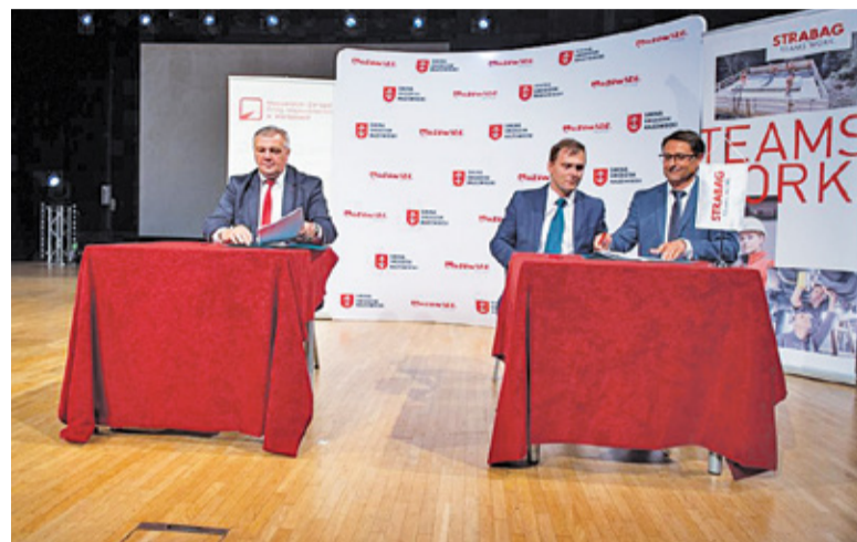
Wykonawcą została firma Strabag, która powinna zrealizować prace w ciągu 27 miesięcy