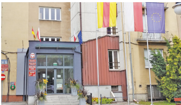
Obecna siedziba urzędu

pod ewentualny montaż paneli fotowoltaicznych. Gotowy obiekt zostanie sprzedany miastu w drugiej połowie 2021 roku. Od razu będzie możliwa przeprowadzka urzędu.