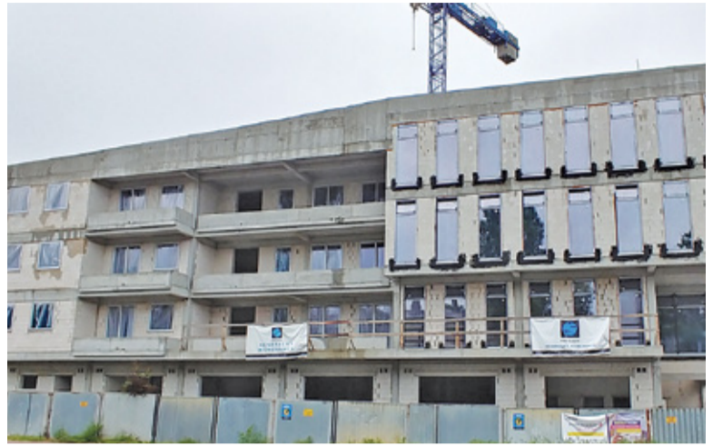
Budynek przy Armii Krajowej

Powierzchnia budynku wynosi 2300 m 2 . Obiekt przy Armii Krajowej zostanie wyposażony w podziemny parking na 52 samochody. Na parterze miałyby znaleźć się wydział obsługi mieszkańca, a także miejsce do zabawy dla dzieci, pokój dla matki i dziecka. Budynek będzie wyposażony m.in. w sieć światłowodową, klimatyzację, techno-