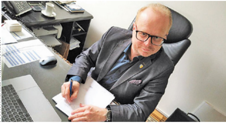
Udzielenie wotum zaufania burmistrzowi było kluczową decyzją