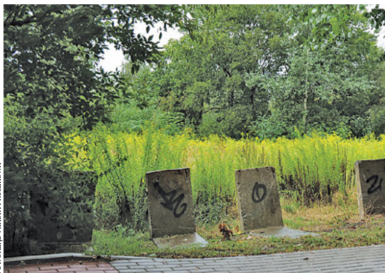
Inwestycja obejmuje budowę łącznika ulic Piastowskiej i Dolnej

Dla mieszkańców i kierowców kluczowe znaczenie ma odpowiedni układ komunikacyjny, który pozwala na bezproblemową komunikację. Samorządy modernizują drogi, uzupełniają ubytki, ale także budują nowe ulice. Mieszkańcy pruszkowskich Malich na rozwiązanie kwestii wyjazdu w kierunku miasta oraz Warszawy czekają od lat.