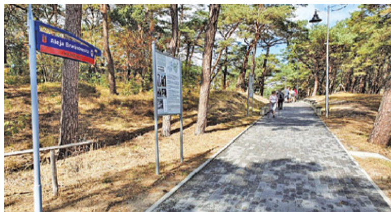
Aleja Brwinowska to 250-metrowa promenada biegnąca z centrum miasta na plażę